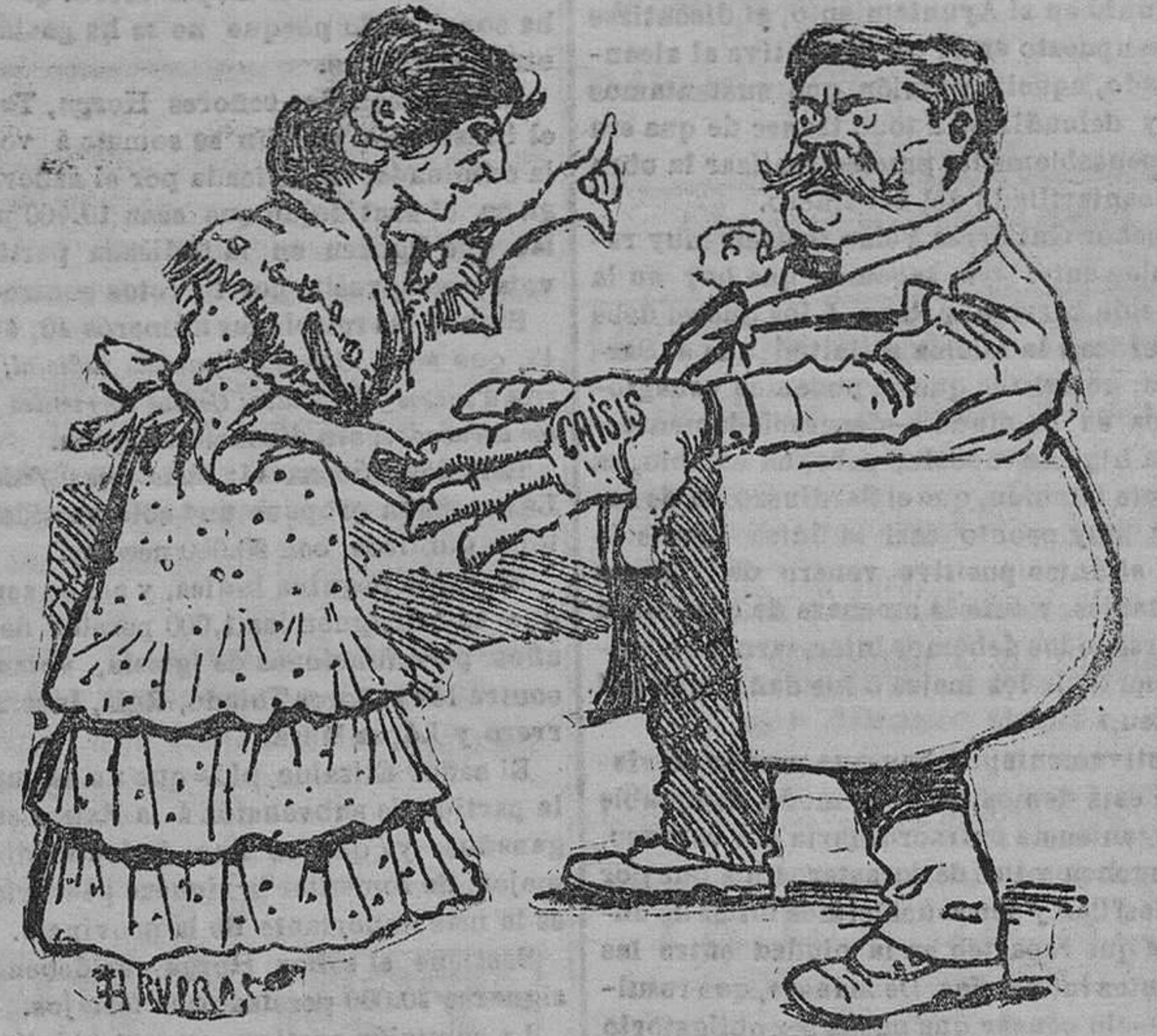
“LA MALA VENTURA”

(Especial para EL CANTABRICO) POR ARVERAS