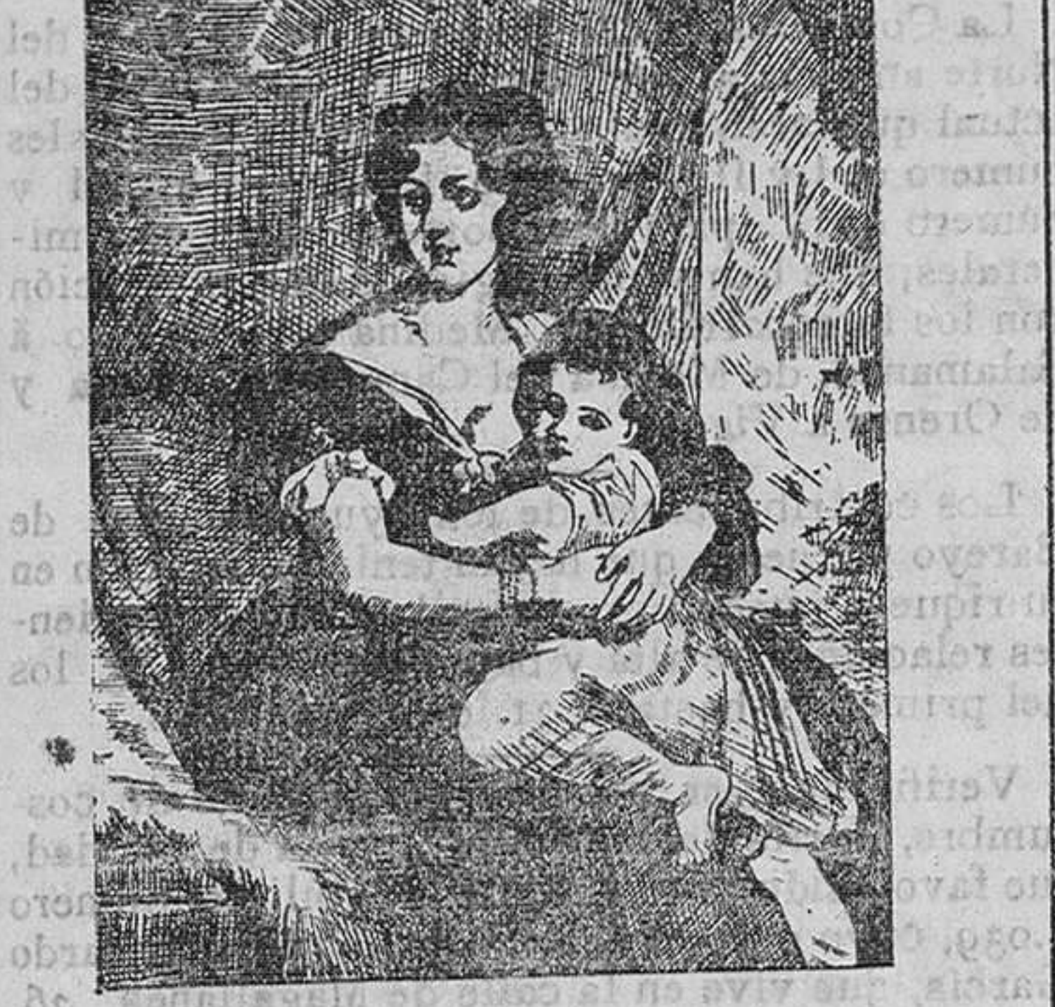
Fue Sir Tomás Lawrence el último de los retratistas ingleses que lograron apasionar á la flamante aristocracia de su país.

7 DE ENERO DE 1830.—Murió en su casa de Russel-Square, el célebre pintor Sir Tomás Lawrence.