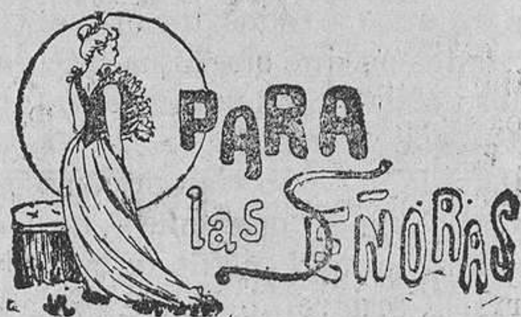
TRAJE DE VISITA

La piel pesa 30 libras. En el pueblo de Pineda se han matado otros varios jabalíes.