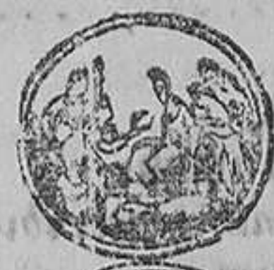
EXPOSICION INTERNACIONAL DE LONDRES.