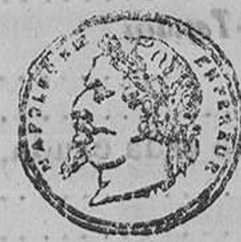
GRAN MEDALLA DE HONOR.

IMPRENTA DE LA ABEJA MONTAÑESA. calle del Muelle, núm. 4.