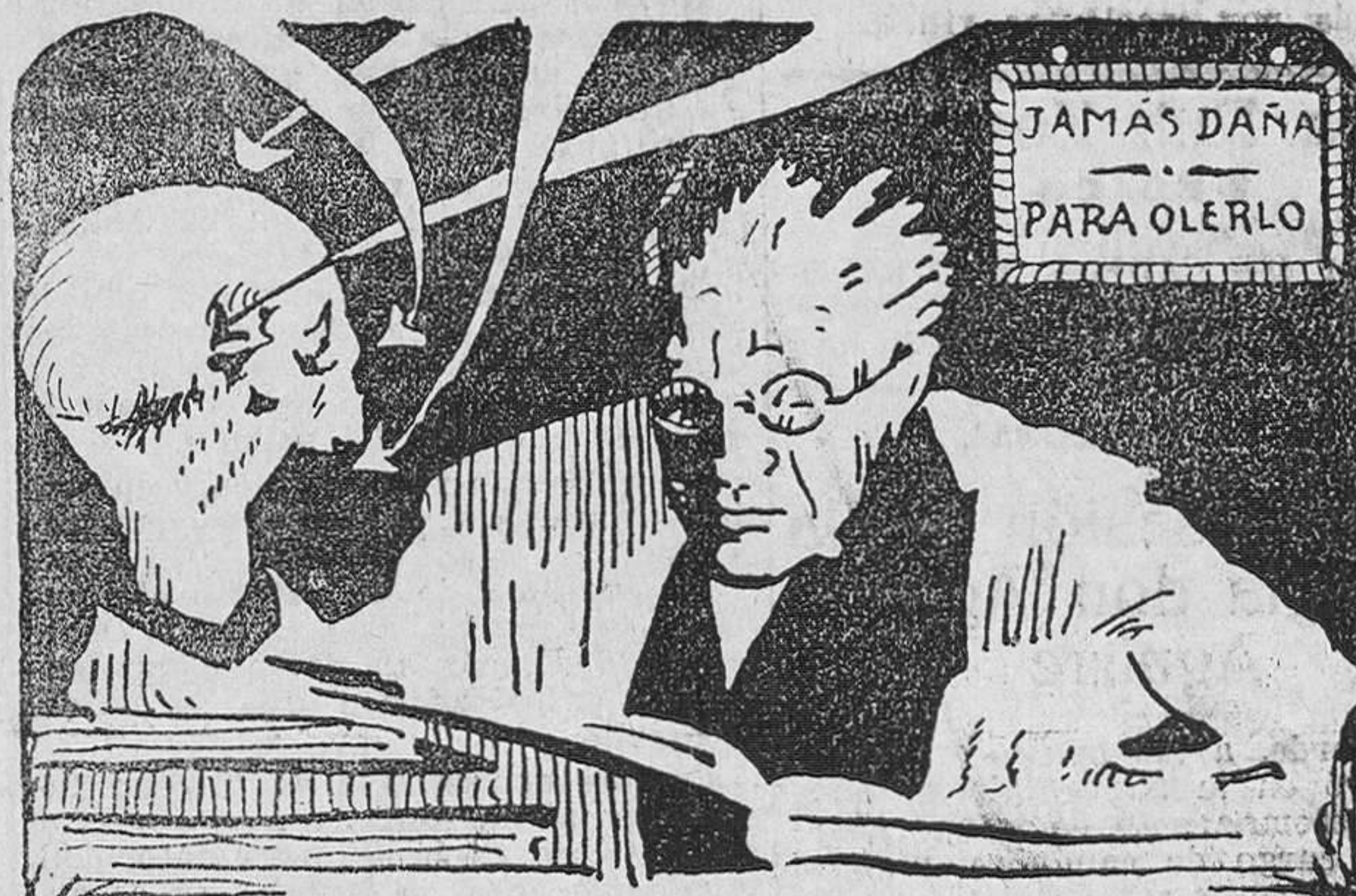
JAMÁS DAÑA PARA OLERLO

CALMA CON OLERLO, CABEZA, MUELAS, OIDOS, etc. NIÑOS, EMBARAZADAS, AMAS, IMPUNEMENTE PUEDEN USAR ASPIROL INOFENSIVO = OLERLO Y CALMAR EN UN SEGUNDO. NI TOMADO HACE EL MENOR DAÑO. 40 CENTIMOS.