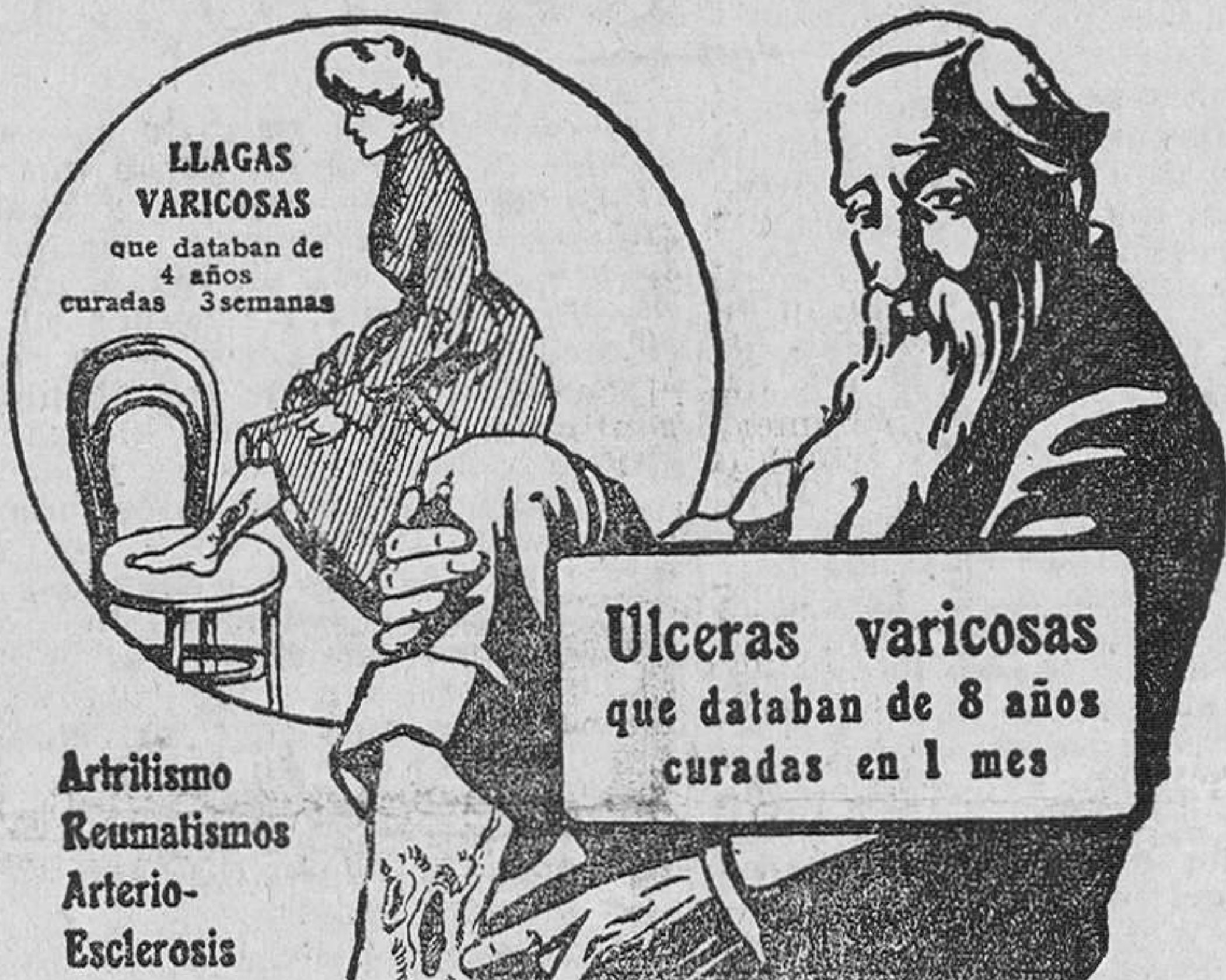
LLAGAS VARICOSAS que databan de 4 años curadas 3 semanas

CALLES DE SAN FRANCISCO, 23 Y PUERTA LA SIERRA, 2