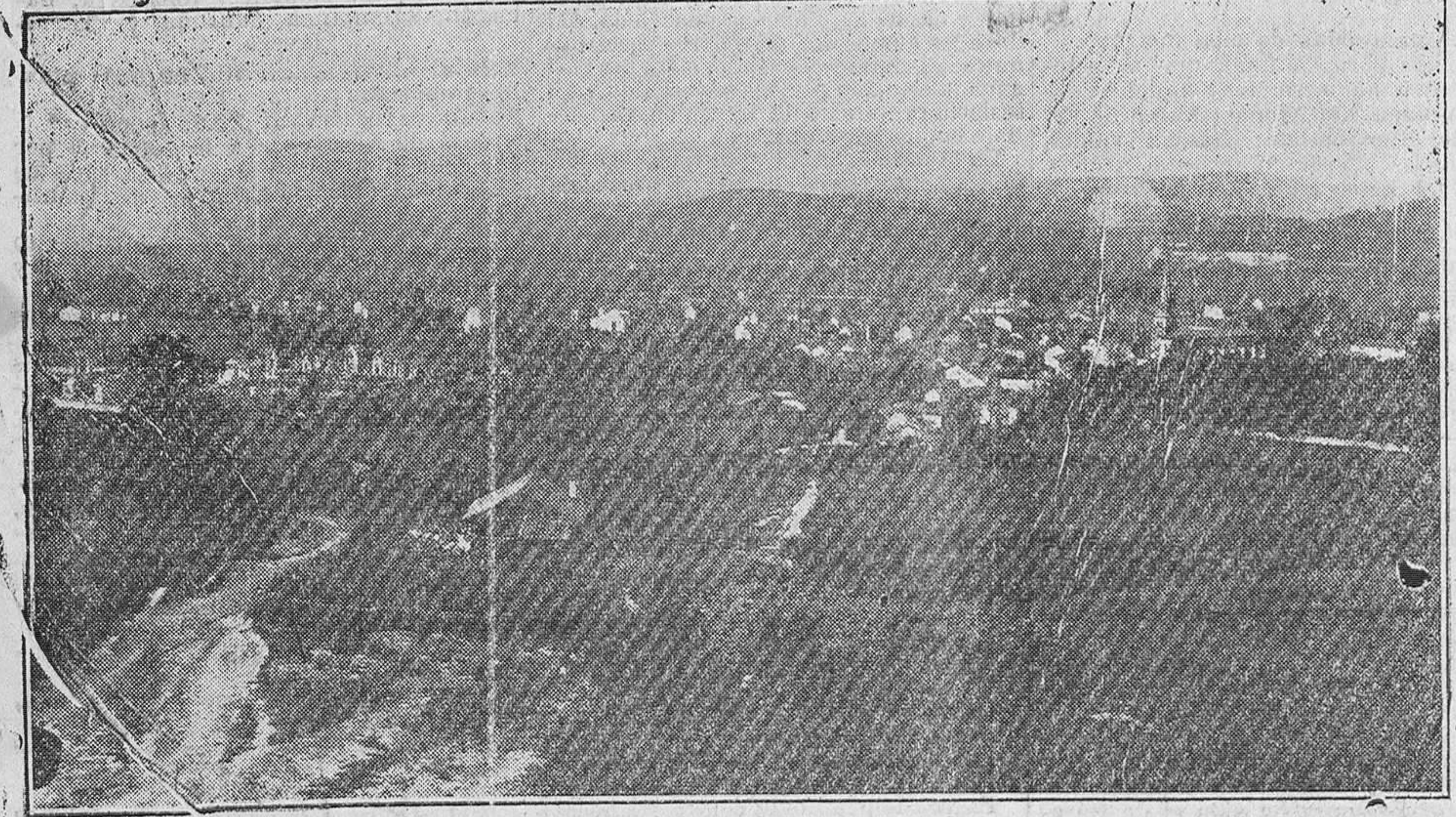
VISTA PANORAMICA DE TORRELAVEGA

La fiesta de gala celebrada anoche en el Real Palacio de la Magdalena resultó brillantísima.