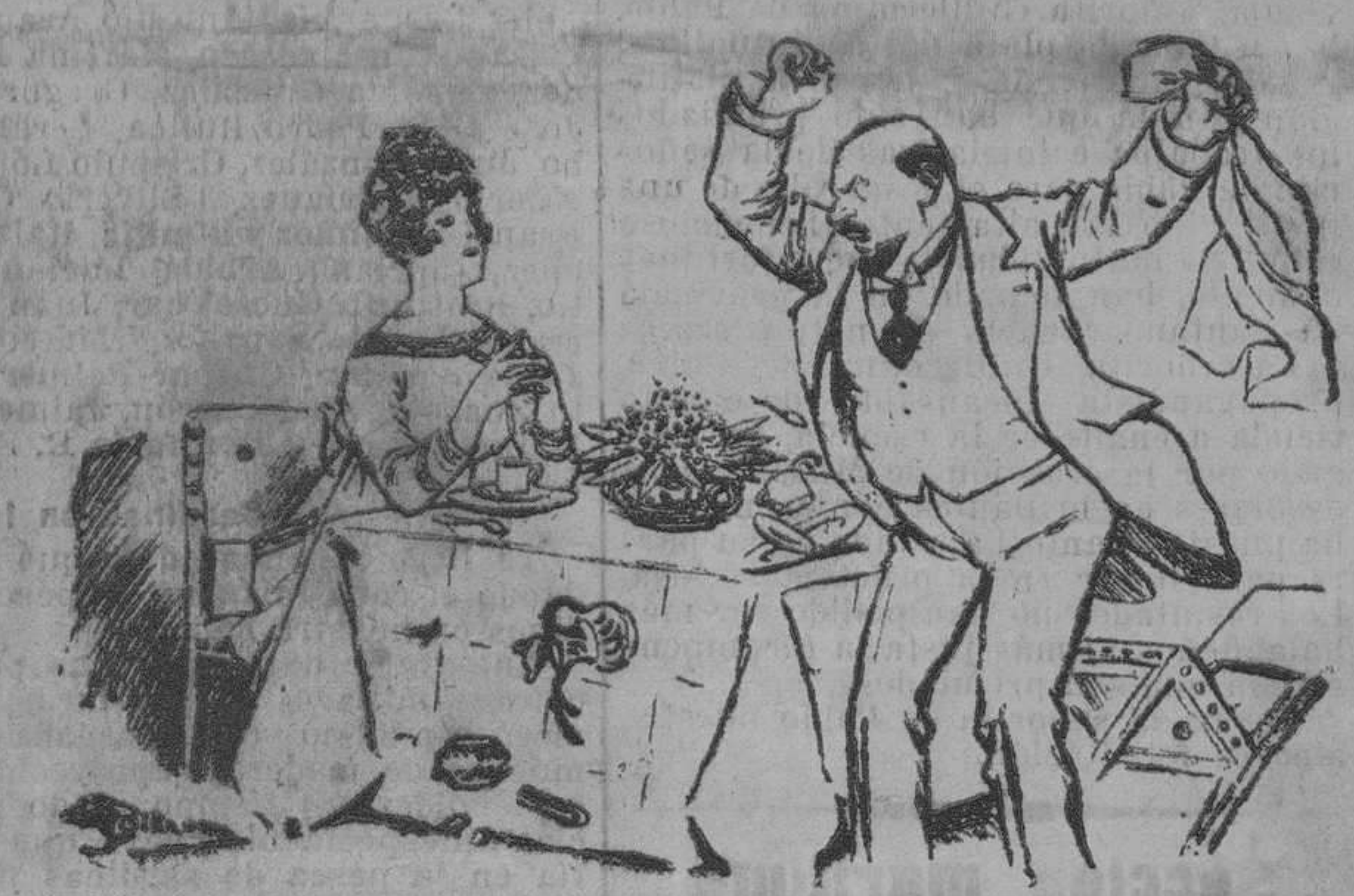
EN EL HOGAR FRANCES —¡Eres inaguantable, y más caprichosa que un decreto sobre la alimentación!... (De "Le Journal")

Con verdadero placer consignamos esta grata noticia, que han de acoger con agrado cuantos se interesan por el movimiento artístico en general y por nuestra región en particular.