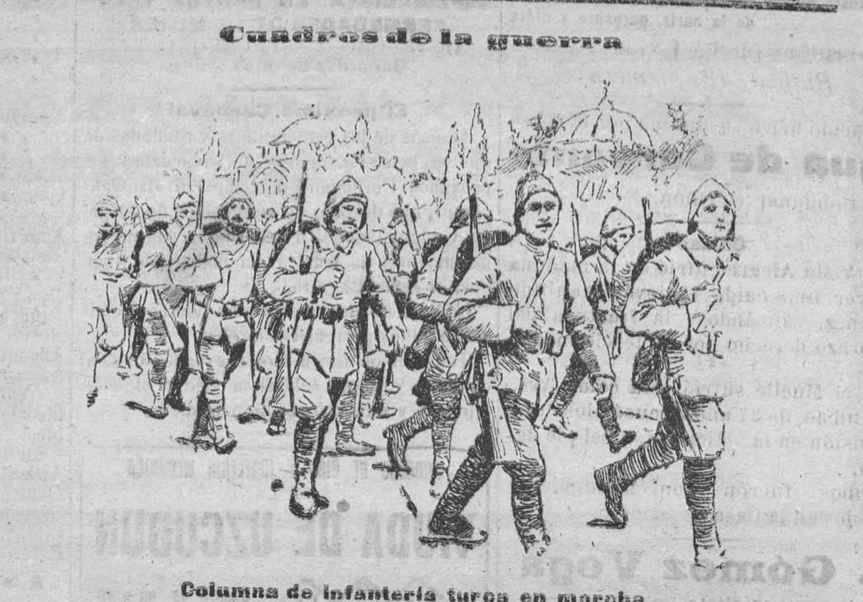
Columna de infantería turca en marcha