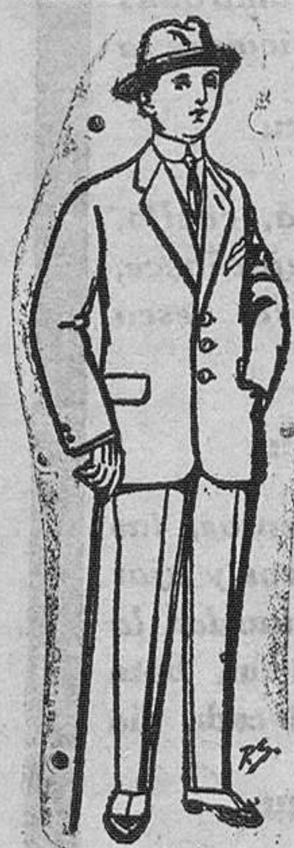
Trajes de paten vicuña ó jerga para niños de 10 a 18 años De Pts. 13 a 48