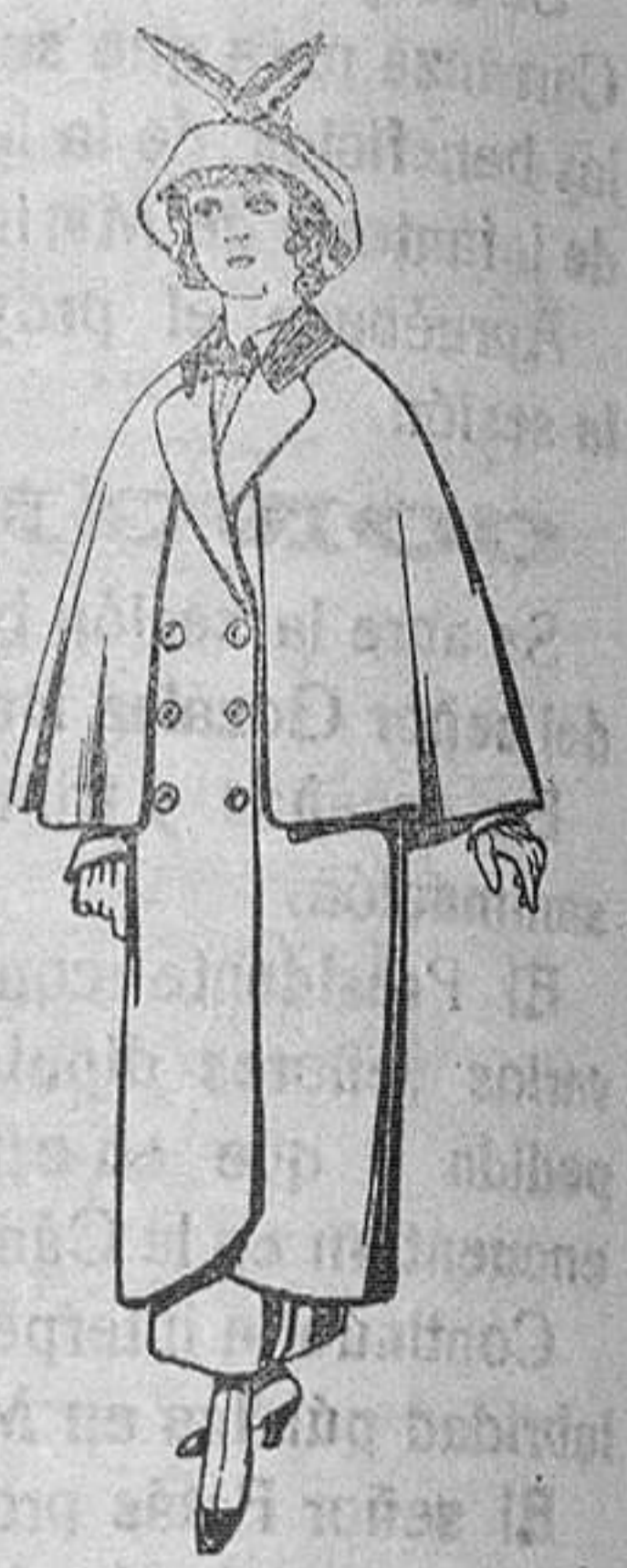
Abrigos de paten coscos novenas para jovencitas de 13 a 16 años De Pts. 35 a 40