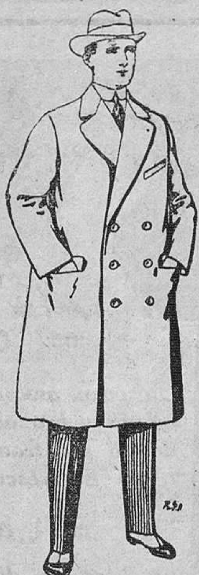
Gabanes de paten y cheviot. De Pts. 55 a 105

SUCURSALES: Madrid, Barcelona, Alicante, Almería, Bilbao, Cádiz, Cartagena, Gijón, Granada, Málaga, Palma de Mallorca, Sevilla, Valencia, Valladolid, Zaragoza