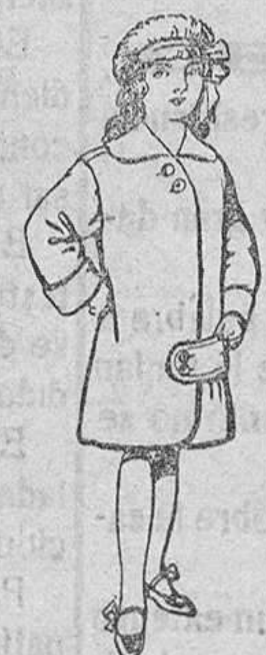
Abrigos de paten para niños de 4 a 9 años De Pts. 20 a 28