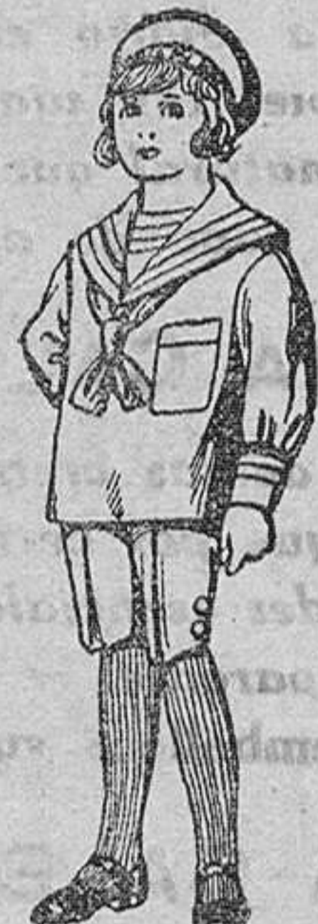
Trajes de jerga azul bordado oro en la manga para niños de 4 a 9 años De Pts. 20 a 22

SECCIONES: Peletería, Camisería, Géneros de Punto, Corbatería, Guantería, Sombrerería, Zapatería, Paraguas, Bastones y Artículos de Viaje.