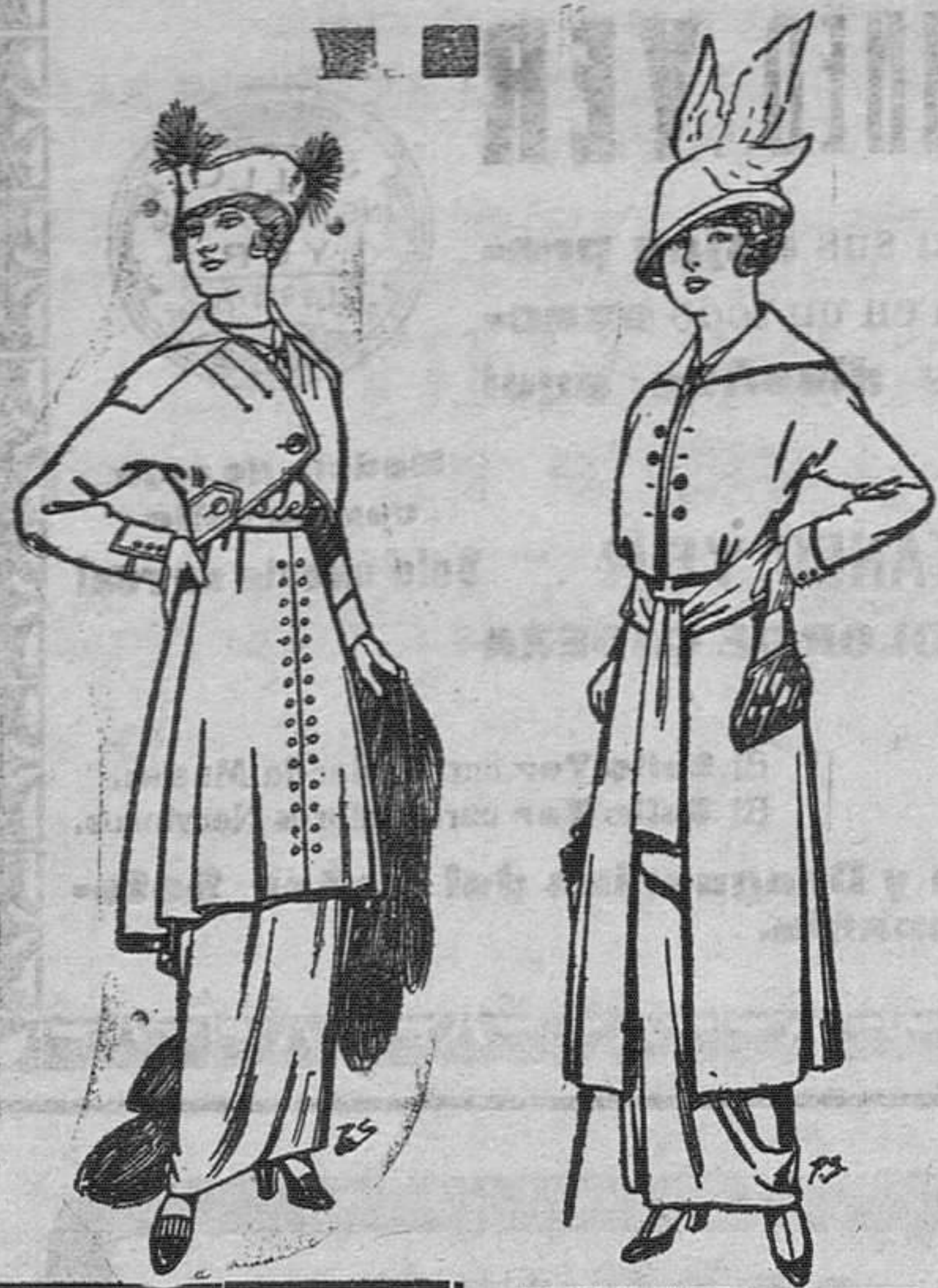
Trajes de jerga negra y azul Pts. . . 55