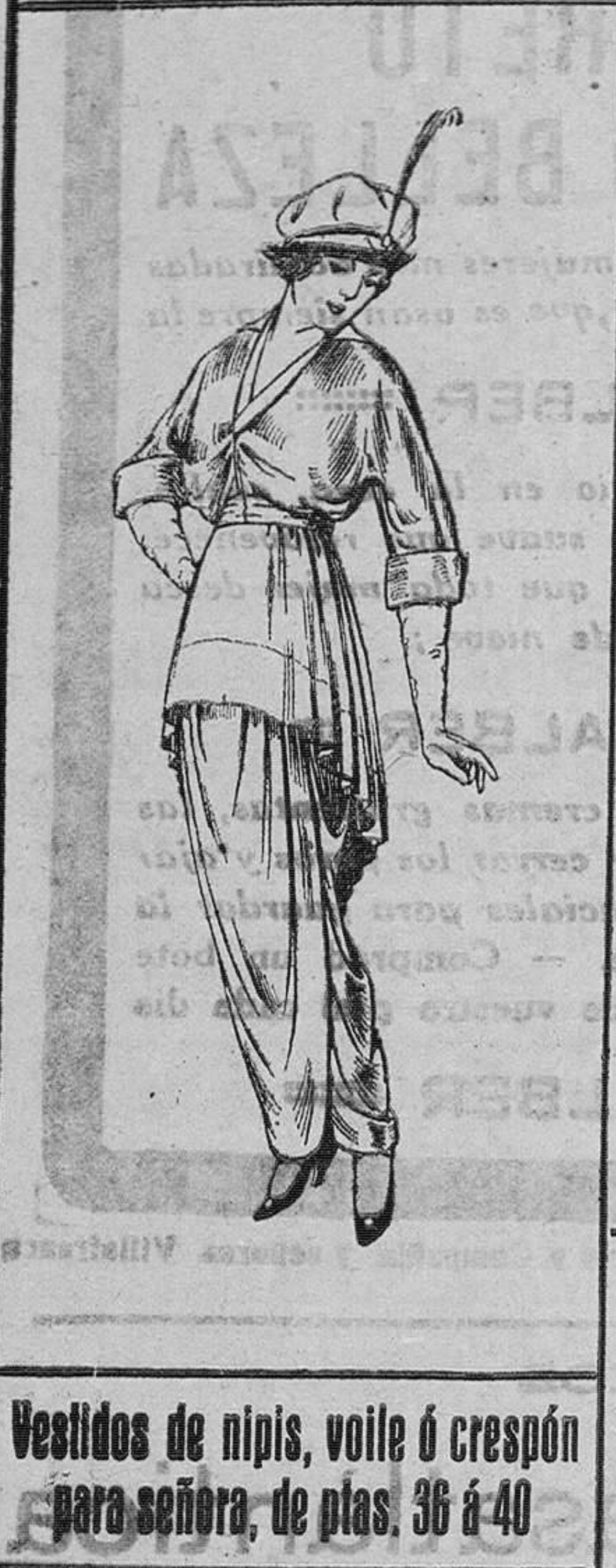
Vestidos de nipsis, voile ó crespón para señora, de ptas. 36 á 40

Ropas confeccionadas para caballero y niño y artículos de la temporada