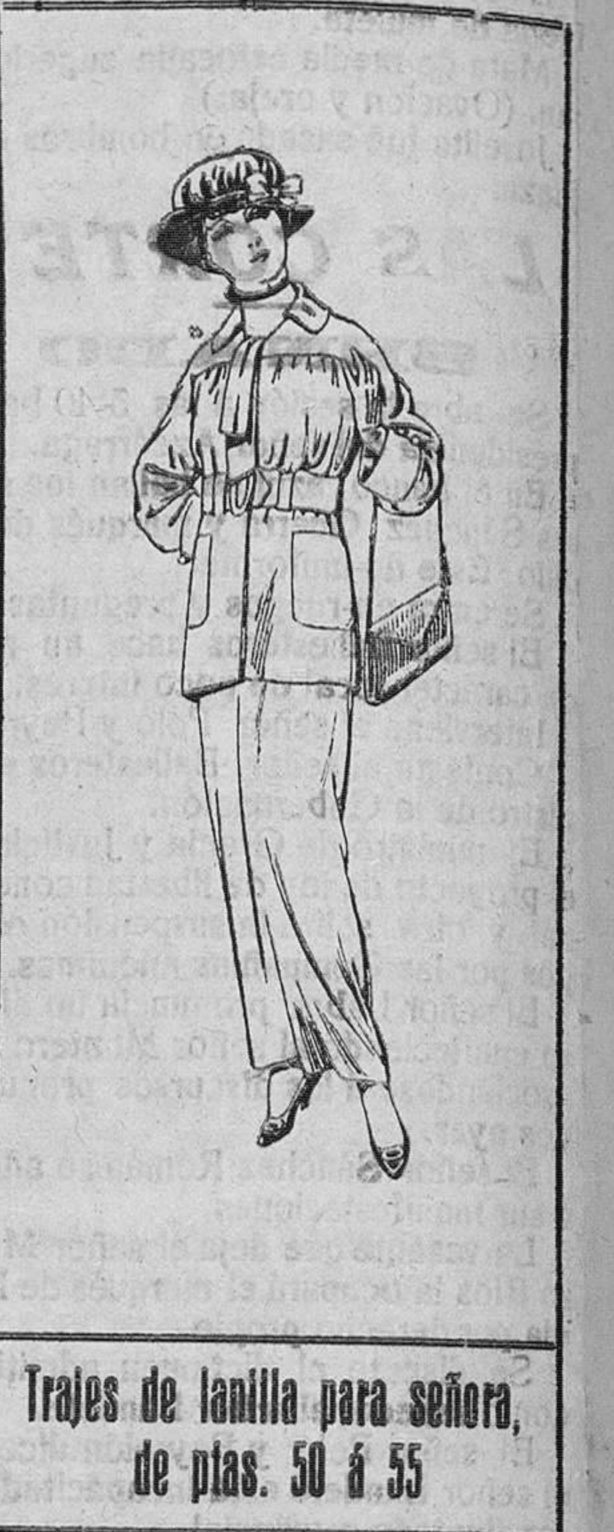
Trajes de lanilla para señora, de ptas. 50 á 55

Faldas, blusas, guardapolvos, cuellos y otros artículos