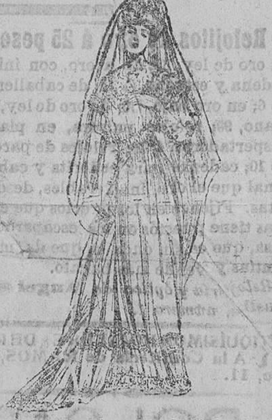
Era uno de ellos de satén flexible, finísimo, pero lo bastante fuerte para emplearse solo, y la falda estaba cortada con una tabla formando un pliegue plano por delante y que descendía por la falda hacia arriba...

Una partida de revolucionarios de Varsoya ha asaltado las oficinas de Correos.