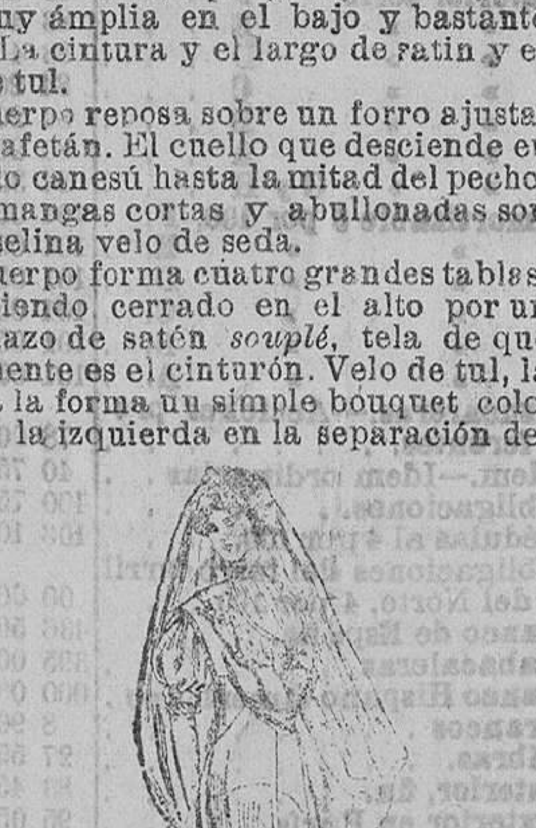
El cuerpo está hecho á pliegues, bordado en la cintura y en el alto por pliegues y frunces de muselina, formando ondas. Cuello y canesú redondo de bordado, mangas de globo y cortas, con los mismos adornos que el cuerpo. Velo de tul, cogido en el alto de la cabeza por un bouquet.