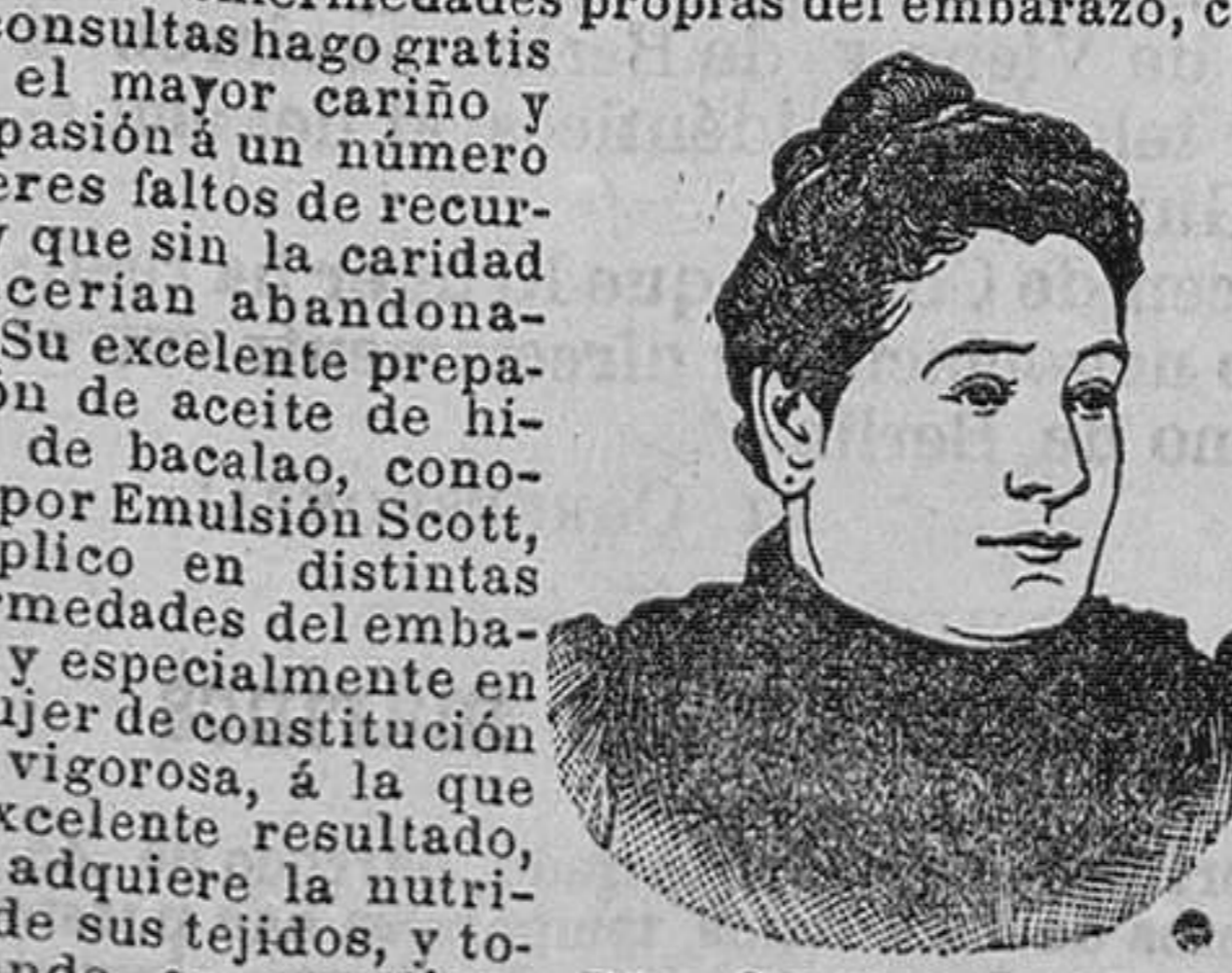
Entre las personas que recomiendan la Emulsión Scott, hemos de distinguir á la autora de la siguiente carta, por ser una de las más ilustradas comadronas de Madrid y porque tiene una significación muy importante, por referirse especialmente al nacimiento de los niños. Tan valioso certificado merece especial atención.

En el trabajo leído se advierten algunos toques catalanistas; pero el autor no se atrevió á entrar en el fondo de la cuestión, tratándola muy de soslayo.