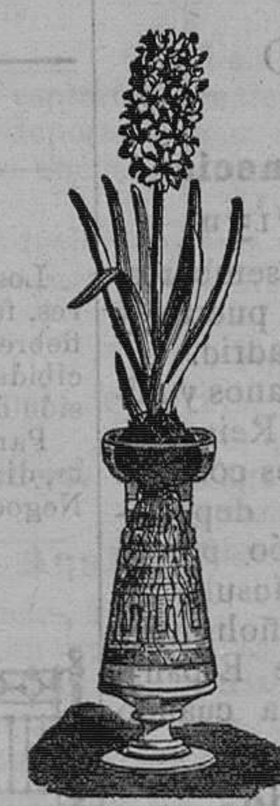
Jacintos variados dobles para agua. Pieza, 1 peseta. Id. con botella, bonito modelo, 4 pesetas pieza.