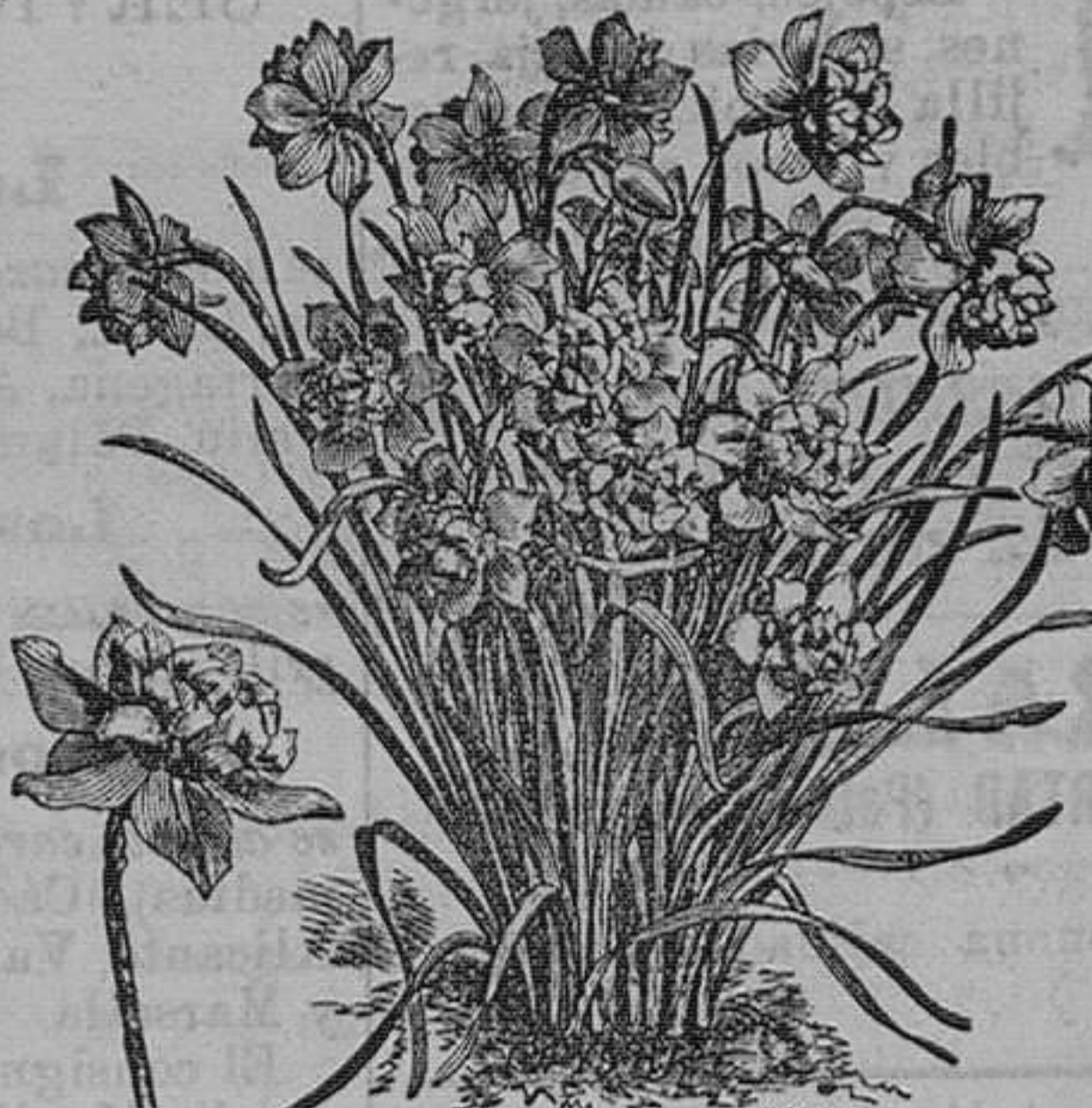
Narcisos dobles de Constantinopla, 20 variedades.—Pieza, 50 céntimos; docena, 4,50; el ciento, 26 pesetas.