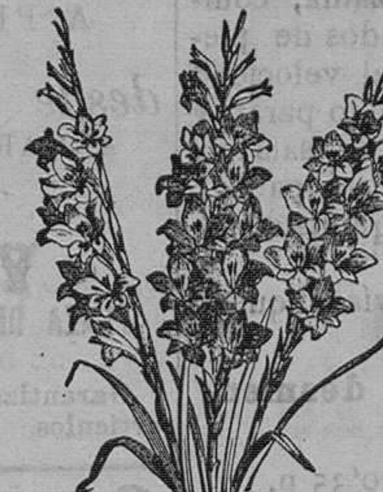
Gladiolos híbridos en 50 variedades, de los floristas. Pieza, 50 cénts.; docena, 4 ptas.; el 100, 15.