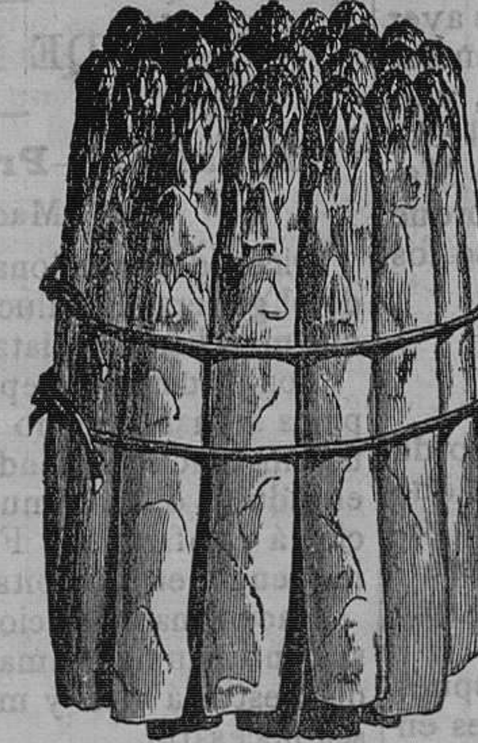
Espárragos: muy precoz de Argentineuil grueso, el ciento, 16 pesetas.—Idem de Holanda, blanca, el ciento, 10 pesetas.