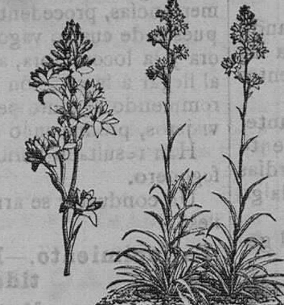
Nardos de Sevilla y Tuberosa doble, muy oloroso.—Pieza, 75 céntimos; docena, 6; el 100, 25 pesetas.