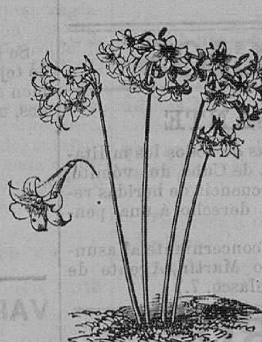
Amarilis velladona, rosa pura para hacer pomada para el pelo. Seis variedades.—Pieza, 1,25 pesetas; docena, 9 pesetas.

Jardinero del Instituto de esta capital, calle deMagallanes, número 36, Santander. Catálogo de cebollas y tubérculos de flores, gratis á quien los pida.