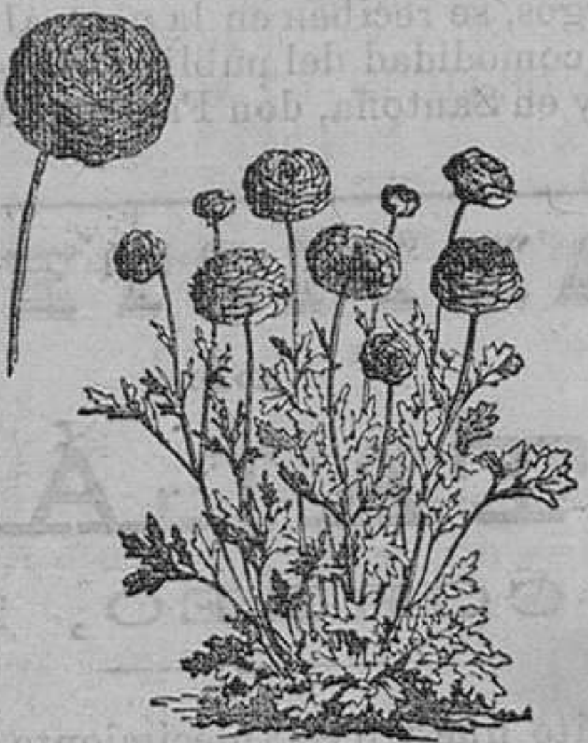
Ranunculus dobles.—Pieza, 40 cts.; docena, 350 ptas.—En 50 variedades, 20 pesetas 100.