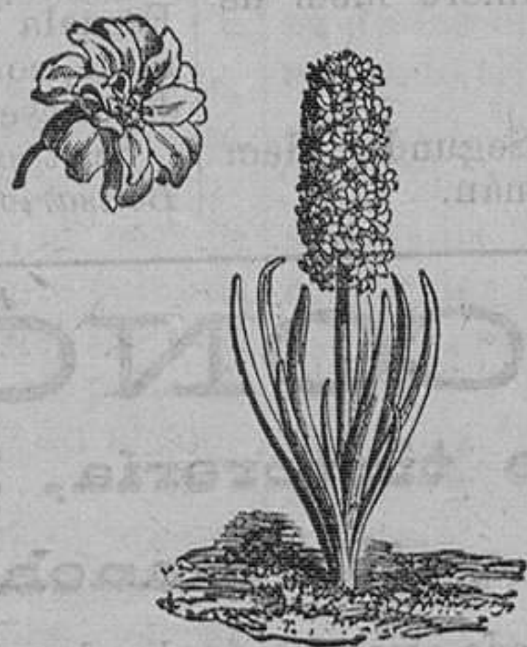
Jacintos dobles variados. Pieza, 50 céntimos; docena, 450 pesetas. El 100 en 24 variedades, 26 pesetas.

SUCURSAL PLAZA DE LOS MERCADOS Nave central, n.º 17