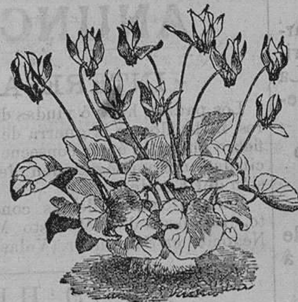
Ciclamen de Persia, Europa y Nápoles, 4 variedades.—Pieza, 75 cts.; docena, 6 pesetas.