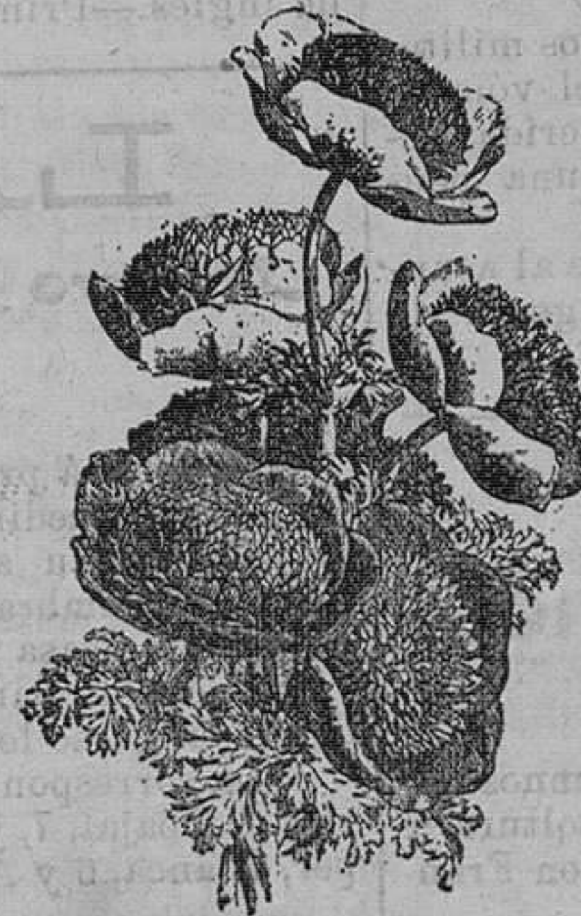
Anémoma doble de los floristas. Pieza, 50 céntimos; docena, 450 pesetas; 25 variedades, 25 pesetas 100.