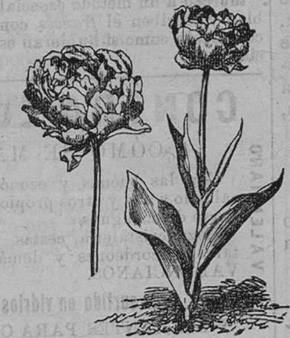
Tulipán doble. Pieza, 50 céntimos; docena, 450 pesetas; 100 en 24 variedades, 26 ptas.

Se hacen toda clase de ramos y coronas fúnebres, a precios arreglados.