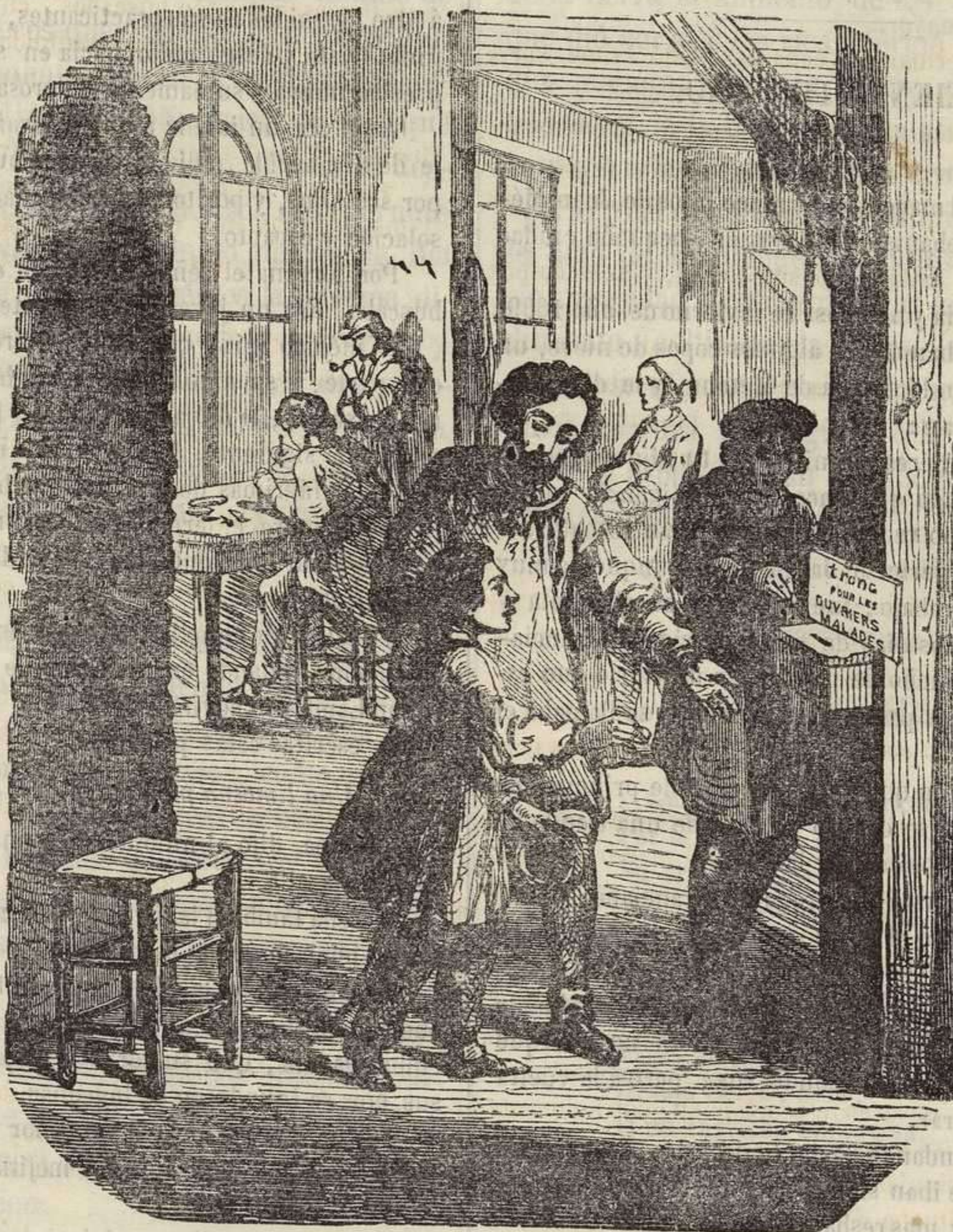
El cepillo de los pobres.

—Pienso en los pobrecitos enfermos del hospital, dijo Jaime poniéndose encendido, ¿qué sería de ellos si la caridad pública no los socorriese?