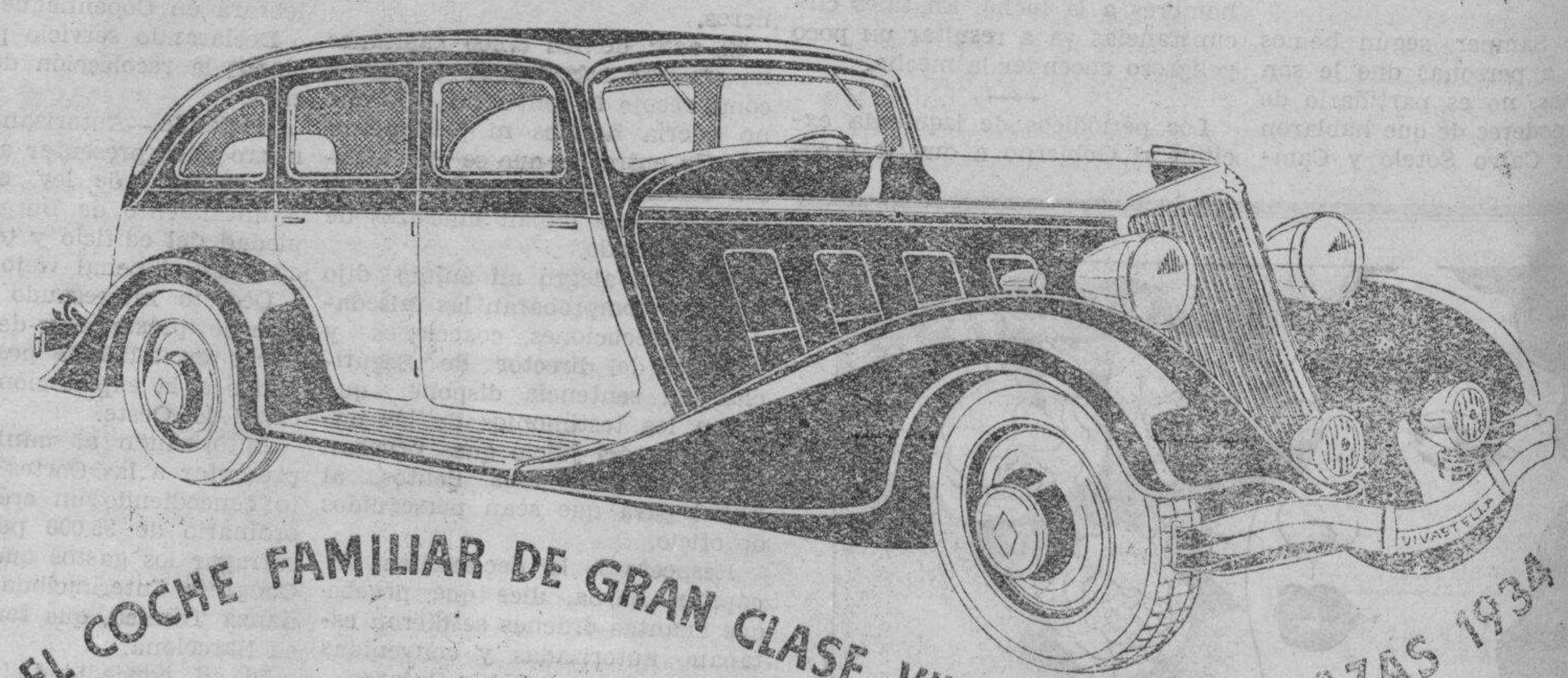
EL COCHE FAMILIAR DE GRAN CLASE VIVASTELLA 7 PLAZAS 1934

Dotado de un motor 6 cilindros de 3 litros, de alto rendimiento, le permite alcanzar y sostener velocidades muy elevadas. Cajas "Stella" estudiadas expresamente para transportar siete personas con la mayor comodidad, pudiendo efectuar largos recorridos sin la menor fatiga. Malfines puestos interiormente detrás del respaldo del asiento posterior y a cubierto del polvo y de la lluvia. Chassis trapezoidal de travesaños tubulares que le proporciona una absoluta adherencia a la carretera, permitiendo tomar las curvas a gran velocidad. Con una dirección irreversible, precisa y suave. Servo-freno progresivo y seguro. Caja de velocidades suspendida. Motor sobre cojinetes de caucho sin vibraciones y de gran potencia.