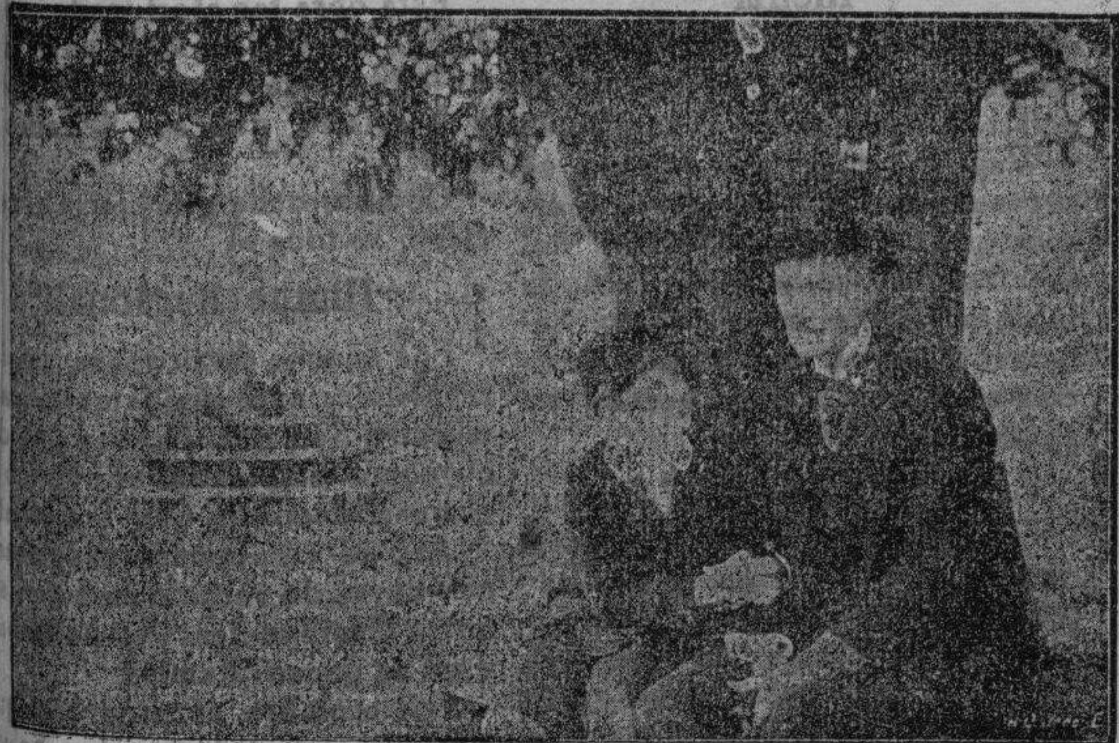
Una escena del Capitán Sorrell que presentarán próximamente «Artistas Asociados»