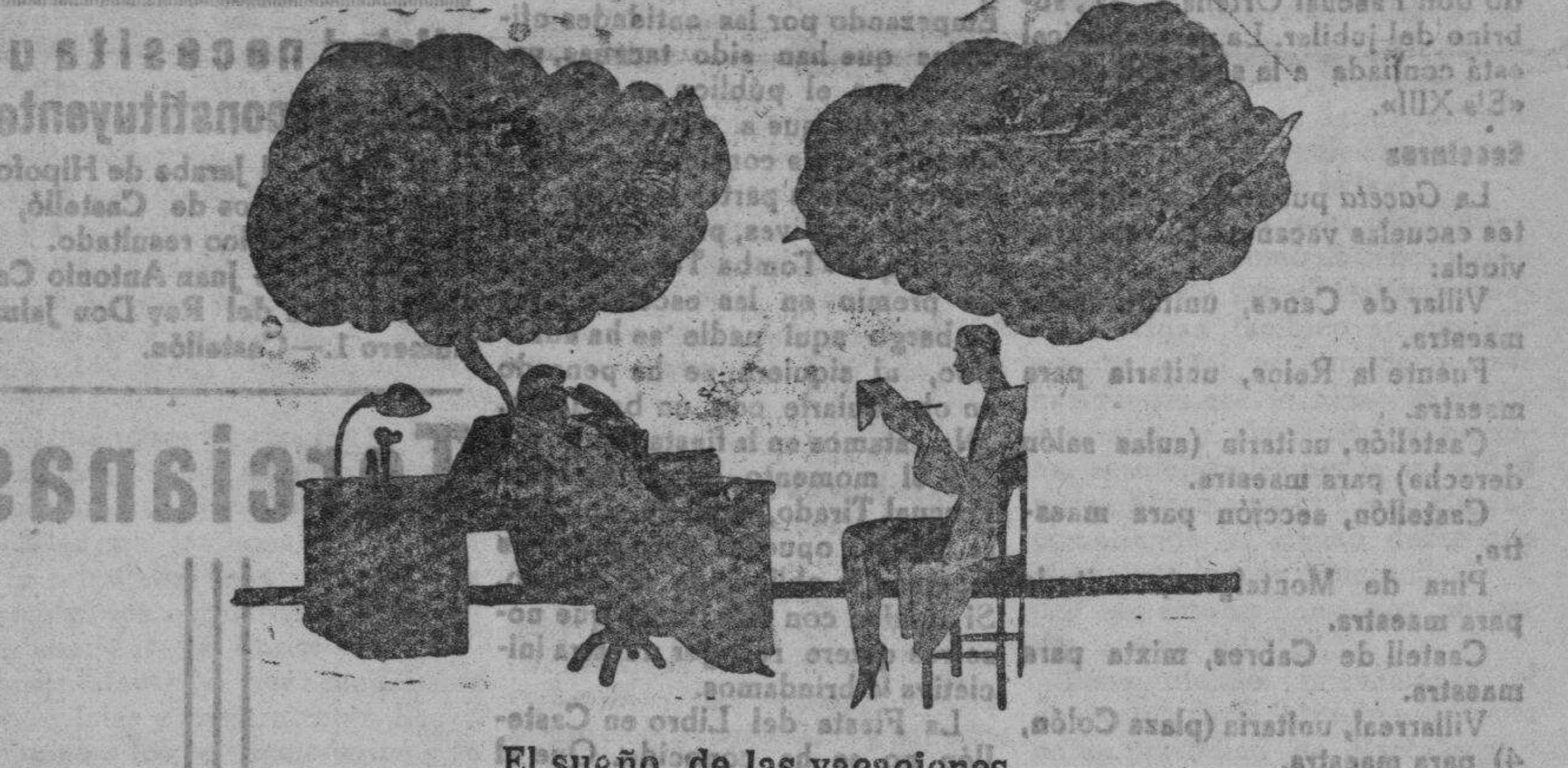
—Señorita. Belén. Haga el favor de no pensar más en el mar y en la pesca y pesque, al oído lo que la dicta.