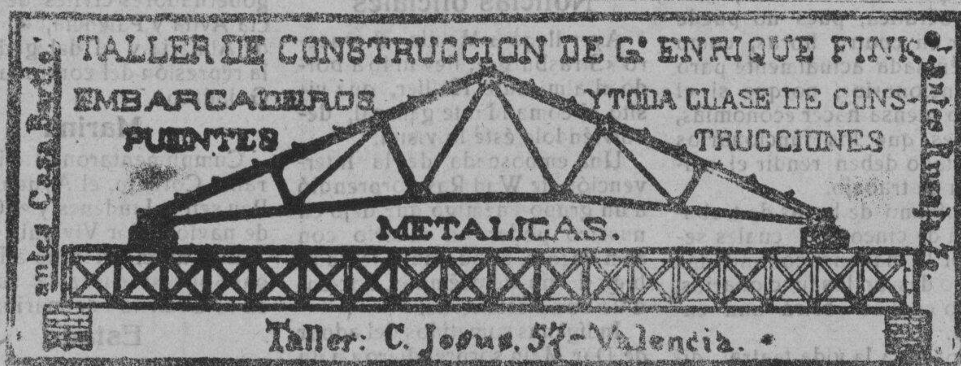
Taller: C. Jesus, 57 - Valencia.

Las ofertas, con detalles, deben ser dirigidas a la Casa Central.