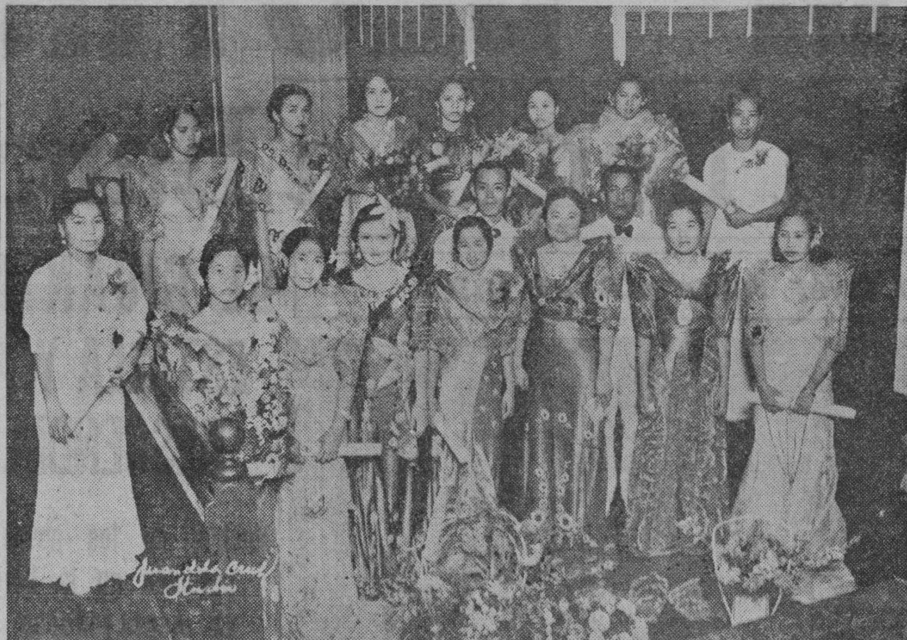
Grupo de jóvenes caviteñas que se graduaron recientemente de una escuela de modas de Cavite, fotografiadas después de su graduación. Inmediatamente después de la entrega de diplomas las graduadas ofrecieron un animado baile en el "Dreamland Auditorium de Cavite, que duro hasta primeras horas de la madrugada del día siguiente.—Trinidad.