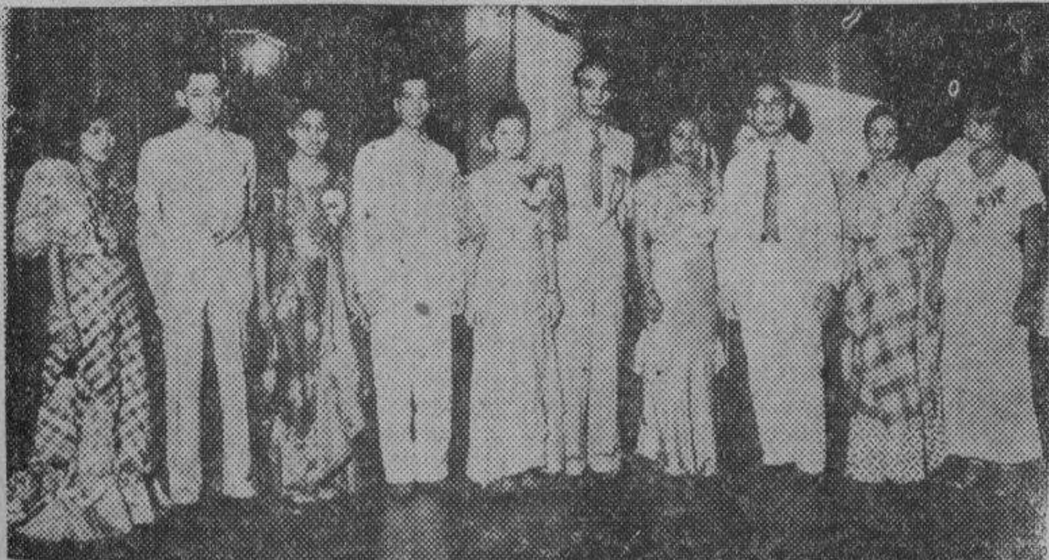
El sábado pasado tuvo lugar en el Club Filipino la fiesta inaugural de la Paterno Institute Scientific Society...