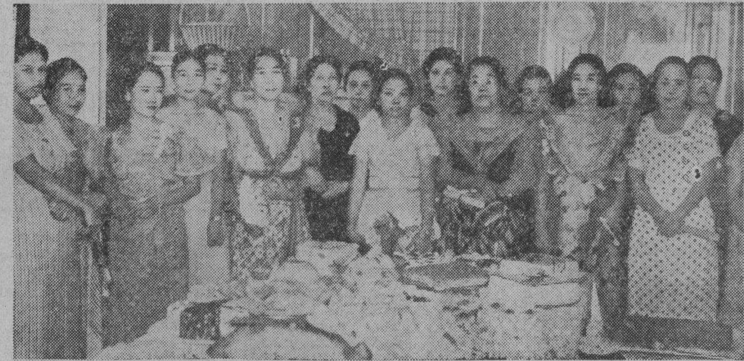
Haciendo una demostración de su habilidad en el arte culinario, las señoras y señoritas que estudian la cocina moderna...