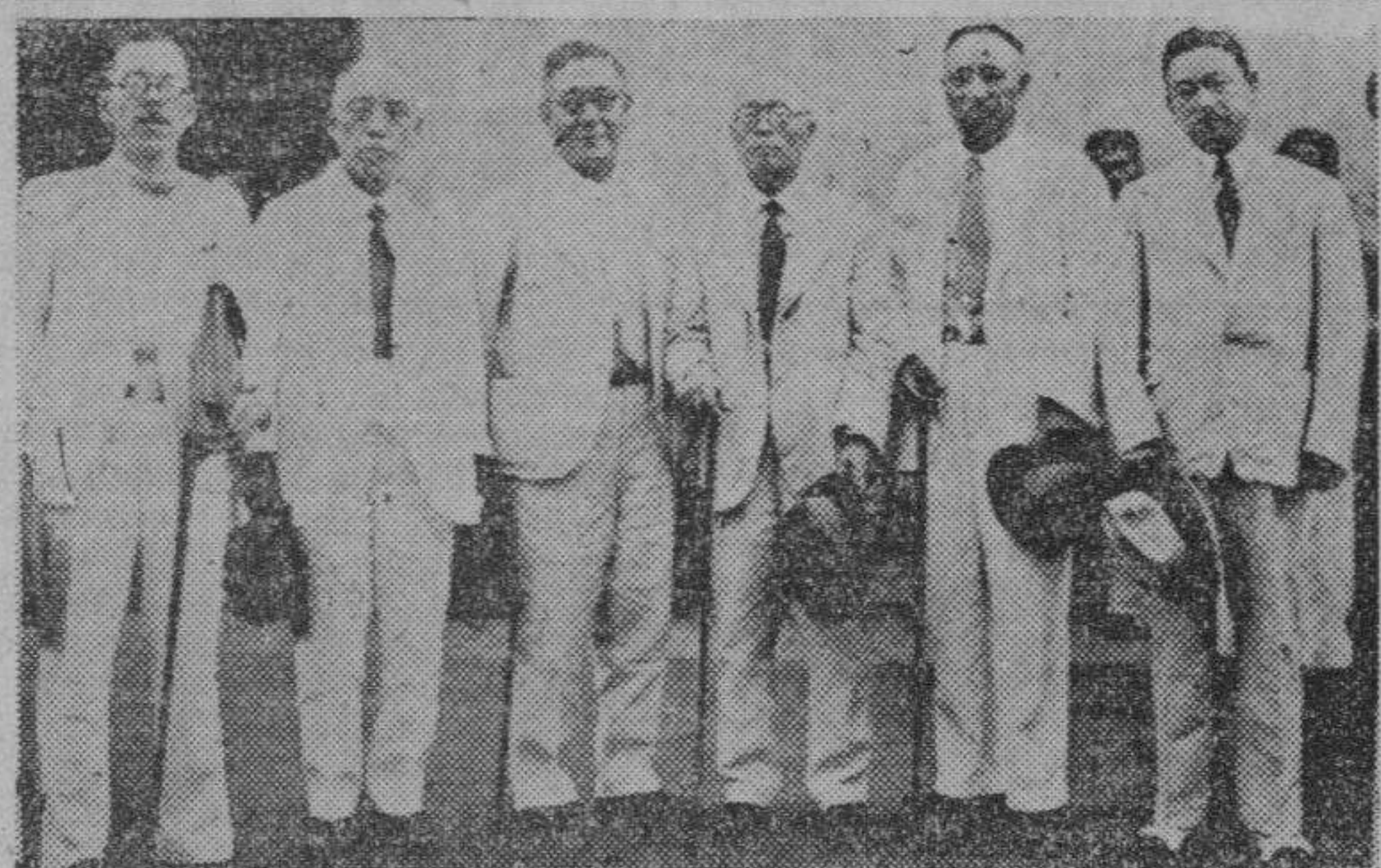
Una comitiva de comerciantes e industriales de Osaka que ayer tarde llego a Manila.