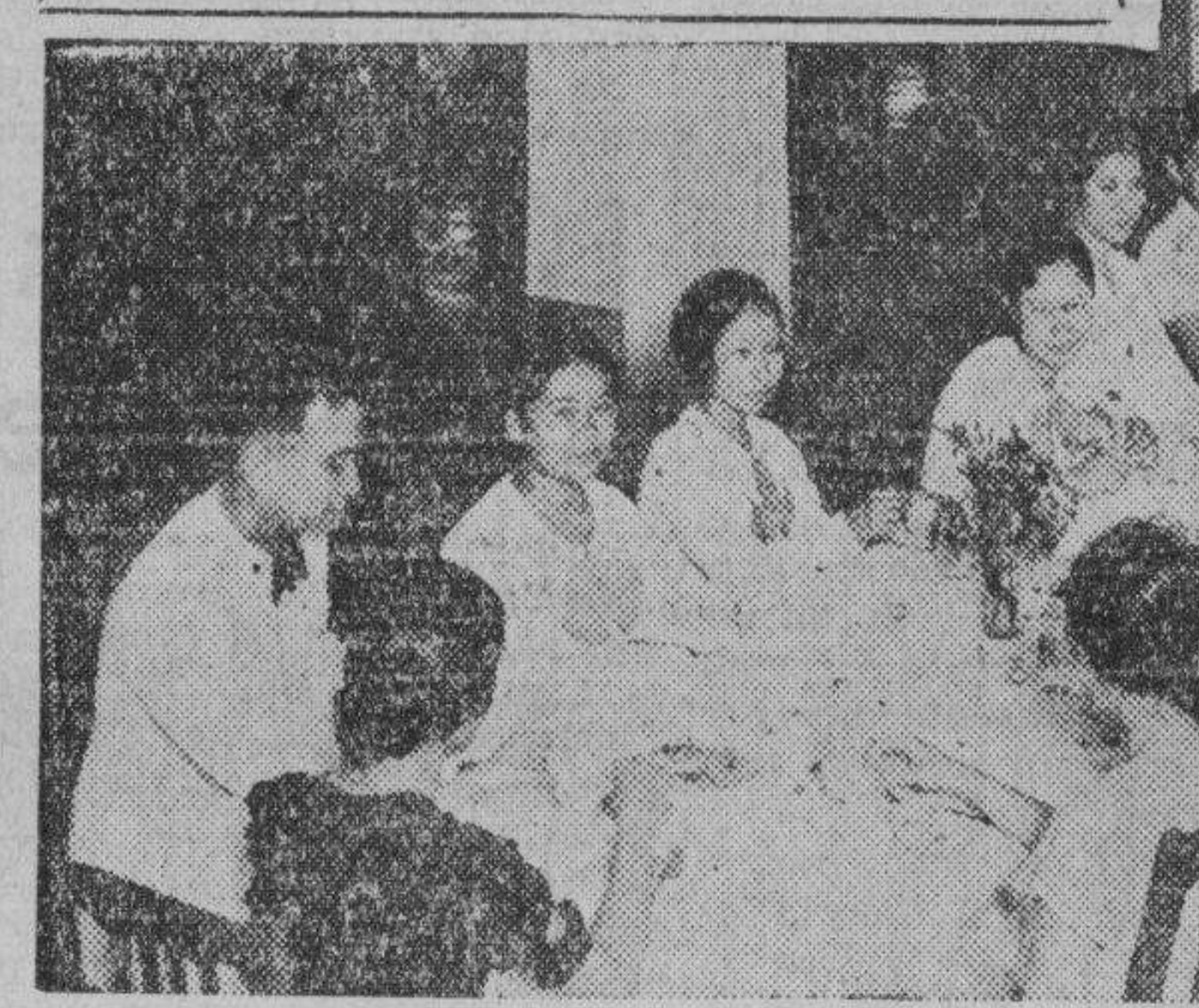
Bajo los auspicios de la junta directiva, un rumboso agape entre miembros de la clase de Farmacia ('Sophomore') de la Centro Escolar University tuvo lugar el día 12 del actual, en el edificio del Centro Escolar.