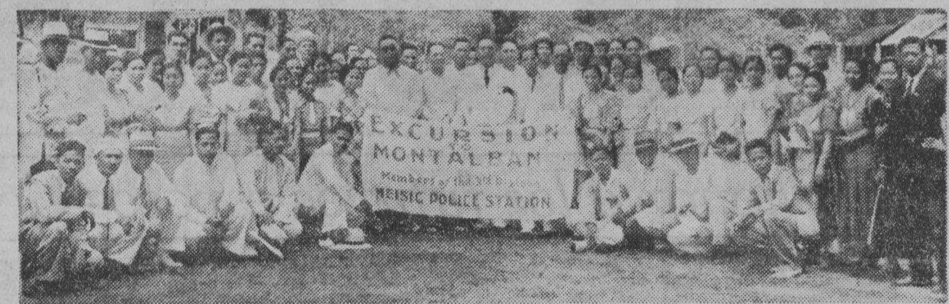
Los miembros de la tercera compañía de policías pertenecientes a la estación de Meisic, tuvieron una jira en Montalban el domingo pasado donde pasaron un día de expansion y de alegría. La fotografía fue tomada en Montalban durante el periodo mas algiado de la fiesta campesite y en ella aparecen los policías con sus invitados.