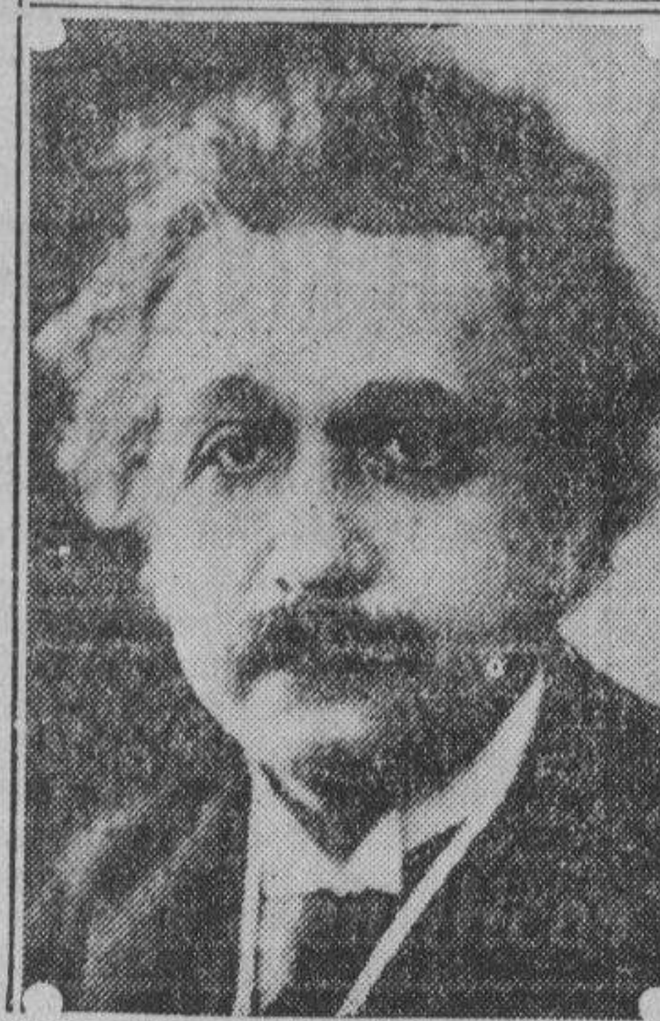
Profesor ALBERT EINSTEIN

Fleming no es menos famoso que Einstein: con su invención de la válvula termónica, la telefonía inalambrica fué una realidad. Es autor de muchos libros sobre telegrafía radiográfica y también ha sido objeto de muchas distinciones. La Medalla Franklin se otorga todos los años a las mayores celebridades en la ciencia física. Es el galardón más alto del Franklin Institute del estado de Pennsylvania, que fué fundada en 1824 para el fomento de las artes mecánicas.