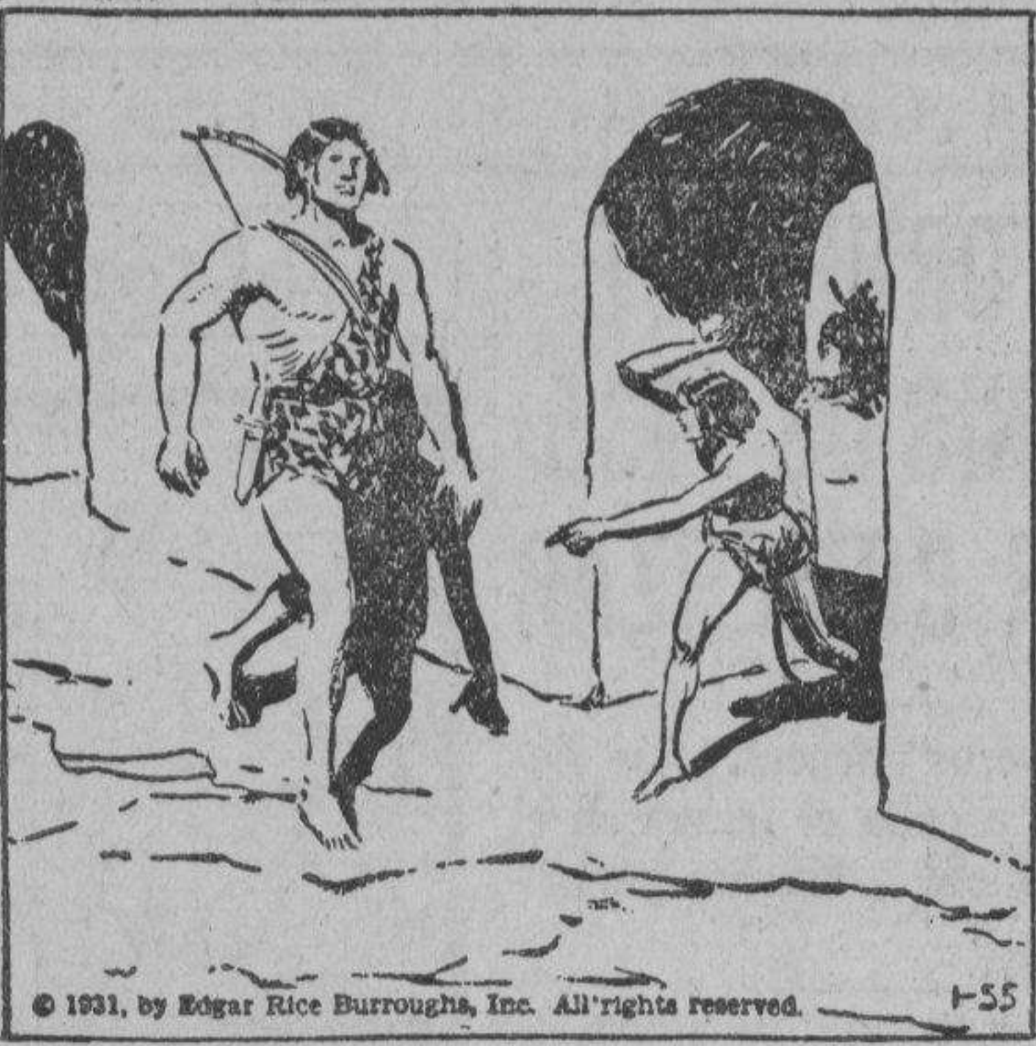
© 1931, by Edgar Rice Burroughs, Inc. All rights reserved.