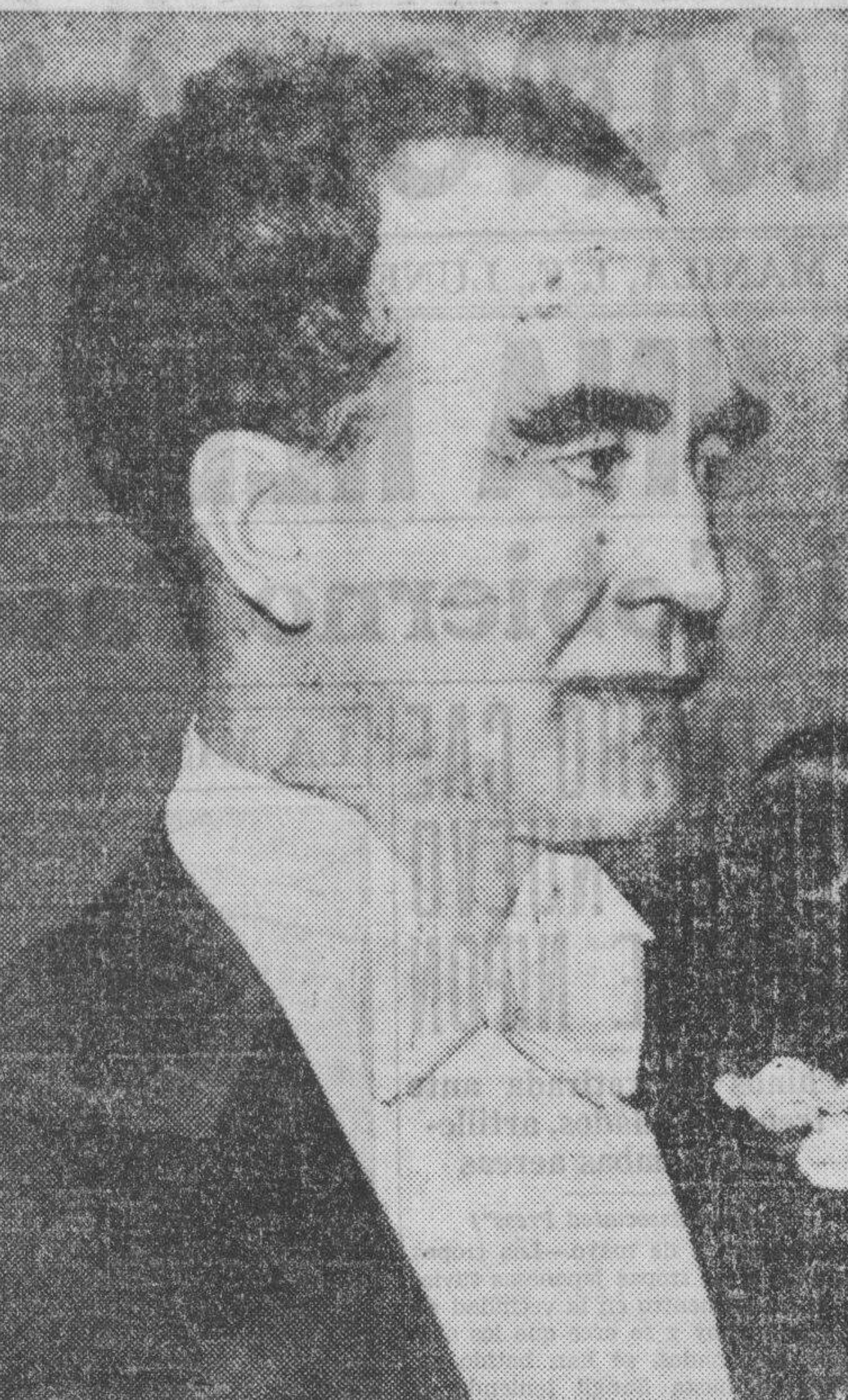
La fotografía más reciente tomada del nuevo gobernador general de Filipinas, Frank Murphy.