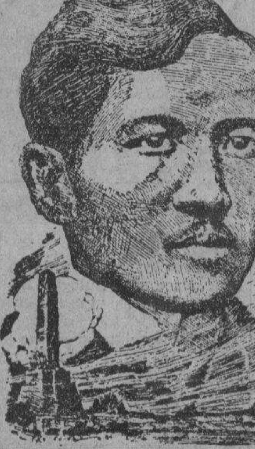
Dr. JOSE RIZAL y MERCADO