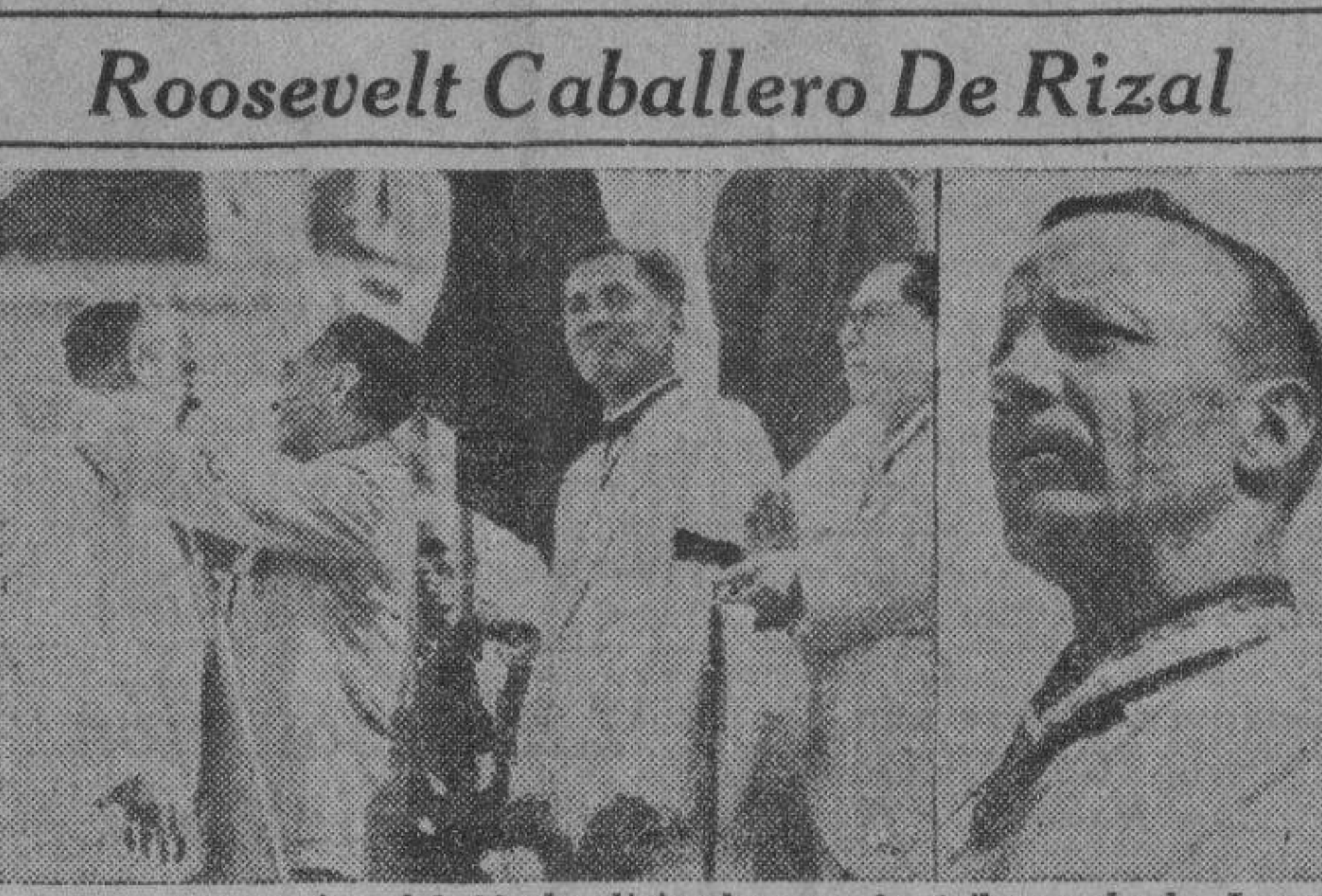
Las ceremonias del 30 de diciembre en la tribuna de la Luneta esta mañana. En el cuadro de la izquierda se ve al gobernador Roosevelt en el momento en que el presidente Quezon le imponía la medalla de Caballero de Rizal.