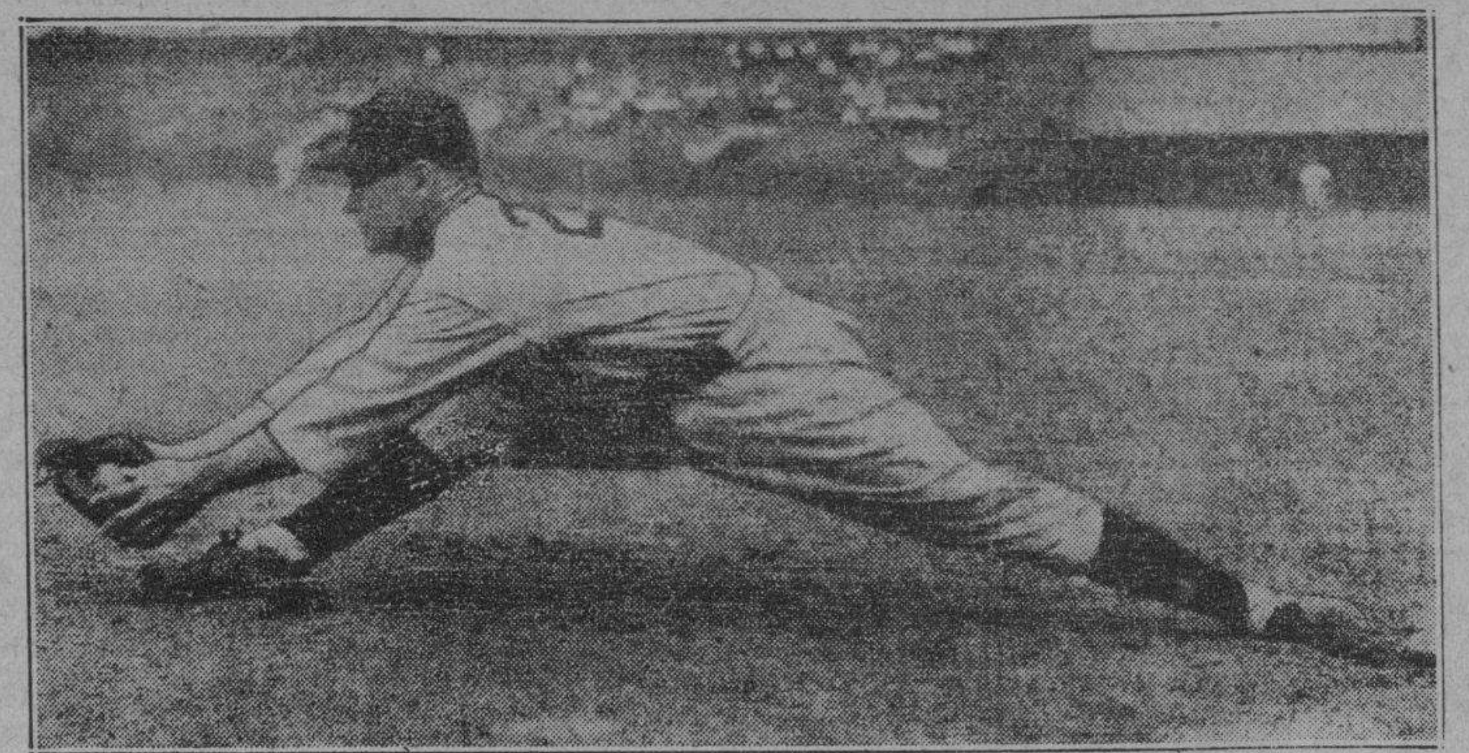
Duffy Davis, sensacional joven reclusa de los Tigres de Detroit es considerado por muchos como el mejor primera base de estos últimos diez años.