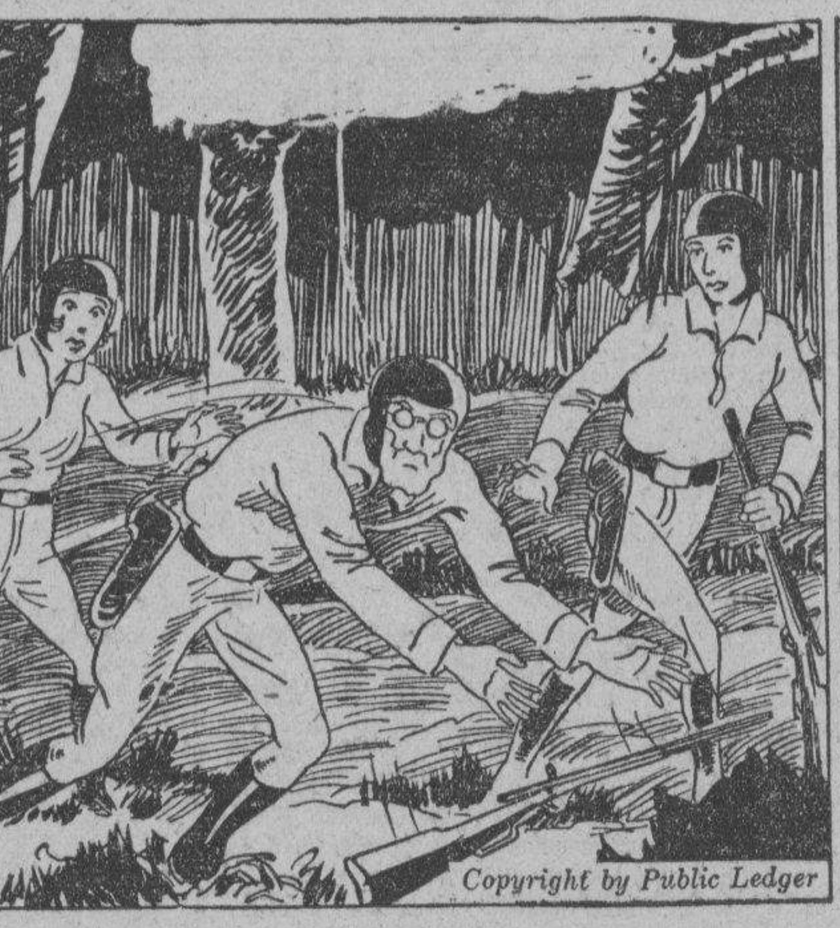
PROFESOR: Oh, Dios mio! Mi tobillo! Se ha dislocado.