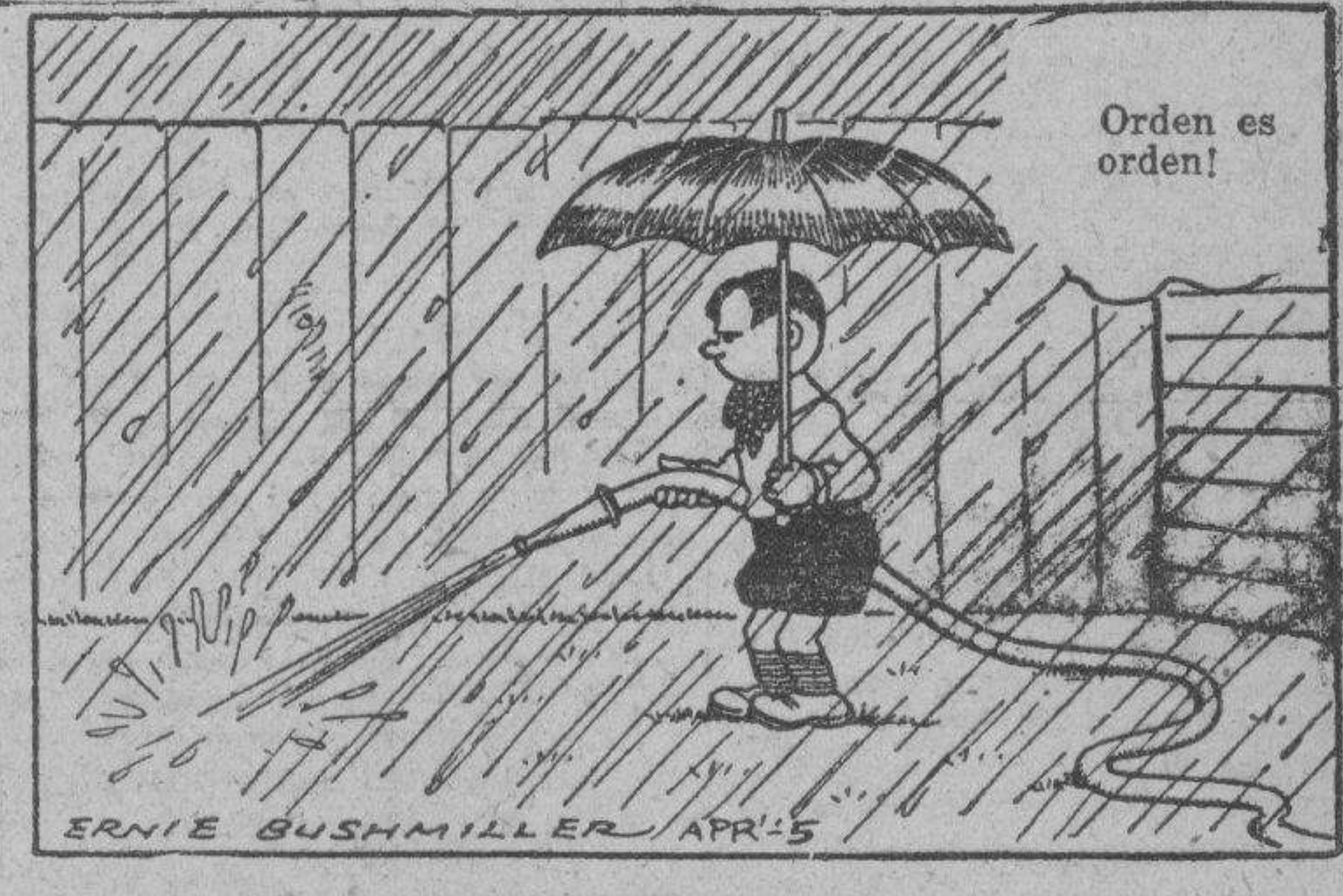
Orden es orden!