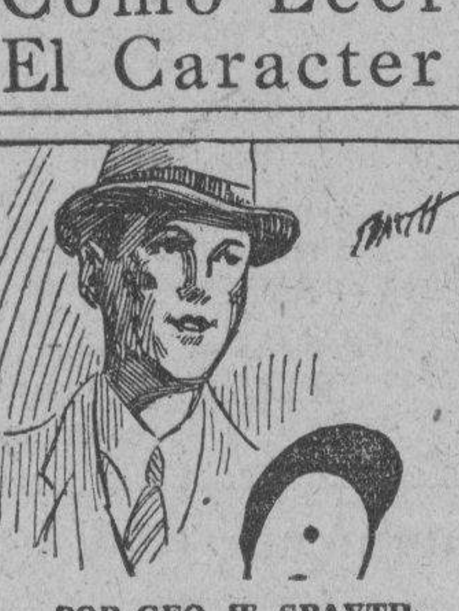
POR GEO. W. SPAYTH El hombre de cara flaca toma las cosas seriamente.