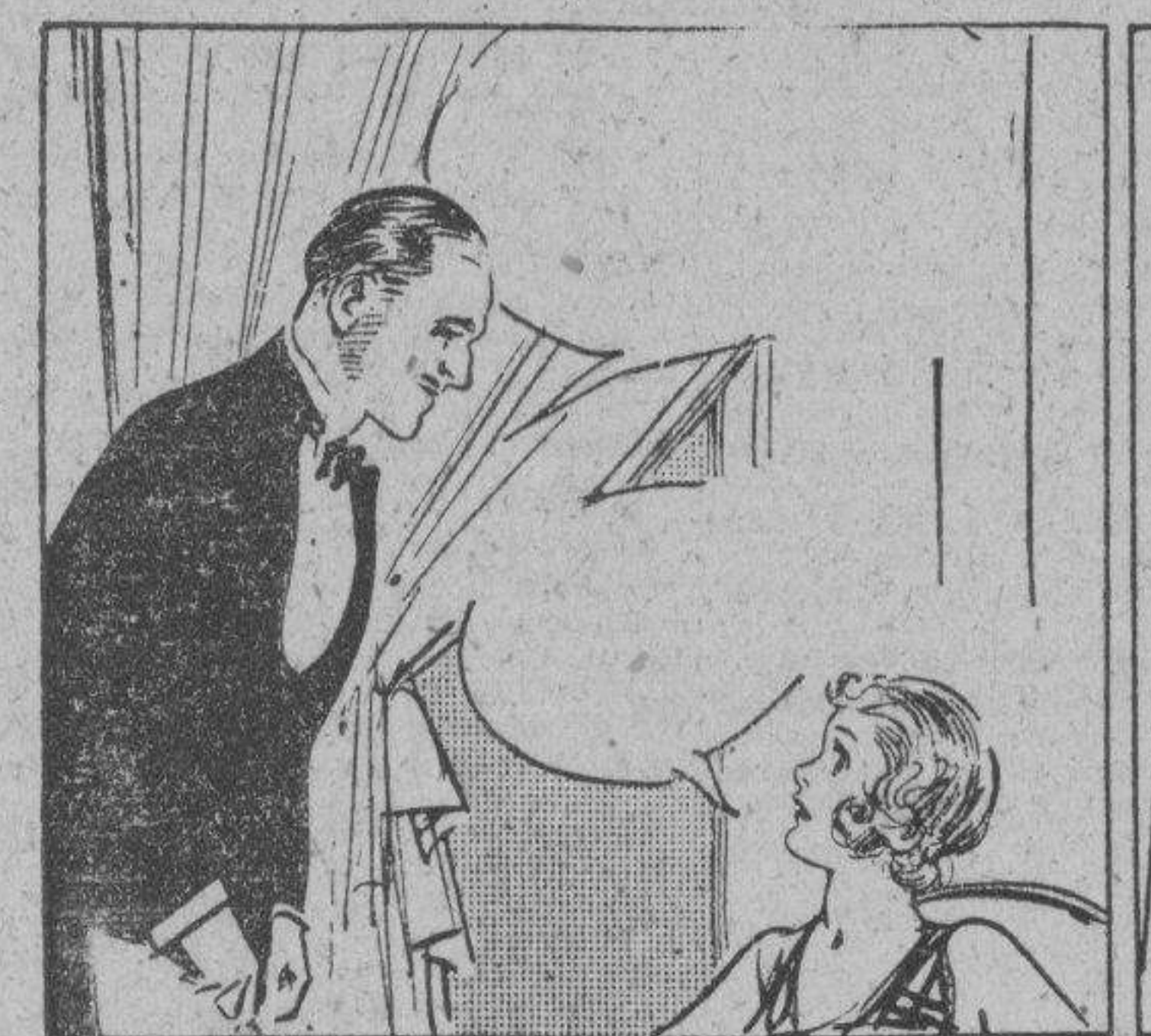
LOGAN: Dispenseme por un momento, chiquilla. Un amigo desea hablar dos palabras conmigo. CONNIE: Ciertamente, Mr. Logan.