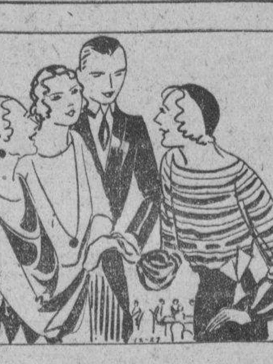
Fiesta de desposorio. Pregunta.—Desea dar un bridge-tea un sábado por la tarde para presentar a la prometida de mi hijo, Miss S., a mis amigas. Debo invitar a la madre de la chica? Tengo entendido que ella es una experta jugadora. No le conozco mucho a ella. Yo soy bastante tonta en el bridge. Seria necesario para mi jugar? Como se envían las invitaciones? Como le presento a Miss S.? Qué decoraciones sugiere Vd.? La fiesta se dará a fines de enero, cuando Miss S. y algunas de sus amigas estarán en la ciudad para las vacaciones semestrales. El casamiento tendrá lugar después de su graduación en junio. MRS. F. Respuesta.—Envíe tarjetas de invitación a todas a quienes quiera reunir, incluyendo a la madre de la chica. Incluya la tarjeta de Miss S. con la suya. En la tarjeta de Vd. debe ponerse "bridge-tea a las 2. sab. 30 de enero, R. S. v. p." La anfitriona no debe jugar a menos que se necesite a determinada extensión, y cuando se presente la necesidad de ser auxiliada se construya al lado de ella un Radburn numero II, una segunda ciudad feliz, que estará con la primera, a excepción de los puntos de contacto que se hayan previsto, solo en la conexión que exijan los...