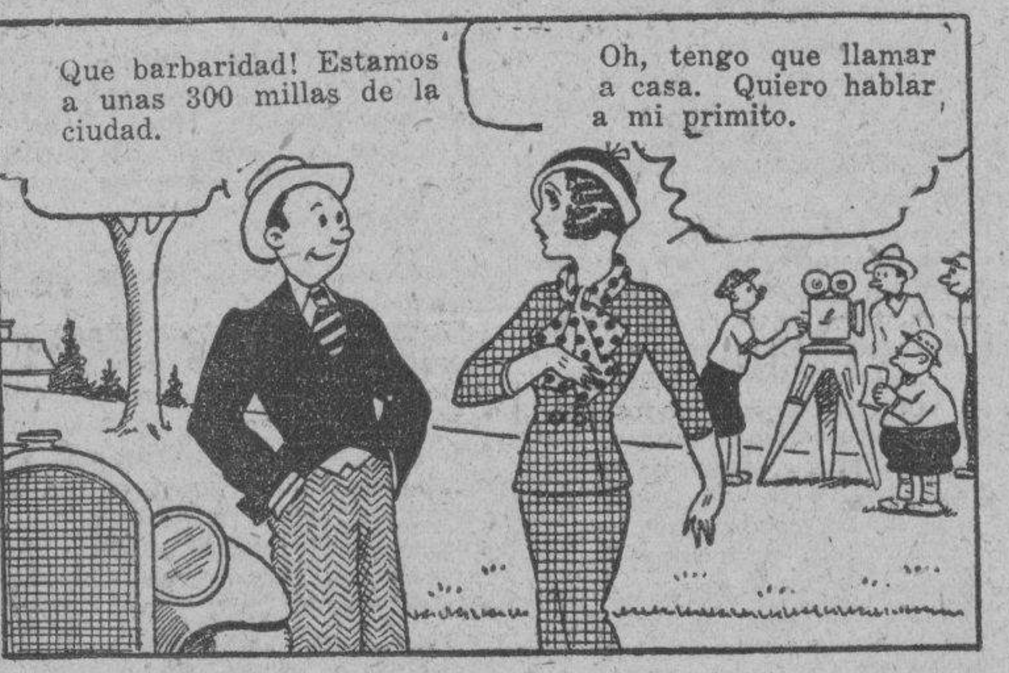
Que barbaridad! Estamos a unas 300 millas de la ciudad. Oh, tengo que llamar a casa. Quiero hablar a mi primito.