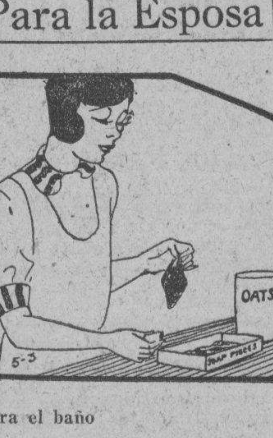
Para el baño Una gran ayuda para su baño puede hacerse facilmente en casa. Cuarde los pequeños trocitos de jabon de teocador. Colóquelos en los saquitos de queso. Ponga un poco de oatmeal en cada saco. Use esto para su baño. Cuestan practicamente nada y ahorra los desperdicios. La pasta suaviza a la piel. LA MUJER CASERA.