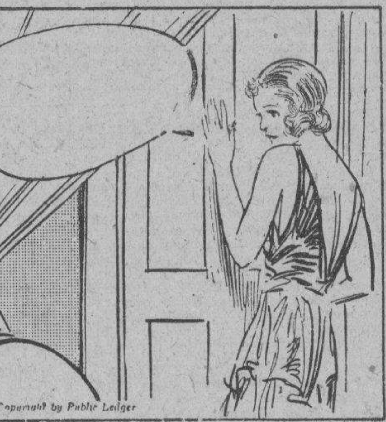
CONNIE: Que barbaridad! No puedo coger ni una palabra de lo que estan hablando.