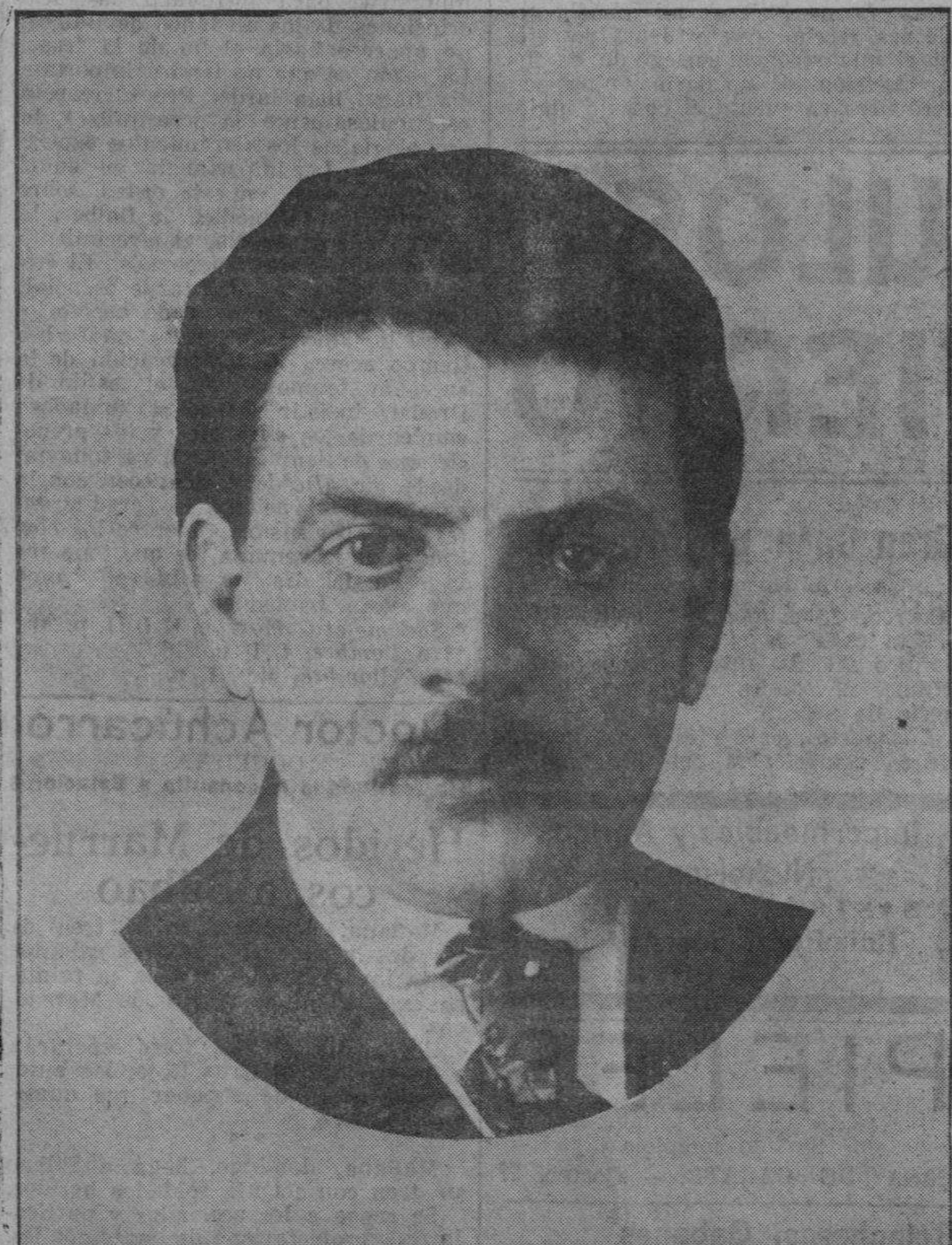
Herriot, el primer ministro francés, que va a dirigir un mensaje en favor de la paz a las Universidades de Europa.