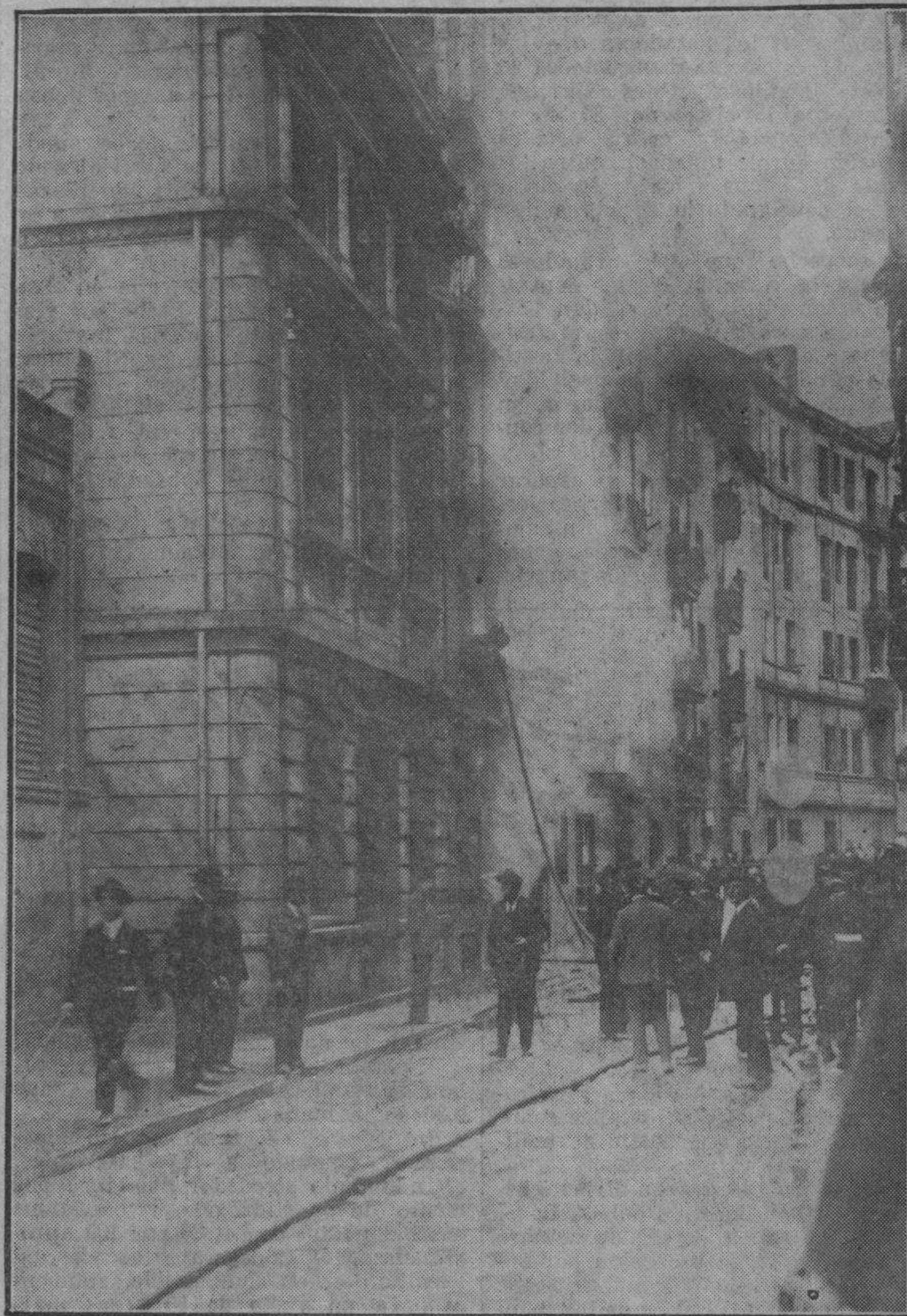
UN ASPECTO DE LA CASA SIN ESTRADA

Existen, eso sí, tópicos críticos, que son lo menos crítico del mundo. Así que se puede mantener los mayores disparates, sin que nadie salga al paso, y, si alguien surge, su voz se pierde en el desierto. ¿Qué polémicas apretadas, combativas, se han presenciado en la Prensa española? ¿A quién se le exige integridad moral, que es tanto como decir buen orden en sus ideas y su conducta? ¿Cuántos son los españoles que tienen personalidad en ese sentido? ¿Quién posee aquí un perfil ideológico y moral bien contorneado?