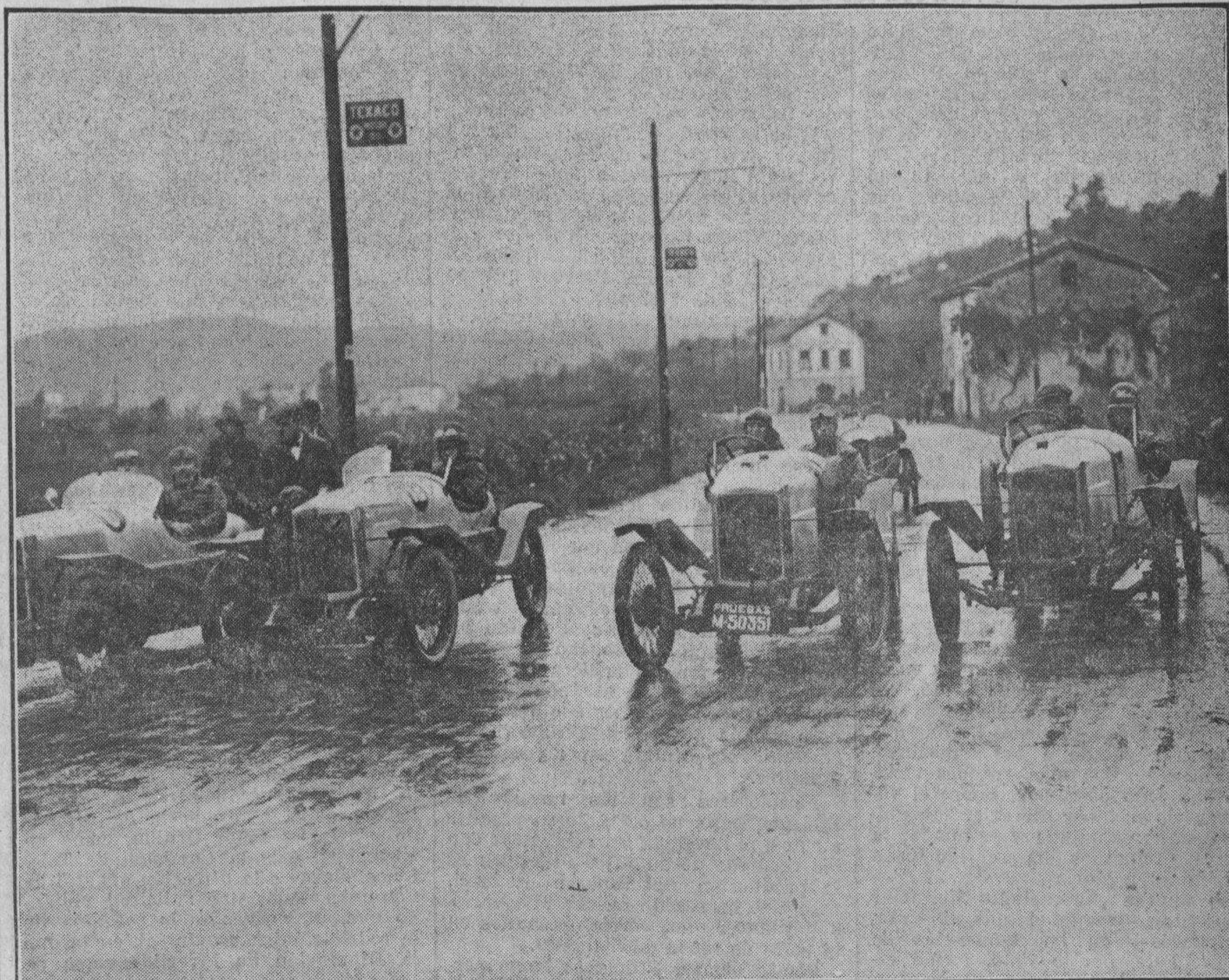
LOS «HISPARCOS» EN LA CARRERA DEL GRAN PREMIO DE TURISMO