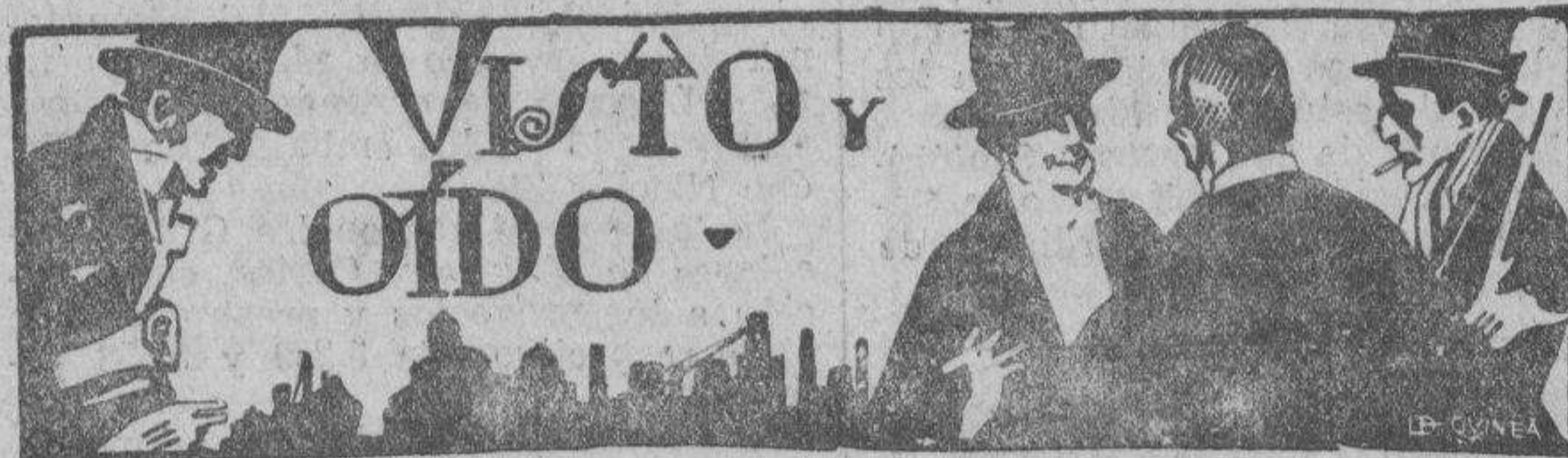
DIEGO DE LEÓN

Hoy hace un siglo que don Diego Antonio de León, conde de Belascoain, fué recibido capitán de caballería.