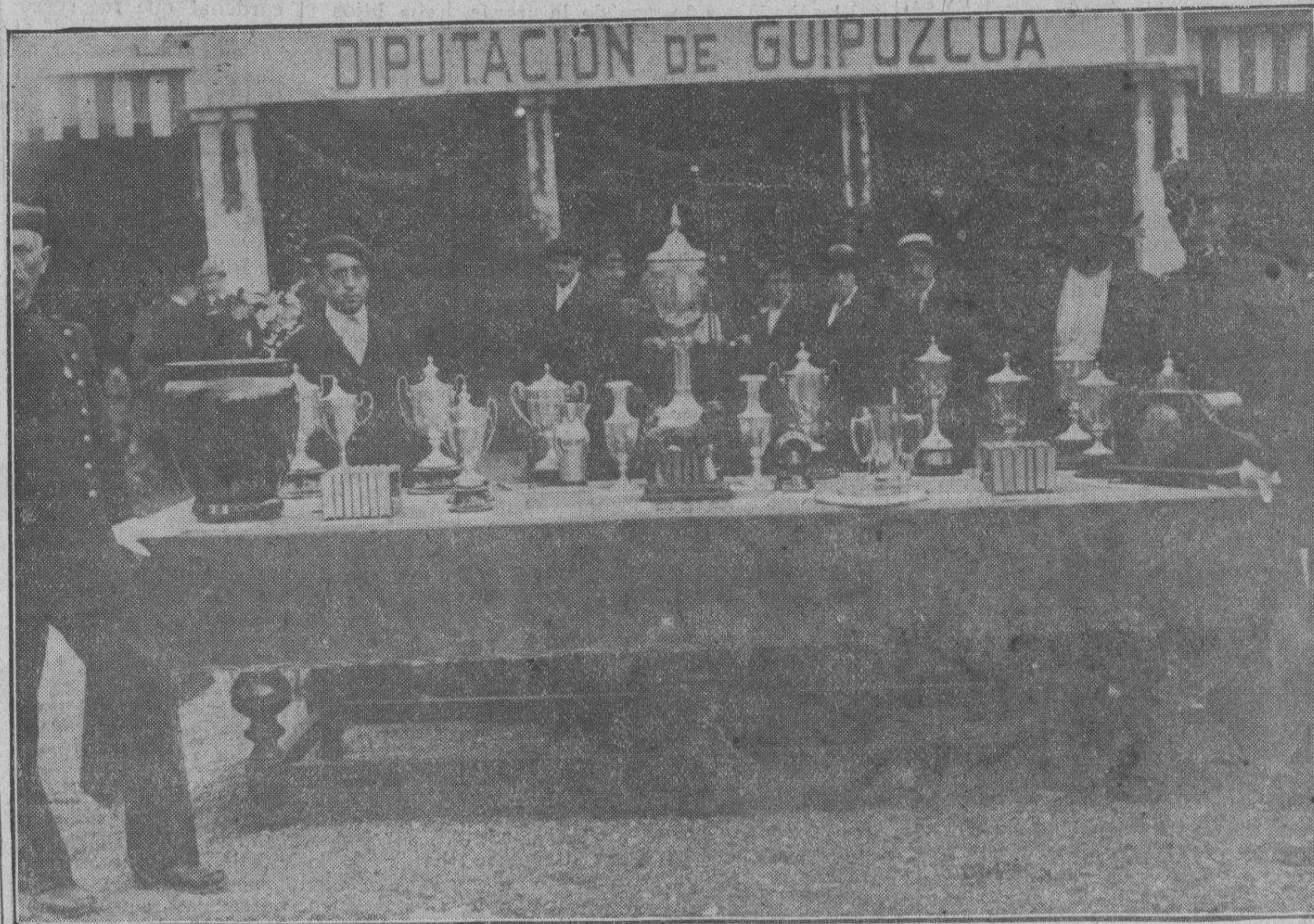
MESA CON LOS PREMIOS DEL CERTAMEN, QUE HAN SIDO DISTRIBUIDOS ESTA TARDE