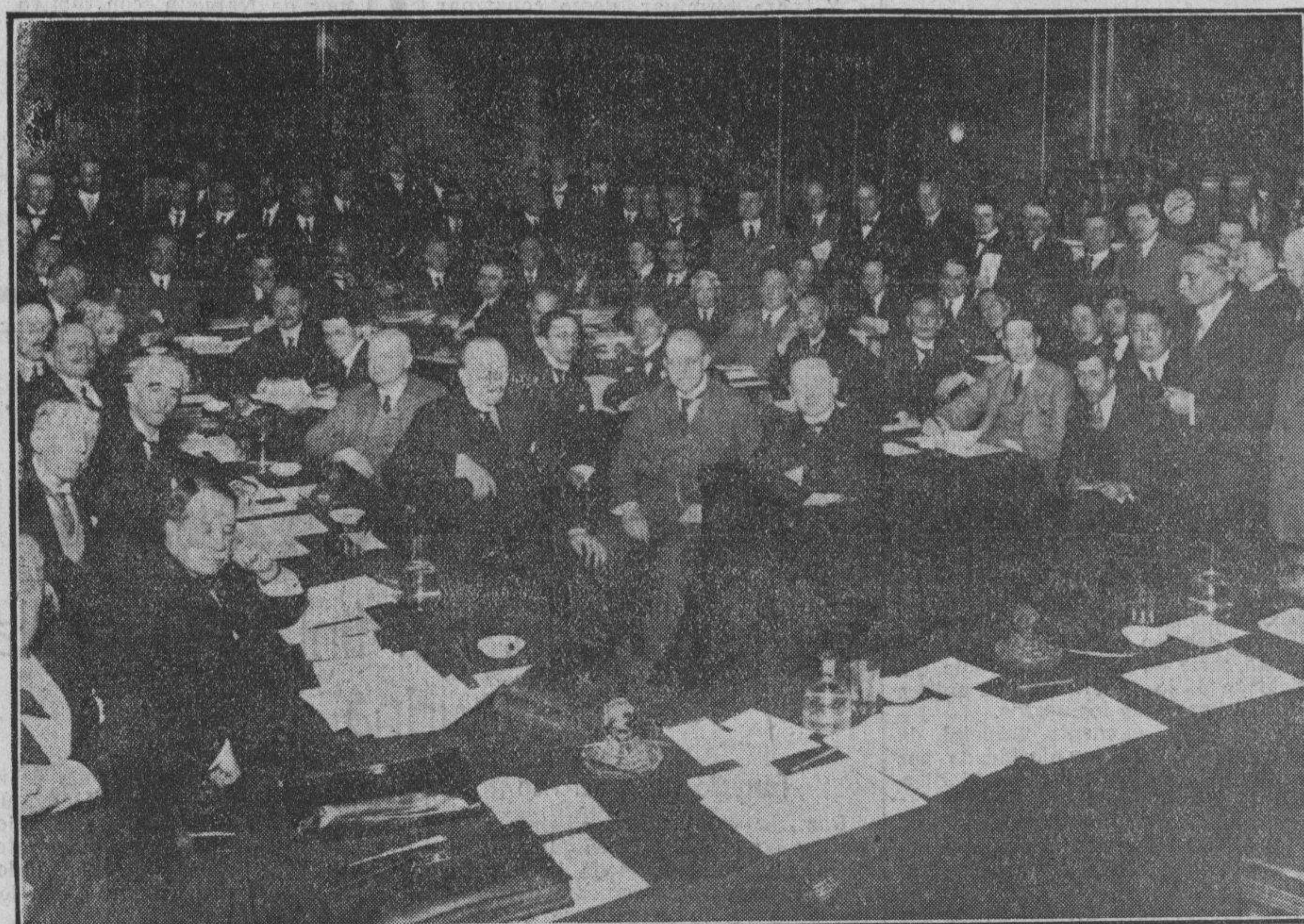
Fotografía oficial, con que Mac Donald obsequia a todos los delegados de la Conferencia de Londres. Todos ellos, sin excepción, uno tan sólo, aparecen en el grabado.