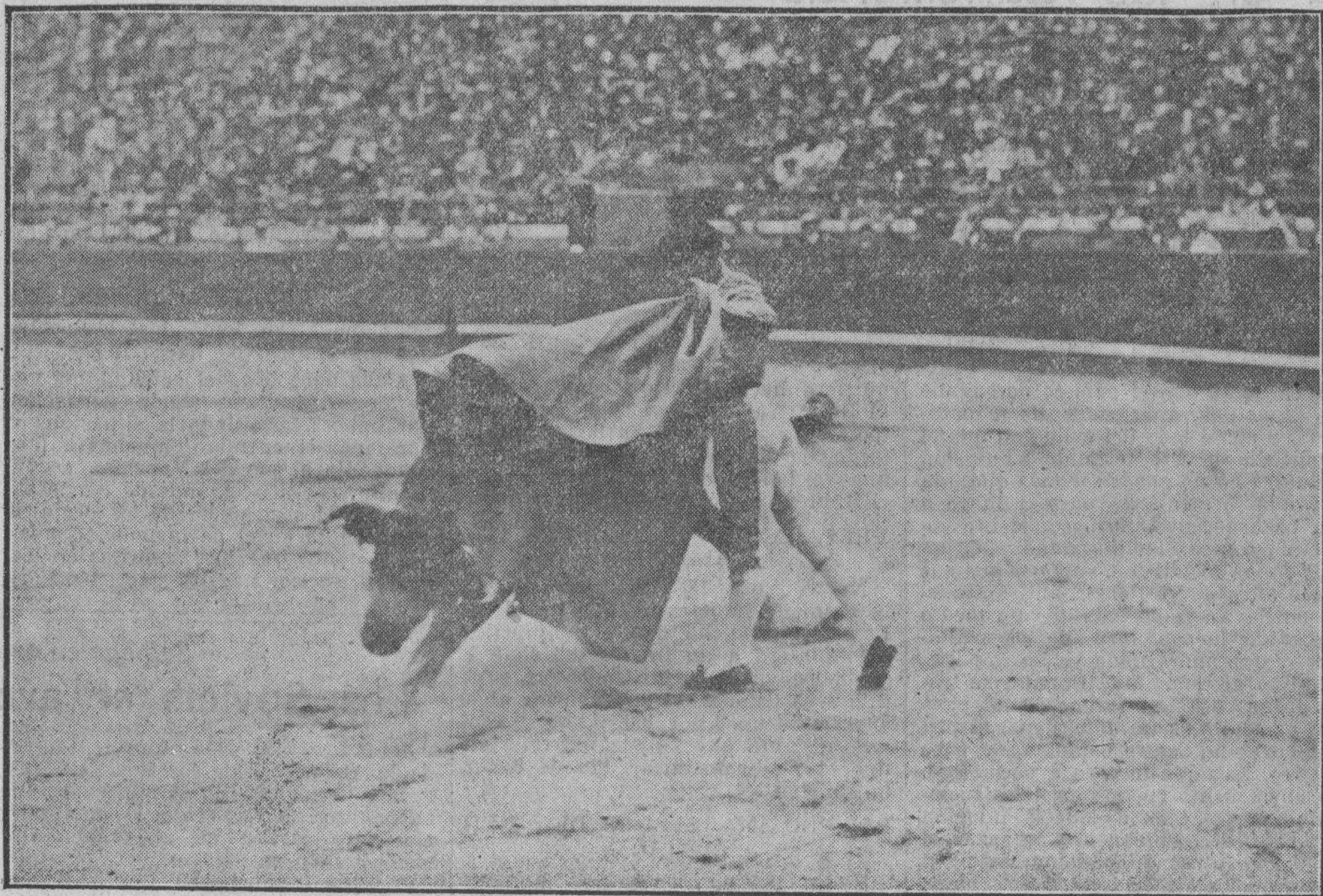
UNA VERONICA DEL ALGABENO