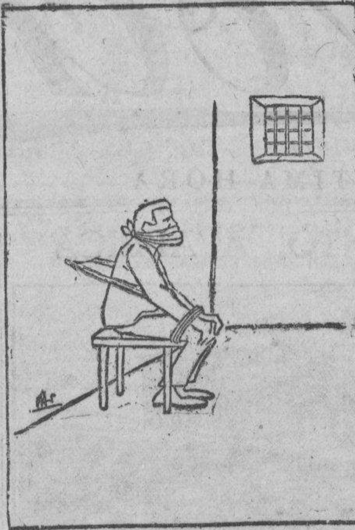
Un periodista de la oposición, en el libre ejercicio de su derecho. (De 'Il Becco Giallo', de Roma)

Calvo Hermanos PROPIEDADES - HIPOTECAS SEGUROS Plaza Elíptica, 2 Bilbao