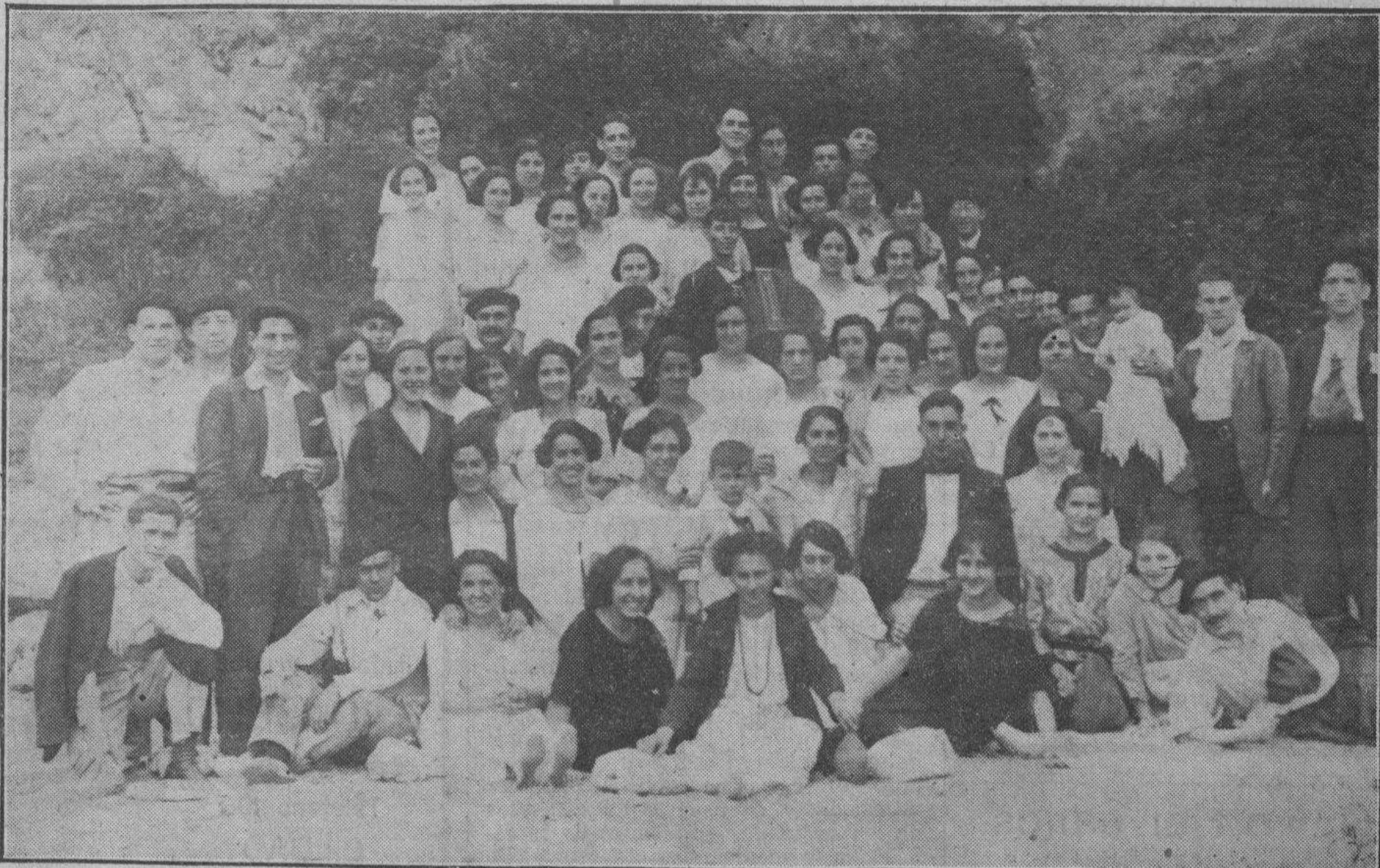
JIRA DEL CLUB CANTABRIA A BAQUIO, CON MOTIVO DEL TRIUNFO DEL CAMPEONATO DE LA SERIE C