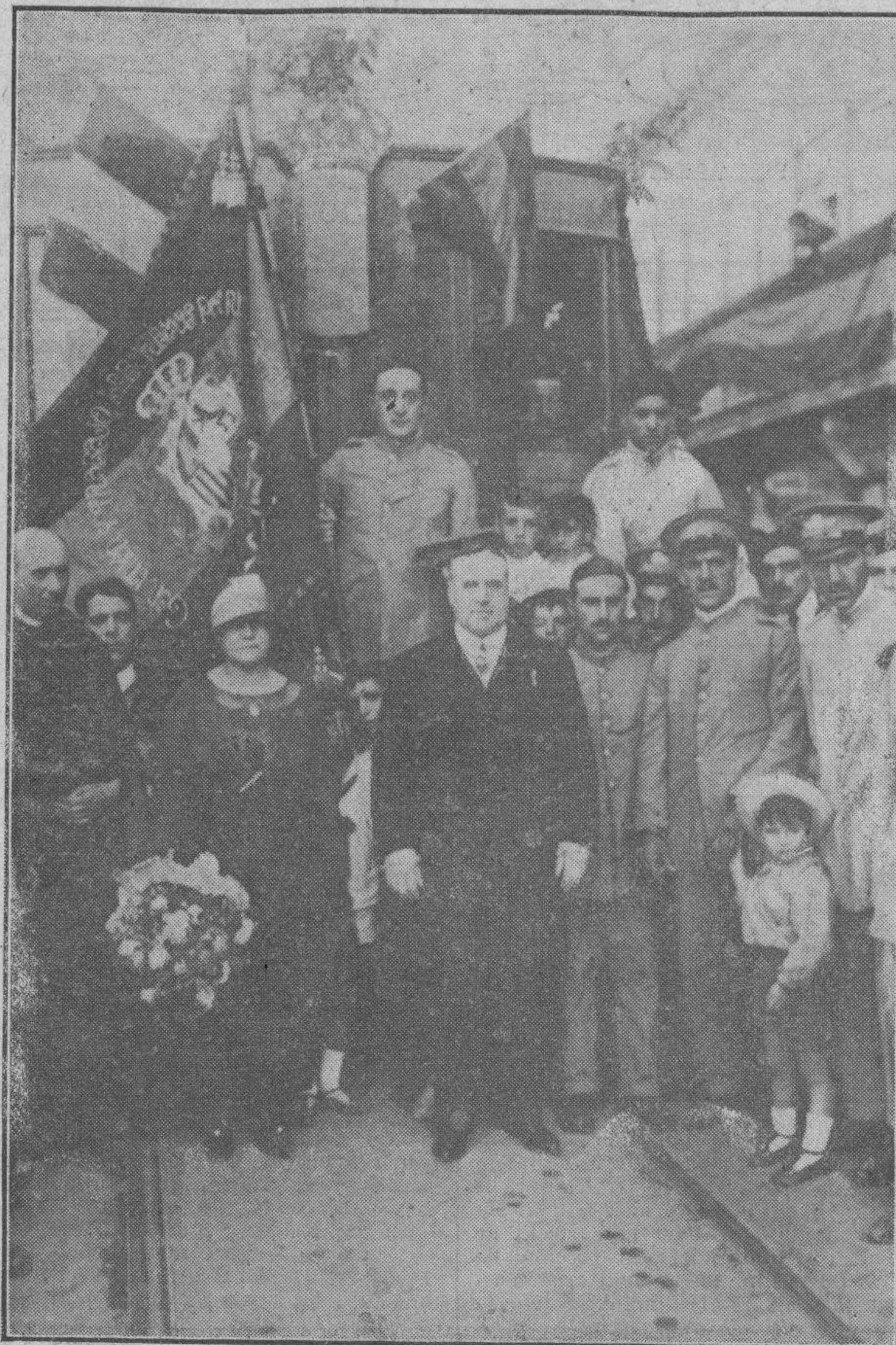
UN MOMENTO DESPUES DE LA BENDICION DE LA BANDERA

¡Señor Sant Yago: He concluido mi oración! ¡He concluido mi plegaria, eminentísimo cardenal, cabildo ilustre de la catedral compostelana, señoras y señores, y extiende tu bendición sobre mi rey, sobre mi pue-