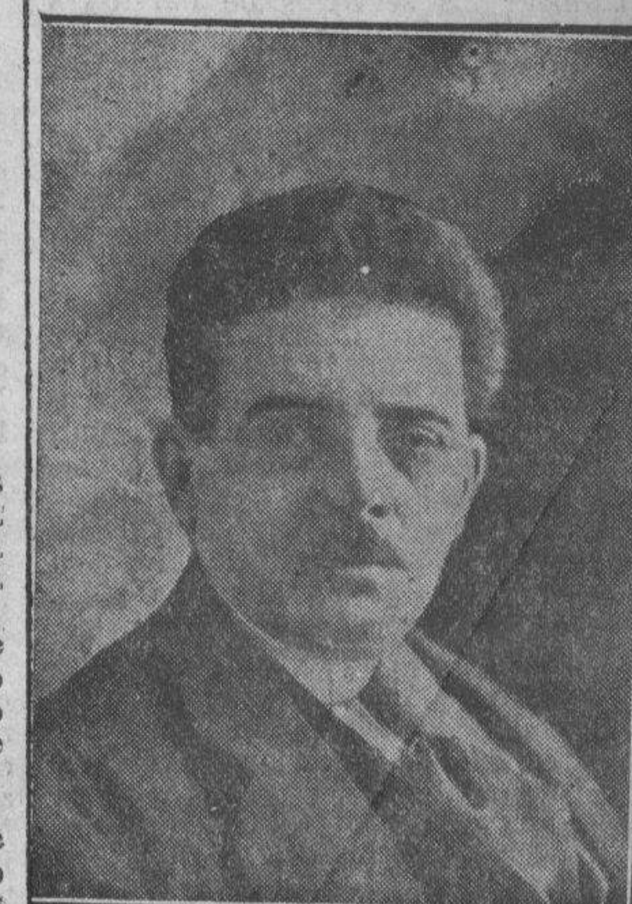
Herriot, periodista insigne, alcalde de Lyon desde hace diez años, ex ministro de la Unión Sagrada durante la gran guerra, jefe del partido radical socialista, que reemplazará, según todas las probabilidades, a Poincaré.