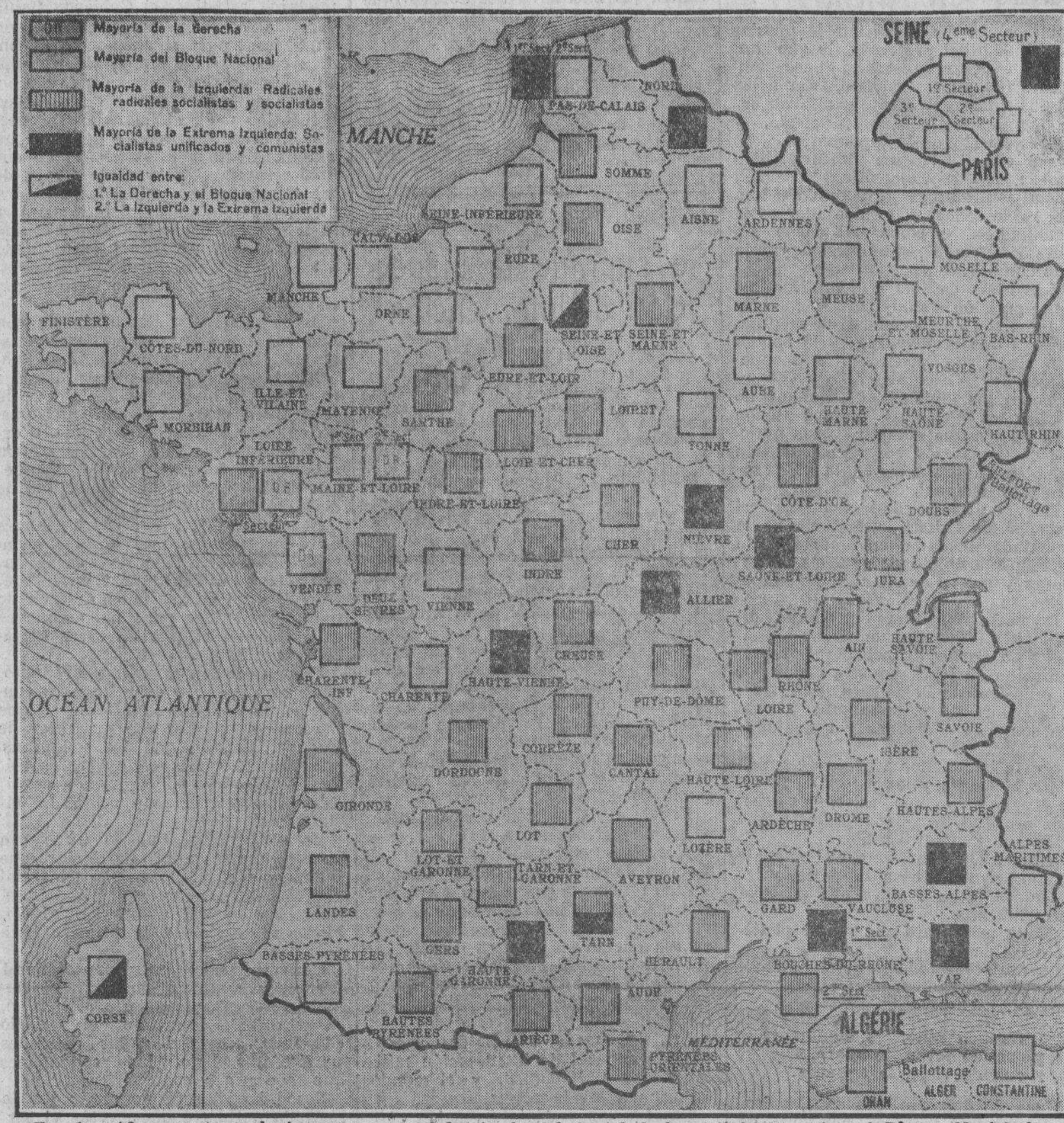
En el gráfico que reproducimos se ve que el triunfo del Cartel de las Izquierdas sobre el Bloque Nacional se ha registrado no solamente en las grandes ciudades, sino en toda la extensión del territorio francés.

ba de comprender las incongruencias y engaños de la conducta inglesa, y a propósito de ello dijo algunas cosas inteligentes; sobre todo, cuando en la escuela de Manchester declaró que su divisa era «Paz y Abundancia, con el pueblo muriéndose de hambre y el mundo en armas».