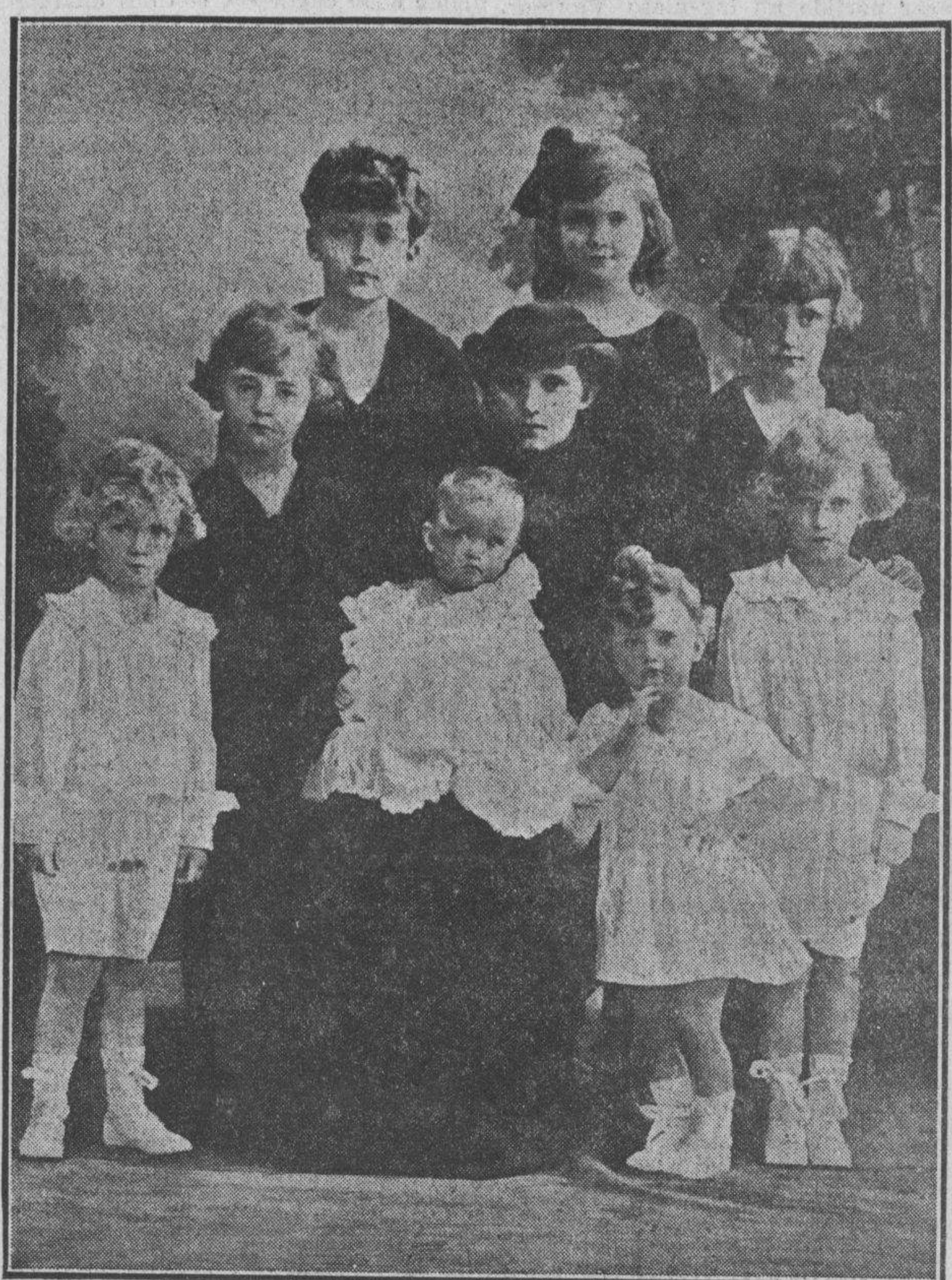
ULTIMA FOTOGRAFIA DE LA EX EMPERATRIZ ZITA, EN LEQUEITIO, CON SUS HIJOS LAS ARCHIDUCESAS ADELAIDA, CARLOTA Y MARIA Y LOS ARCHIDUCES OTTO, ROBERTO, FELIX, CARLOS LUIS Y RODOLFO