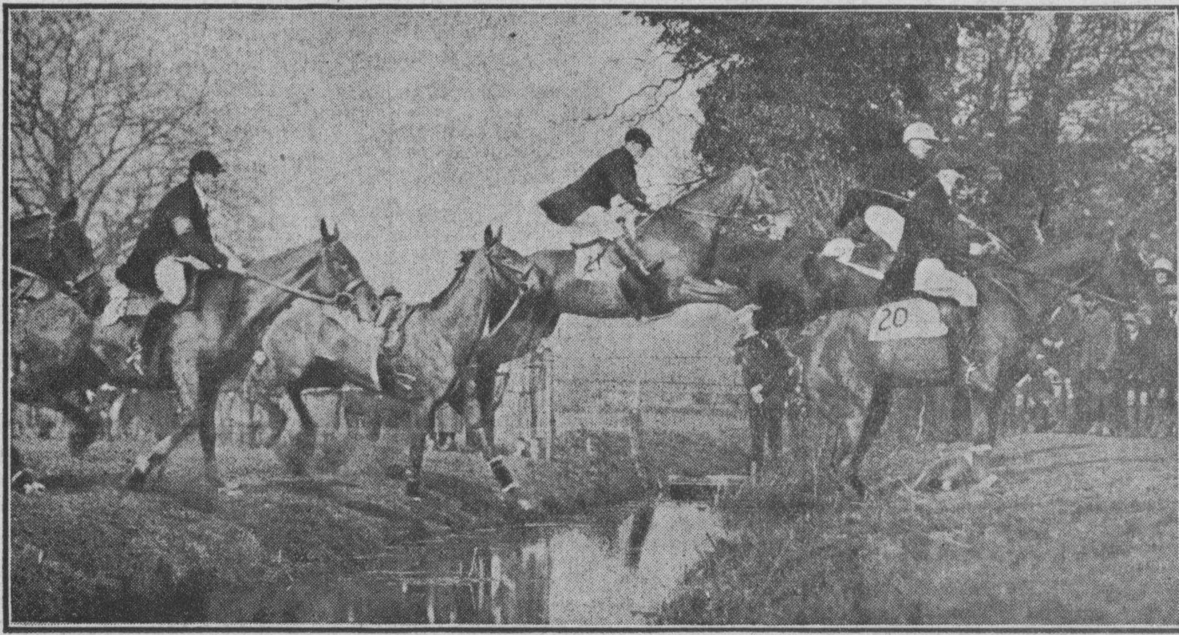
EL PRINCIPE DE GALES ENTRENANDOSE PARA LA QUINTA CAIDA

crítico de arte en un periódico, habiendo anunciado que, puesto en el trance de optar por abandonar una de estas cosas, dejará el tennis.