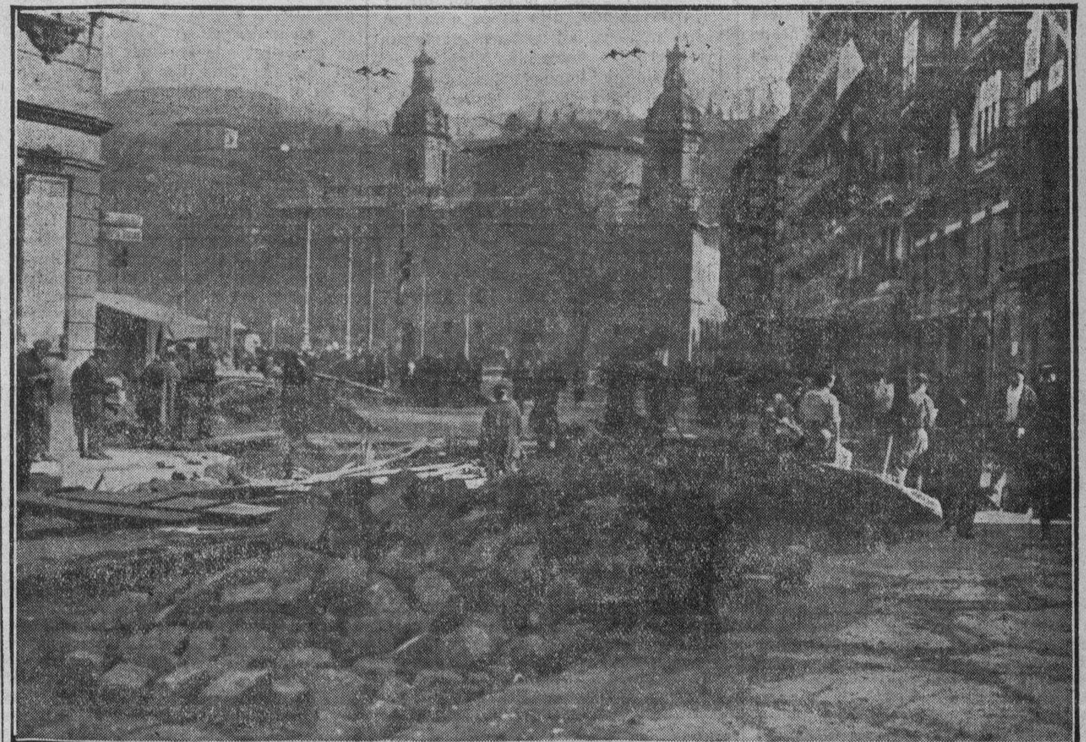
SEGUIMOS AVANZANDO LENTAMENTE (Parte oficial del contratista).