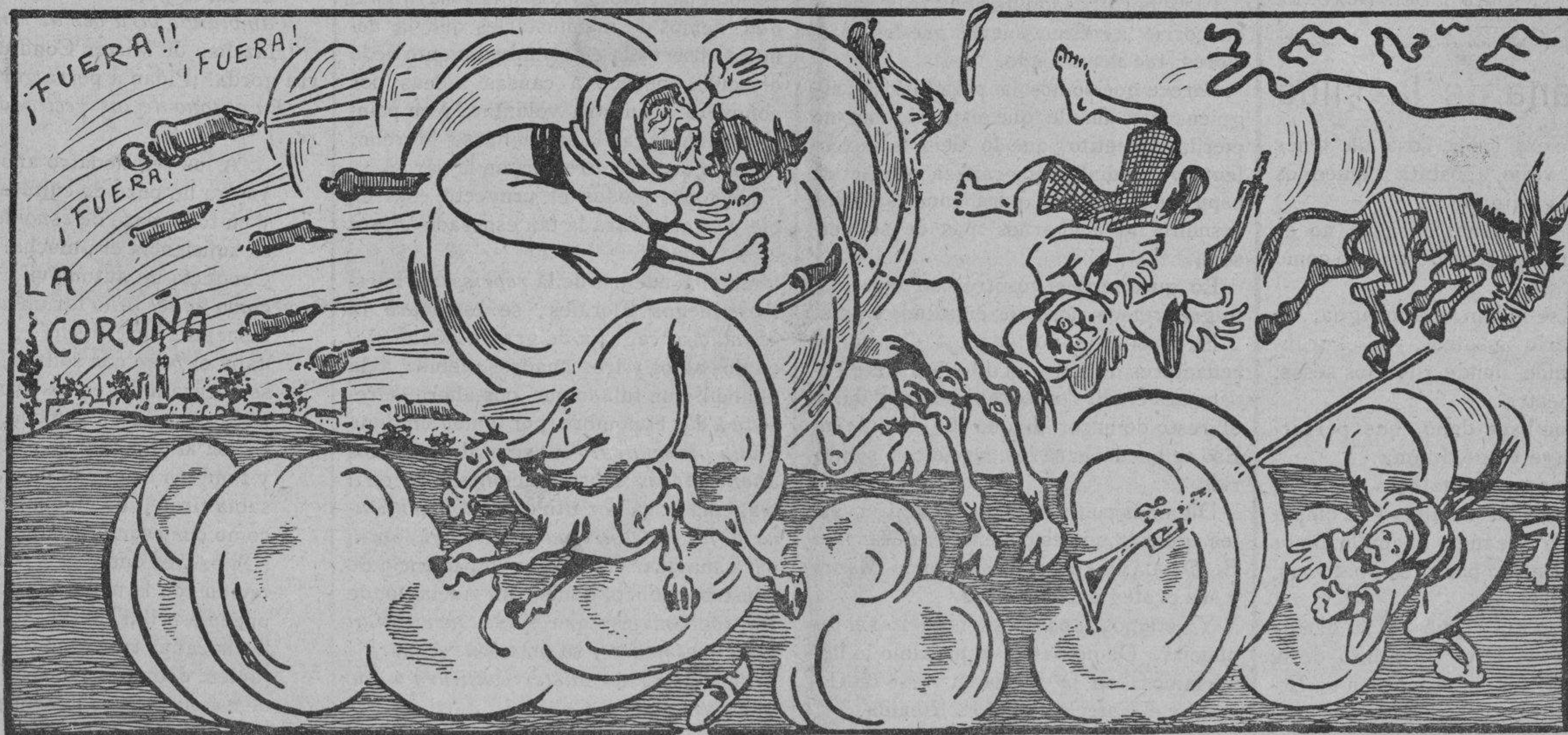
Pero el simoum coruñés que tiene muy mala treta lo hecha todo de revés