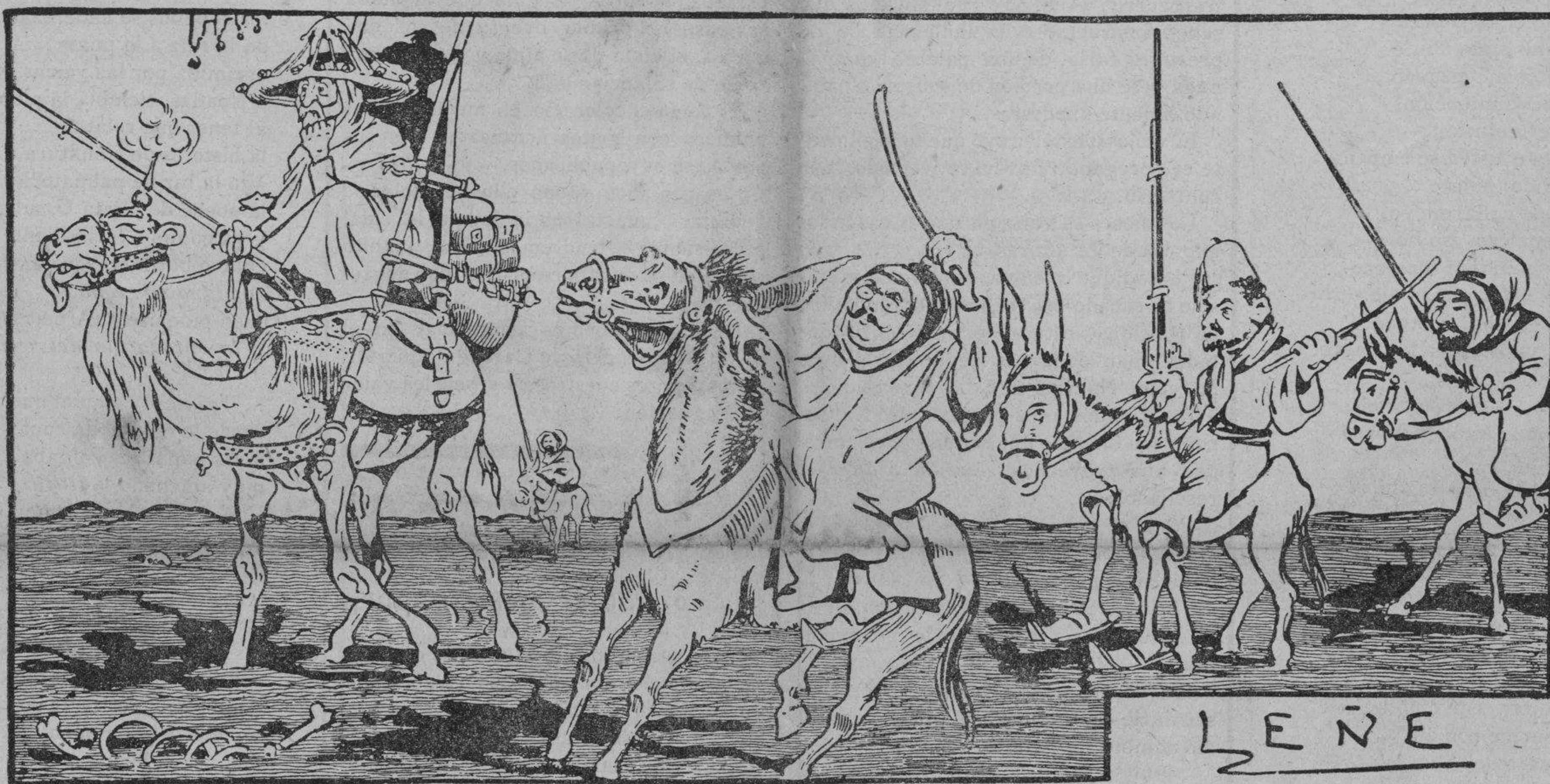
La mehalla solidaria de infundios bien equipada