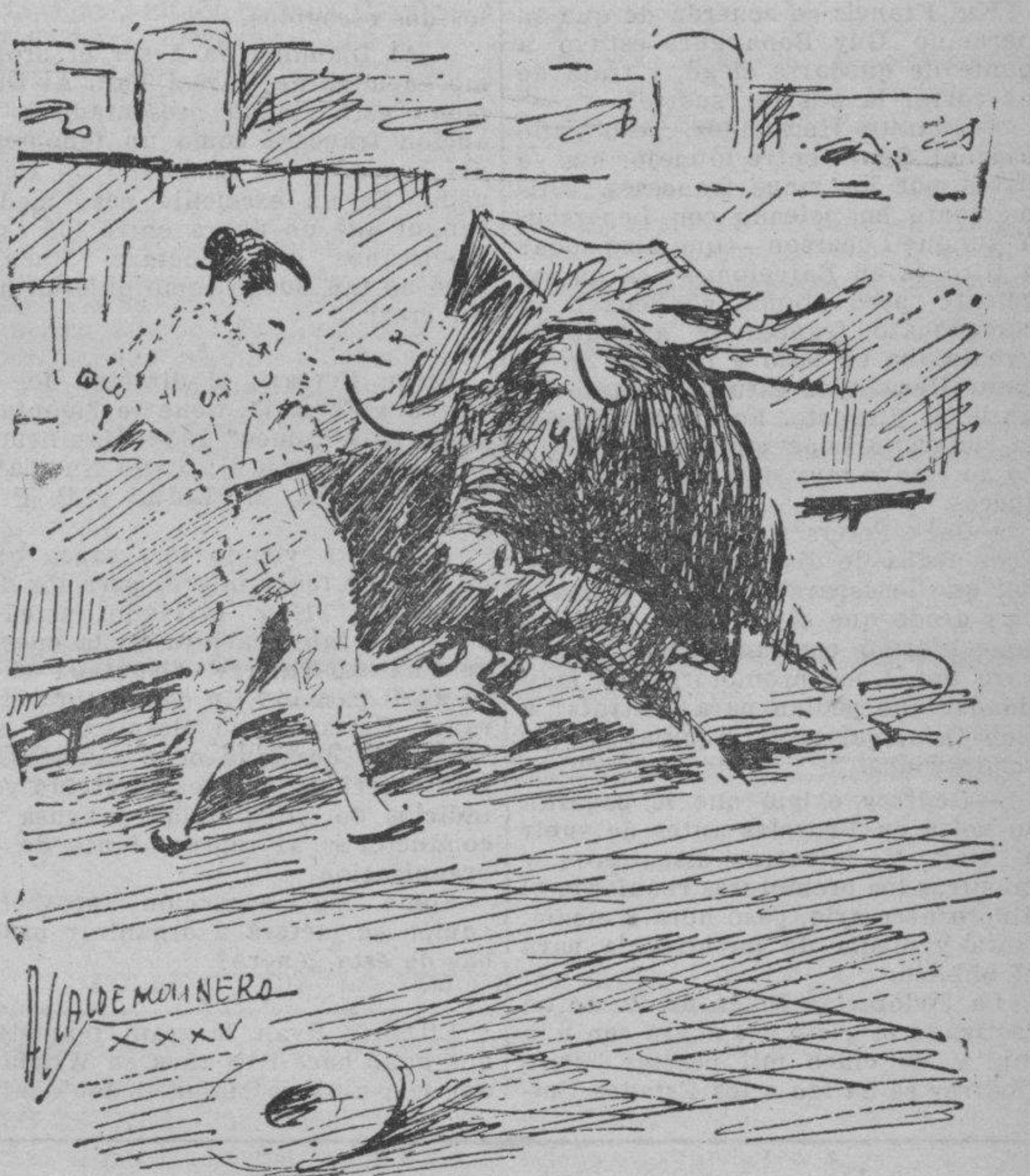
"Rafaelillo", templando en un lance de capa a su primer toro y en un pase por alto a su segundo (Apuntes del natural de Alcalde Molinero.)