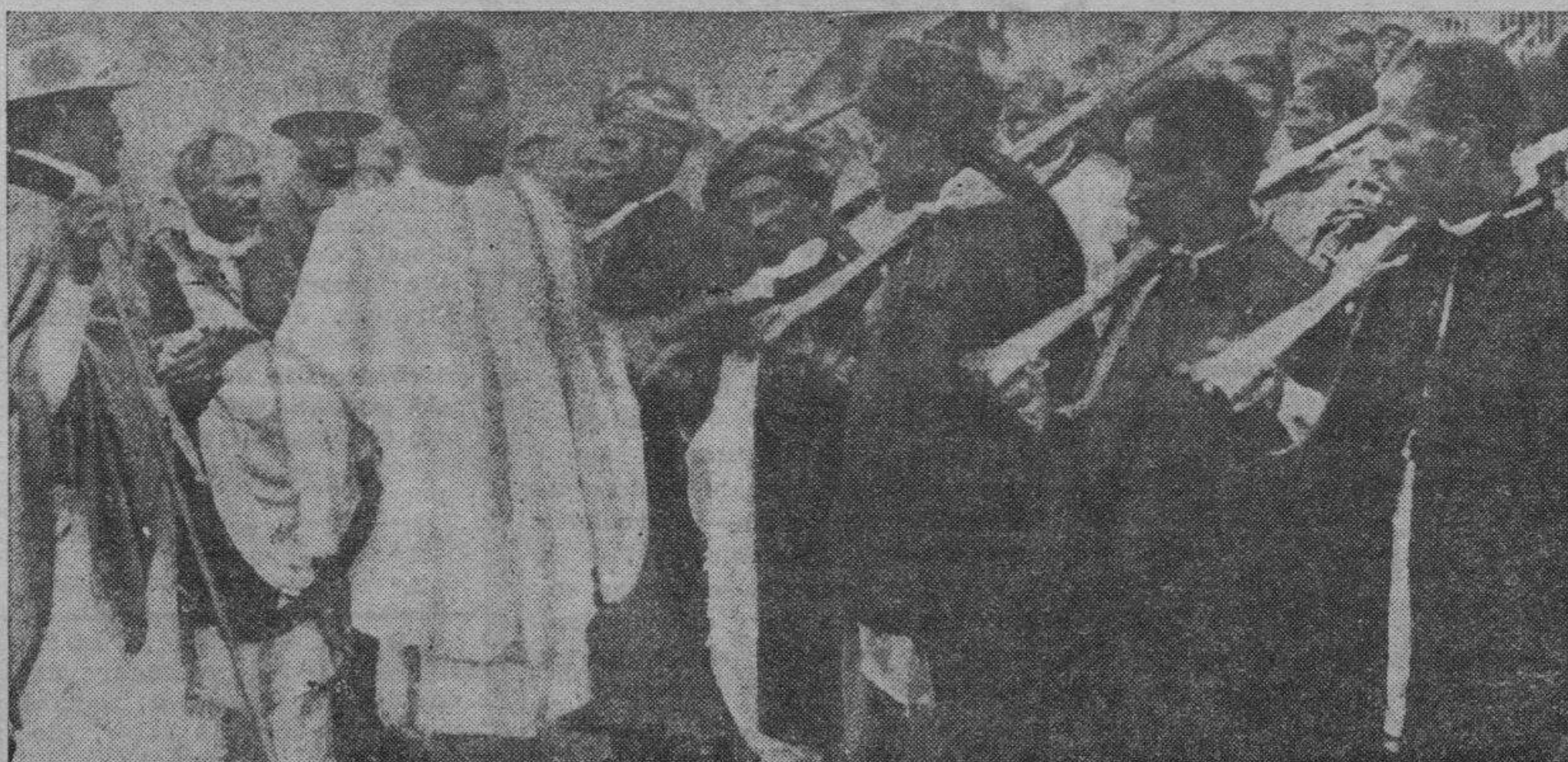
Llegan mahometanos a defender el territorio abisinio. Se les arma y los instructores militares tratan de llevarlos a una disciplina ajena a sus hábitos de guerrilleros indomables. Uno de aquellos inspectores pasa revista a los voluntarios que pocos días después han de partir para el frente