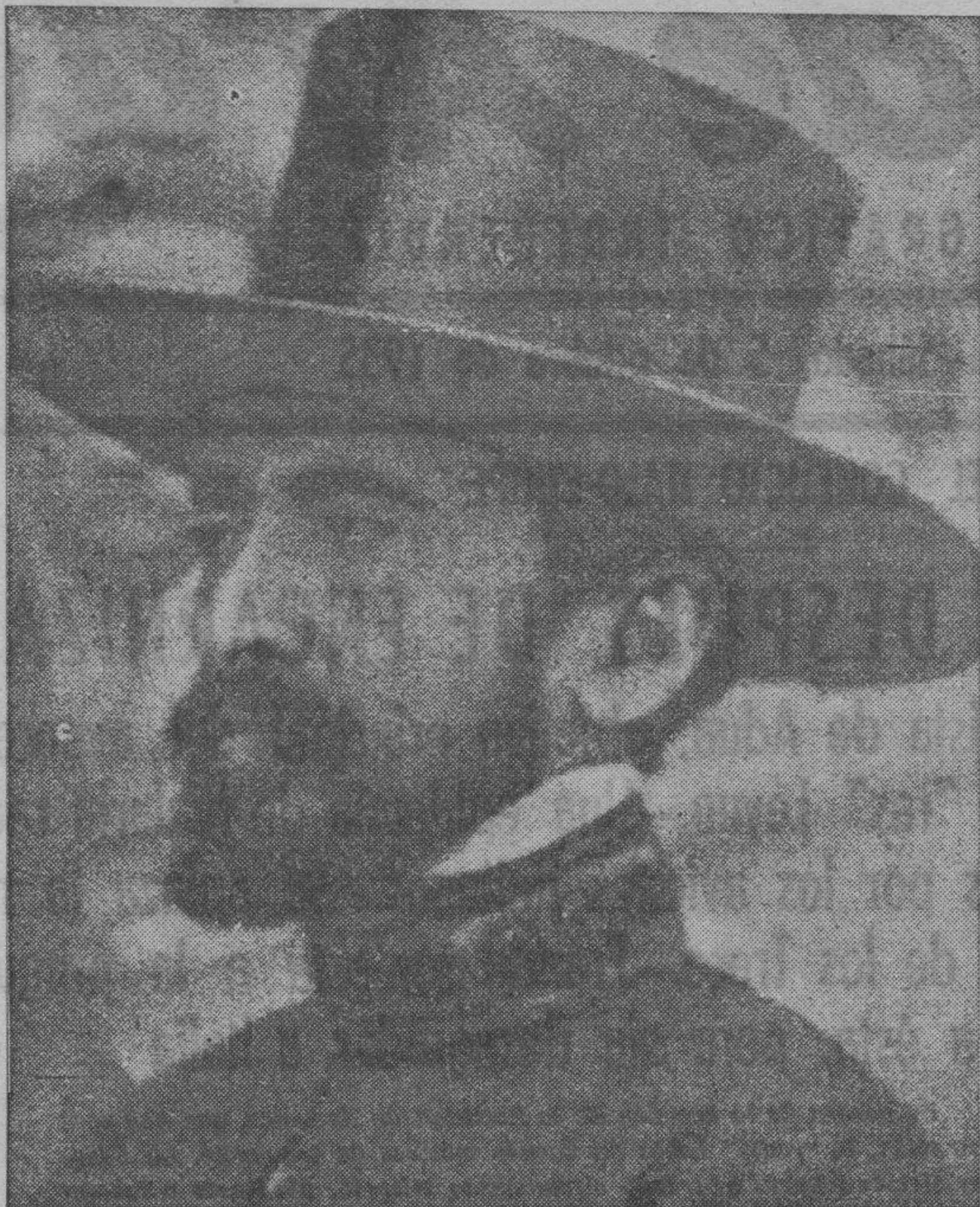
Ultimo retrato de Haile Selassie. El "rey de reyes" iba vestido de etíopeta. Llevaba un sombrero, el que ustedes ven, que tiene la gracia española de un "ancho" cordobés

ADDIS ABEBA. — En los frentes del Norte y del Este continúa la lucha encarnizada. Esta mañana los soldados italianos avanzaban lentamente.