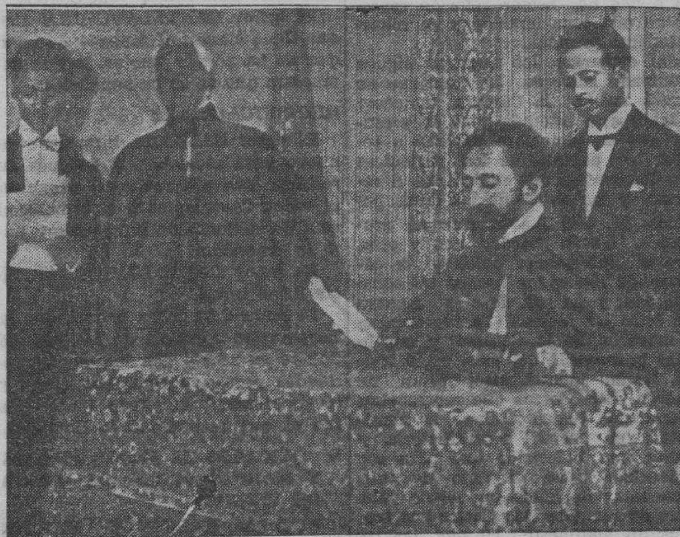
Pocos días antes de la guerra, el Negus hablaba al mundo por medio de la "radio". Defendía sus derechos y hacía un nuevo llamamiento a la Sociedad de Naciones

Idem dictando normas para la formación de Tribunales de oposición a las cátedras de los Centros de enseñanza dependientes del Ministerio de Instrucción Pública.