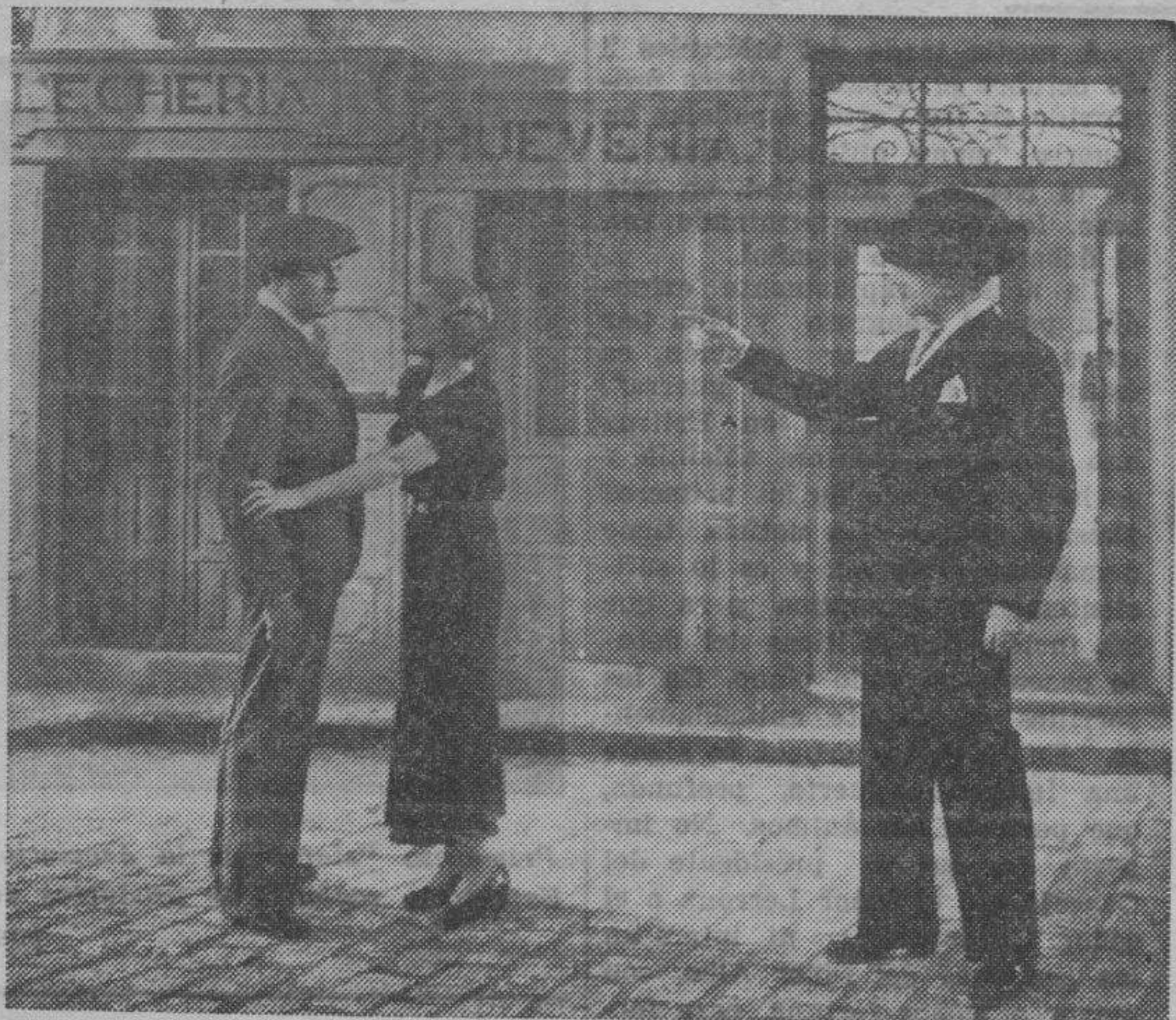
Una interesante escena de "Don Quintín, el amargao", "film" próximo a estrenarse

Práctica y bien orientada la "Guía", ha sido llevada toda ella con un esmero que acredita la ya reconocida