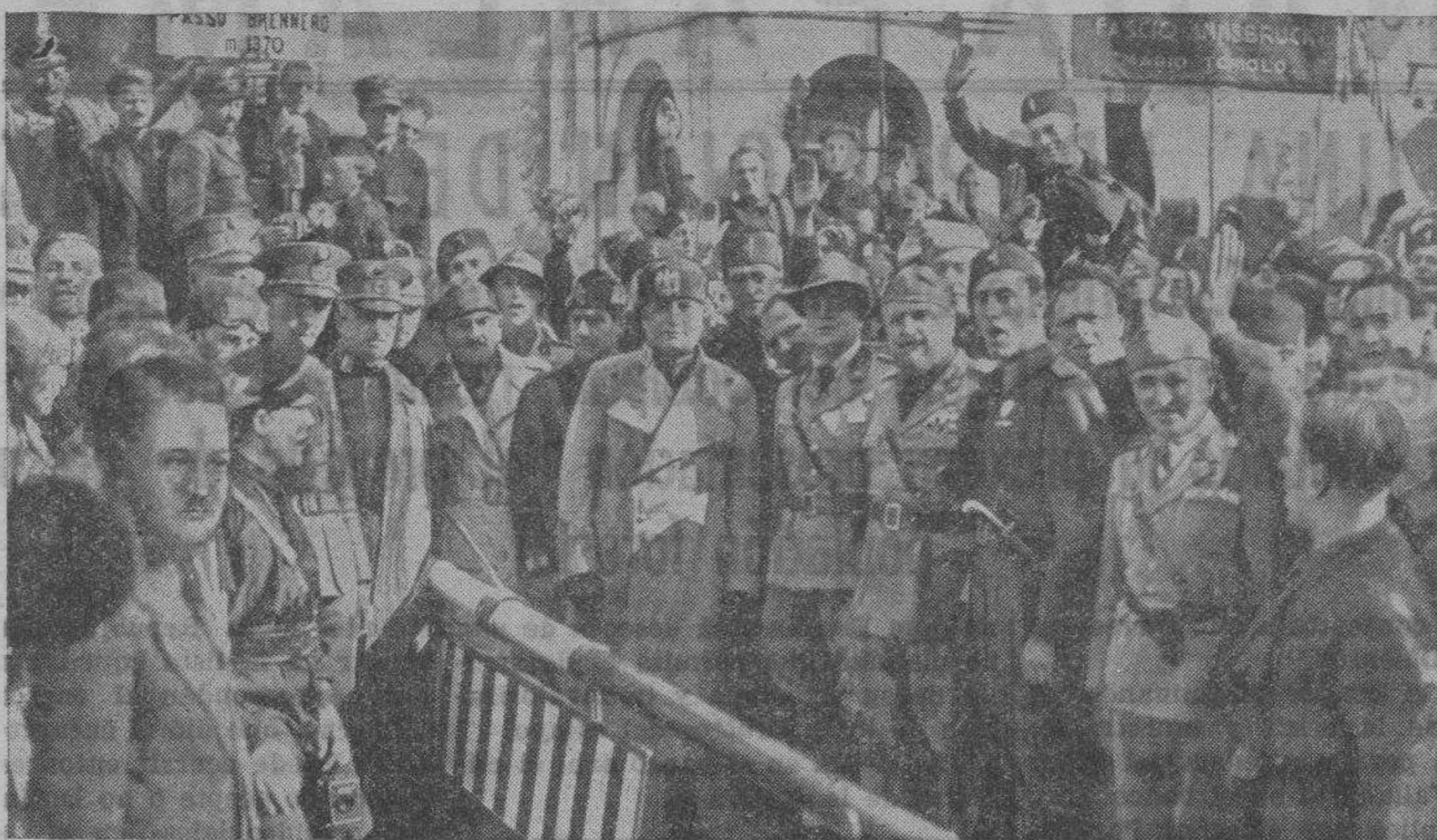
El "duce" sigue pronunciando discursos patrióticos. Esta fotografía recoge el momento en que Mussolini, rodeado de su Estado Mayor, se dirige al lugar donde millares de fascistas esperan oír su verbo cálido para aclamarle enfervorizados

COSO, 23. — Teléfono 1349 Perfumería Chóliz Esencias y colonias a granel de gran concentración. Perfumes WORTH