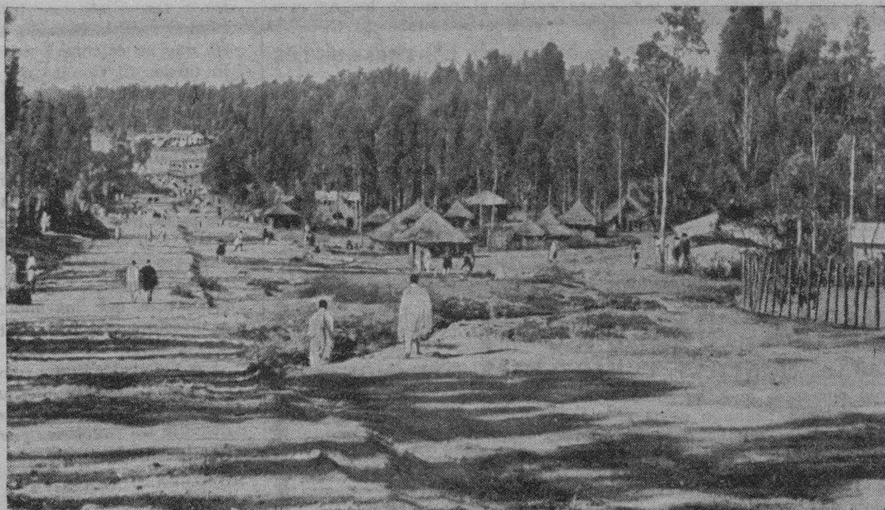
Una fotografía plena de actualidad. Esta agrupación de chozas sobre fondo de setra salvaje es una aldea abisinia. Una de esas aldeas donde el Negus ha reclutado lo más "selecto" de sus tropas irregulares

A medida que las tropas se acercaban a la frontera daban rienda