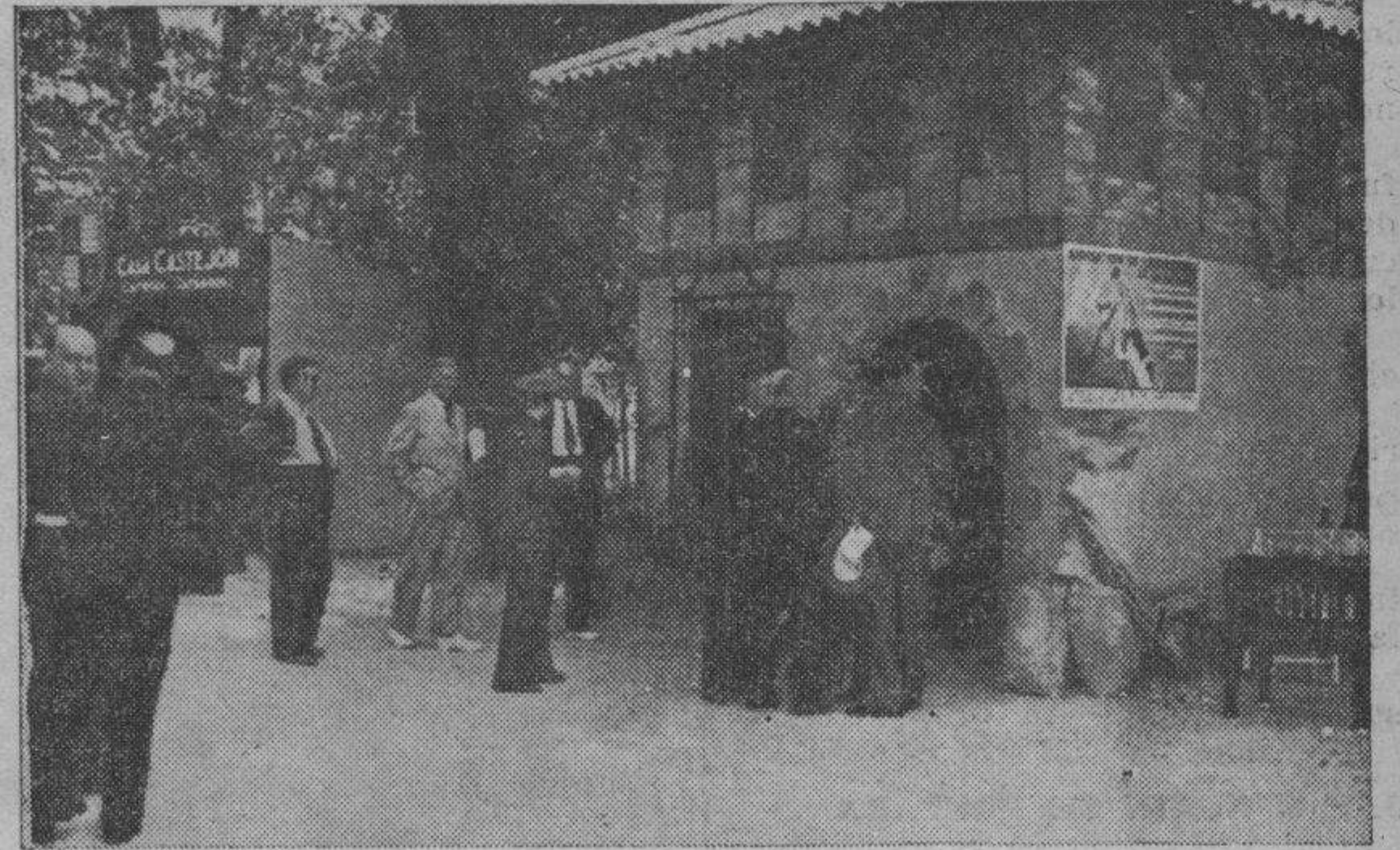
Primoroso "stand" de la Asociación de Labradores de Zaragoza en la Exposición regional de productos del campo, inaugurada en Madrid días pasados