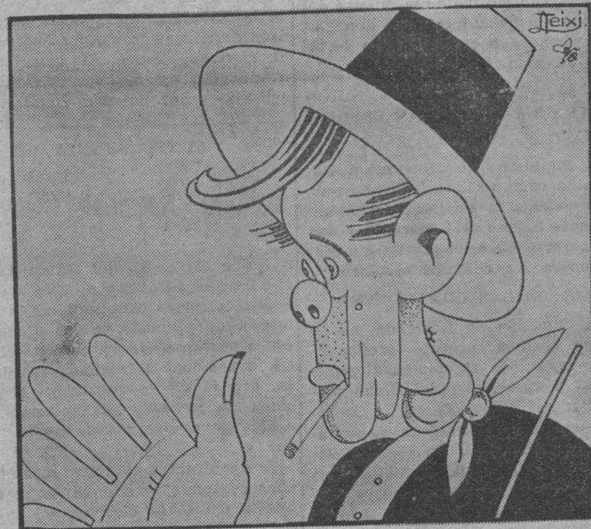
—¿Ensayo de ataques aéreos? ¿Es que no tenemos bastante con los ataques terrestres?

Vino la guerra y salió mal. Alemania era tan fuerte que, aunque mal dirigida, no sucumbió hasta de-