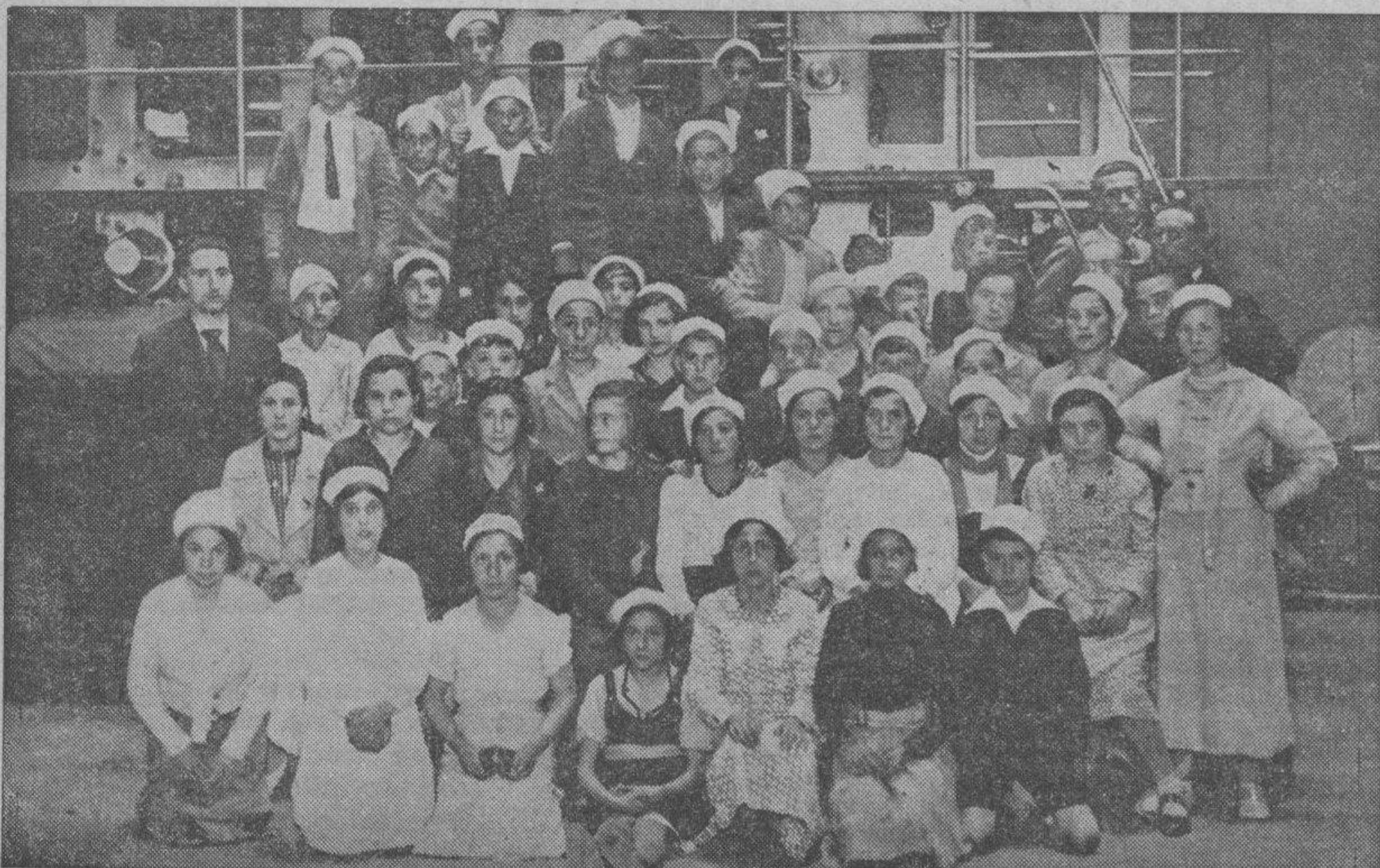
Grupo de niños y niñas de las escuelas de Peralta de la Sal que ayer visitaron nuestros talleres.