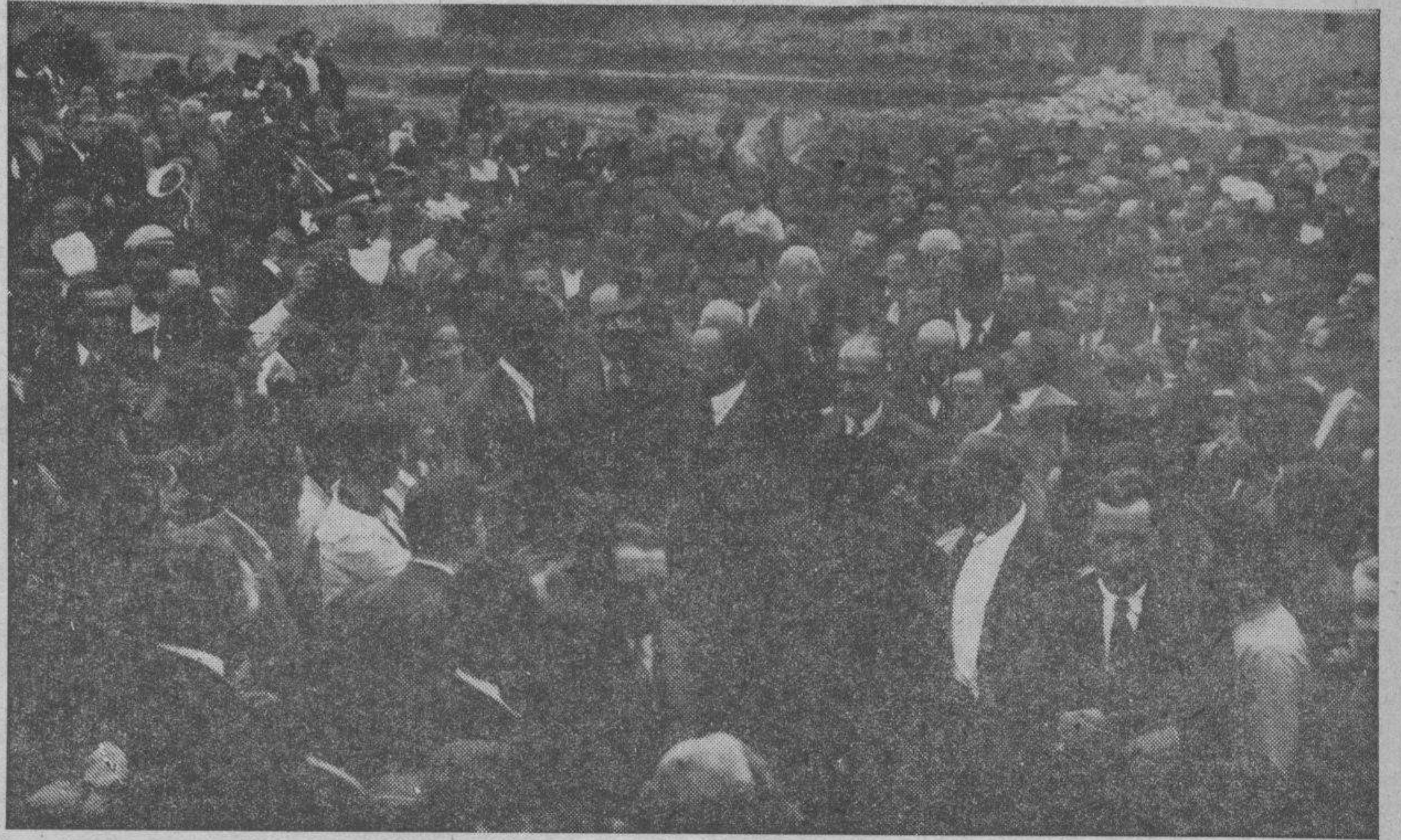
Otro de los magníficos aspectos que ofrecieron los pueblos al ser visitados por el ministro de Obras Públicas y el señor Lorenzo Pardo.

El barranco llamado el "Hoyo", que viene del término de Santed, y la "Cañada", que baja del término de Used, han llegado a unirse, ocupando el agua más de un kilómetro