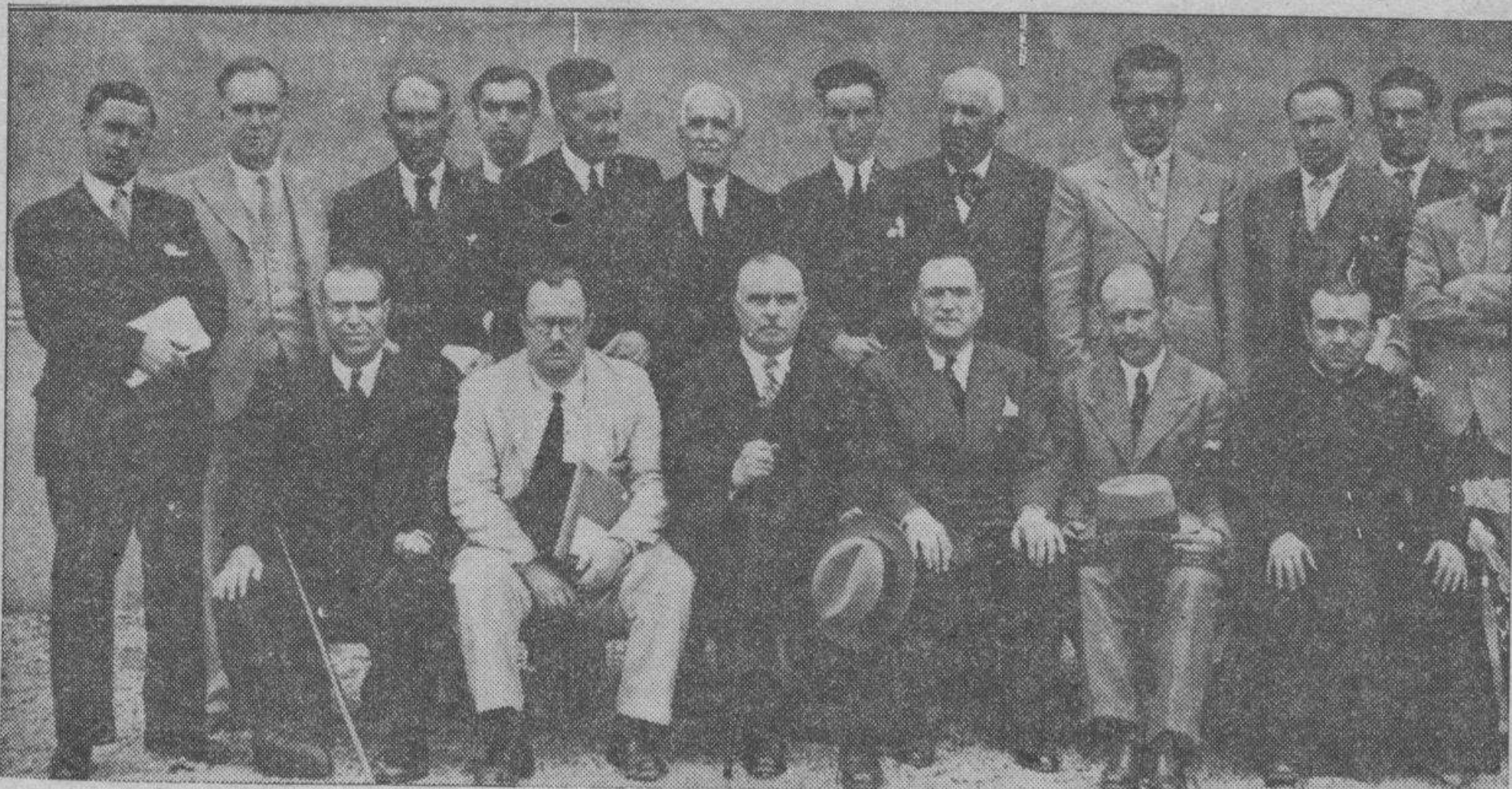
Los maestros que han hecho un cursillo de perfeccionamiento relacionado con los cotos sociales, en su visita al grupo escolar de Rosa Rojo, en las Delicias. (Foto. A. de la Barrera.)

Ayer mañana, en la plaza de Carlos Castel, dió su último concierto en esta capital la laureada banda municipal de música de Castellón de la Plana. — CANO.