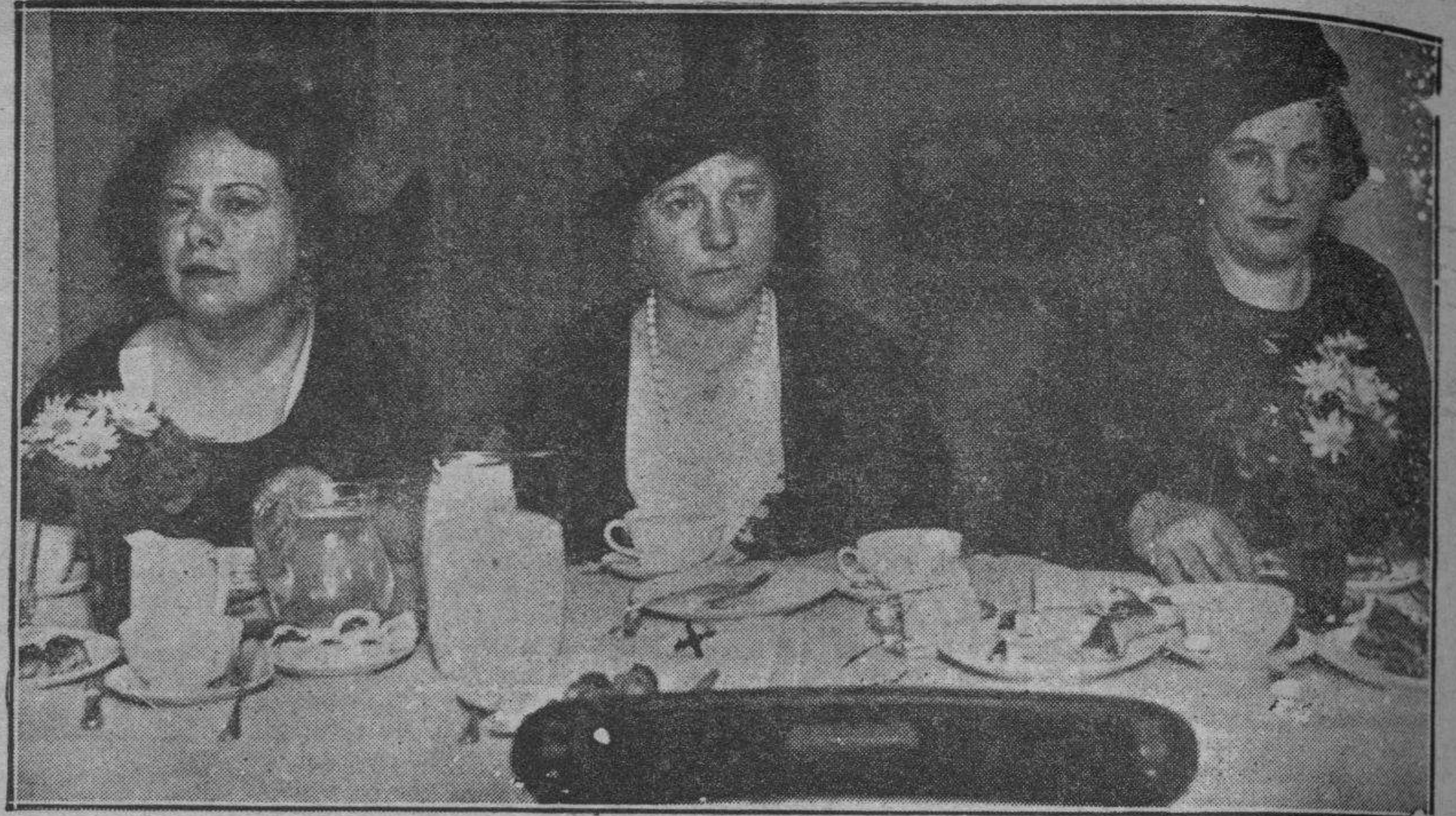
Señorita Palma Guillén, nombrada ministro de Méjico en Colombia.