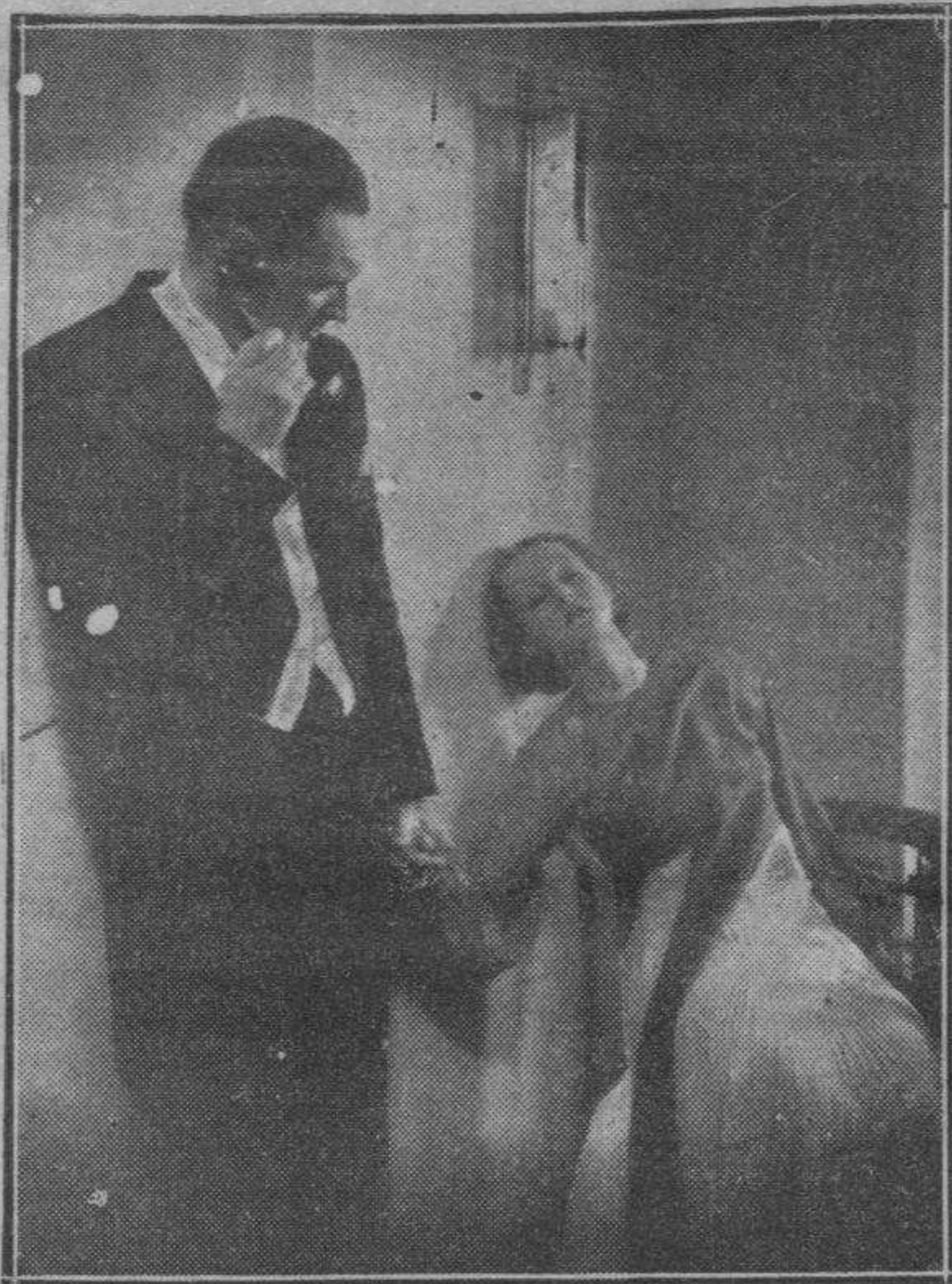
Escenas de "Una de nosotras" y "El hijo perdido" (de derecha a izquierda), cuya proyección en nuestra ciudad revestirá caracteres de gran acontecimiento.