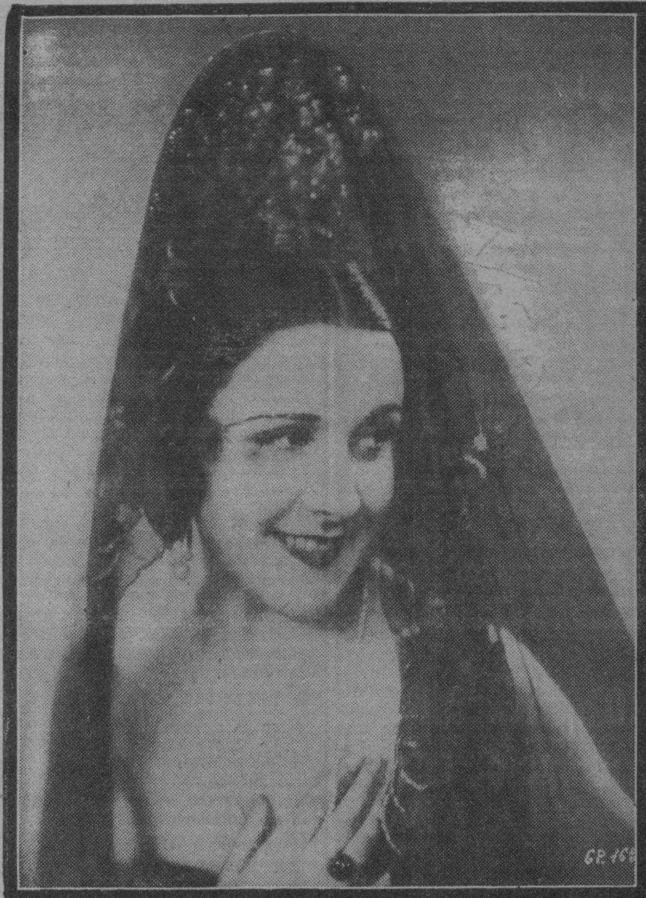
Imperio Argentina, la bella artista, todo simpatía, que ha triunfado nuevamente, extraordinaria superproducivamente en "La Hermana San Sulpicio", extraordinaria superproducivamente en "La Hermana San Sulpicio" española que ha dirigido nuestro paisano Florián Rey.

El triunfo de Imperio Argentina en "La Hermana San Sulpicio"