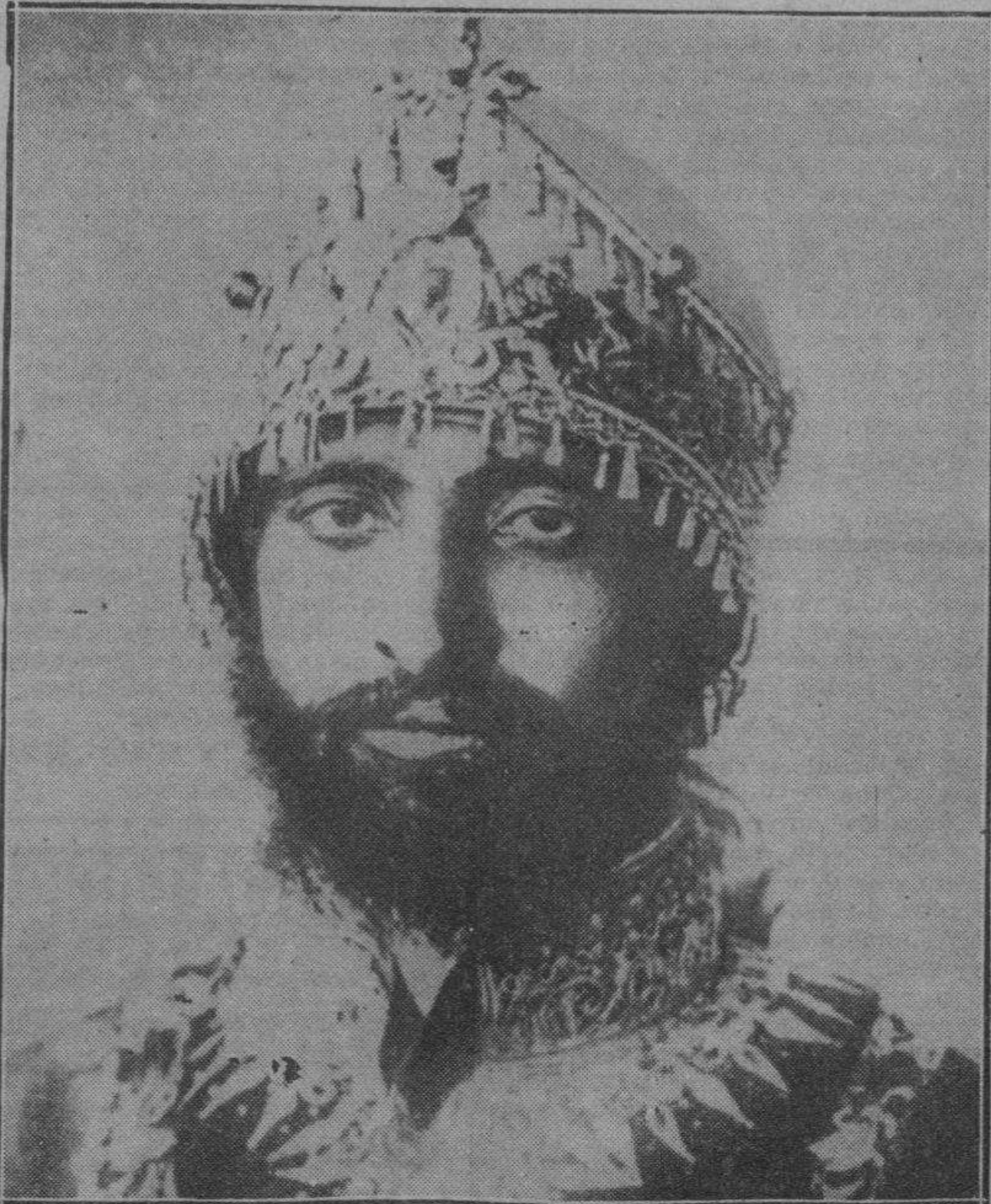
Este caballero, con faz de sacerdote egipcio o de aventurero digno de la novela, es el antiguo Ras Tafari, coronado emperador de Abisinia con el nombre de Haile Selassie. Litiga contra Italia. ¡Imperialismos!