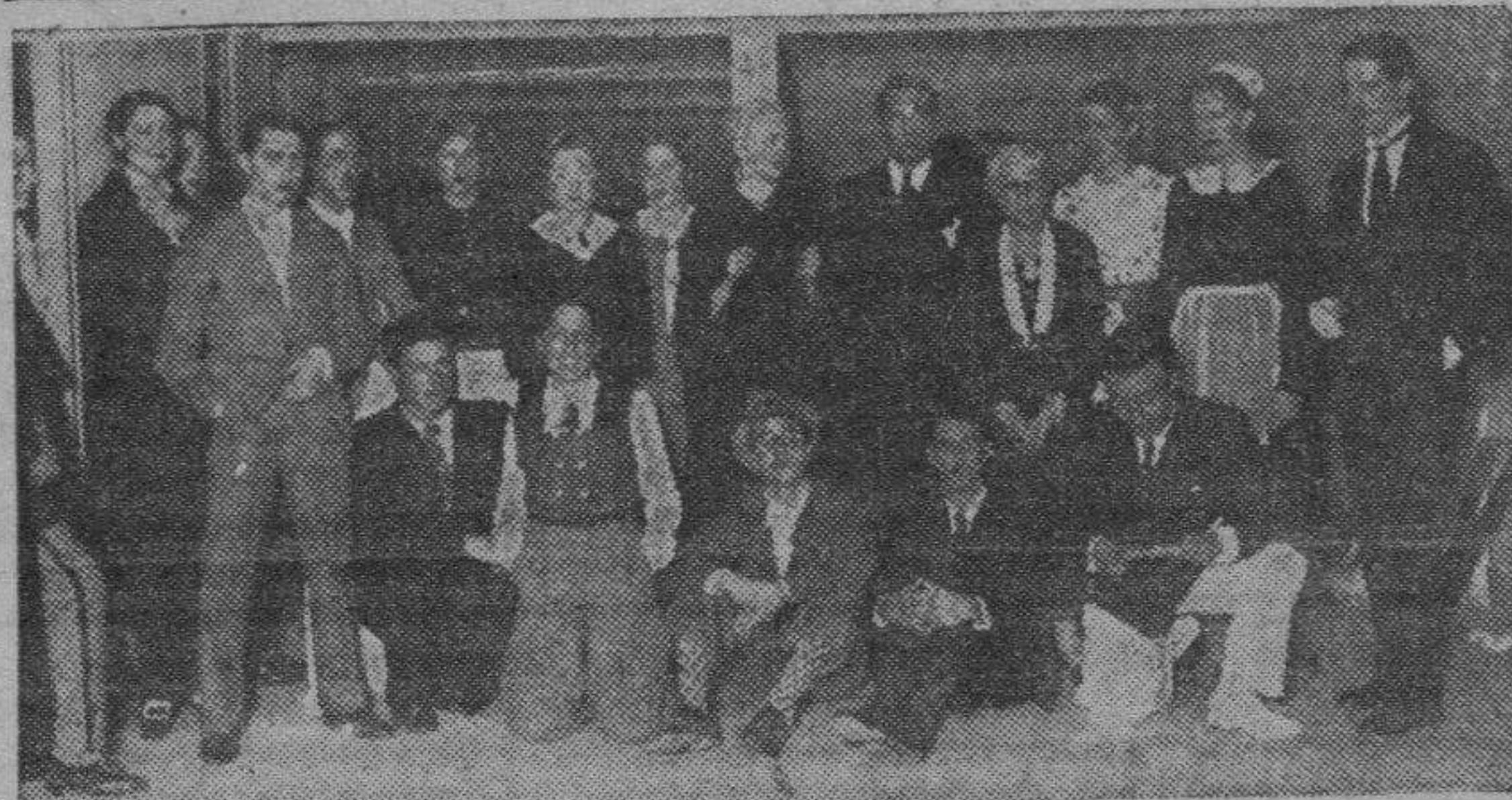
Distinguidos aficionados que, con éxito, interpretaron la comedia de Benavente "¡No quiero, no quiero!" en la Fiesta de Arte celebrada el martes último, en el teatro Goya, a beneficio de las Escuelas Dominicales.

Le fué apreciada fractura completa de la pierna derecha, por su tercio superior, siendo el pronóstico reservado.