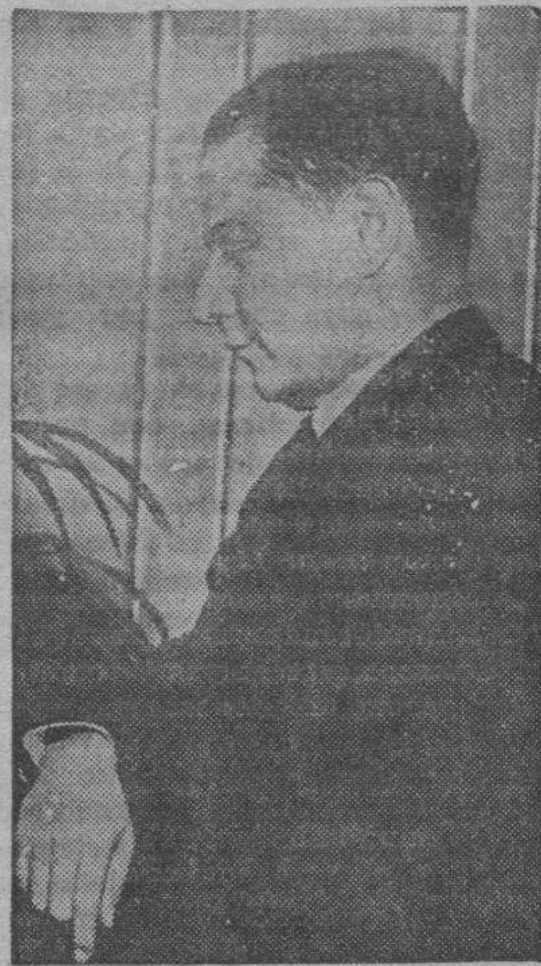
Capablanca, excampeón mundial de ajedrez.

Ya conocen nuestros lectores, a grandes rasgos, la organización y amplitud de este torneo, único en el mundo ajedrecista. Pero este torneo que ya de por sí atrae a esta ciudad una multitud de espectadores aficionados y hace que la afición mundial concentre en él su atención, ha logrado este año despertar un interés vivísimo. La actuación de Capablanca, el tantas veces imbatido campeón del mundo que al fin sucumbiera ante Alhekin, era un interrogante abierto ante el curso triunfante de la moderna escuela rusa, en pugna contra la antigua escuela por aquél representada. Borinnik, Flohr y Lillientahl, cuyos éxitos en los últimos torneos acreditaba en ellos maderamente