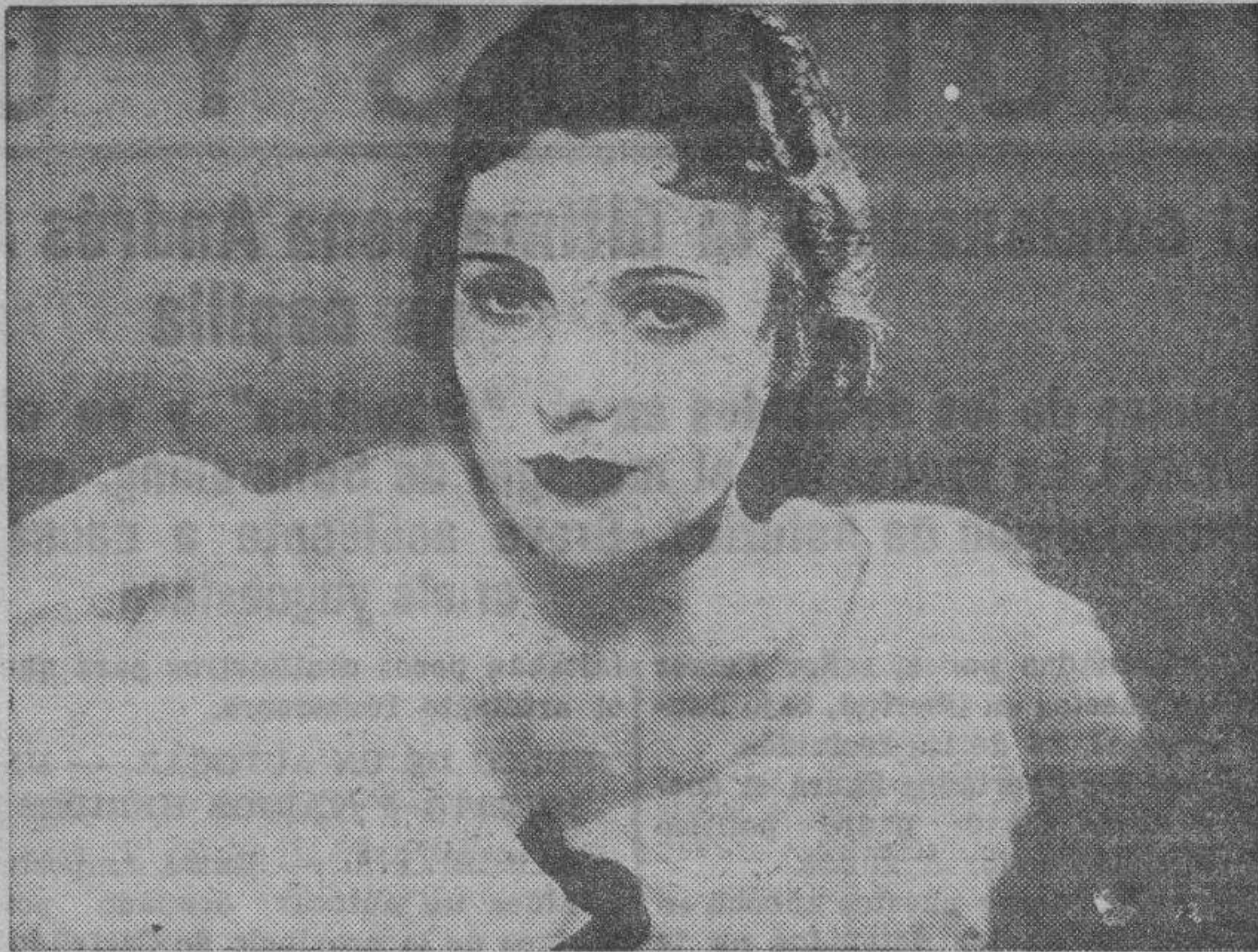
La bellísima y sugestiva Suzy Vernon, protagonista de la película "Cocktail de Besos", próxima a estrenarse en Zaragoza.