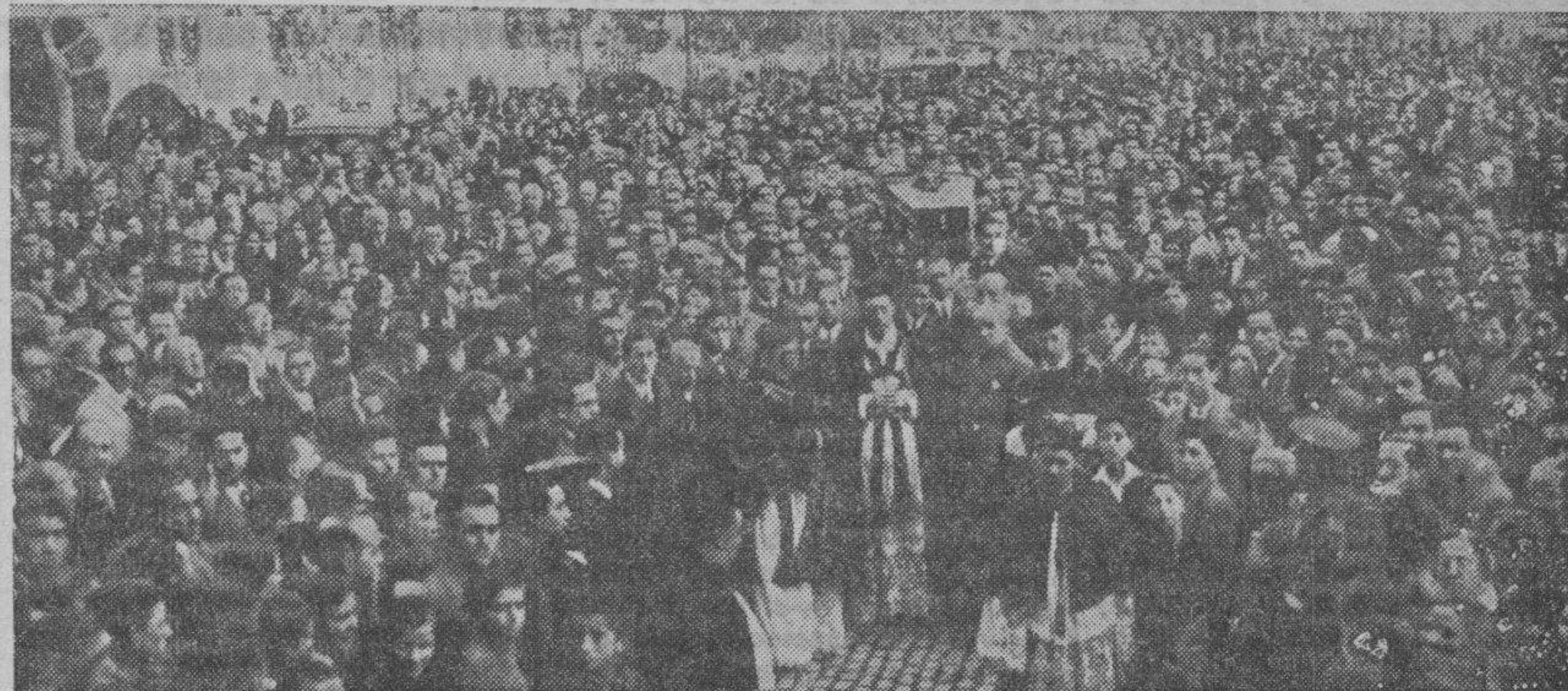
El entierro del ilustre cirujano don Ricardo Lozano y Monzón constituyó una imponente manifestación de duelo. Profesores, alumnos y amigos, rindieron su postrer homenaje al eminente hombre de ciencia aragonés.

Hacia mucho tiempo que la explosión del sentimiento ciudadano no se exteriorizaba de modo tan