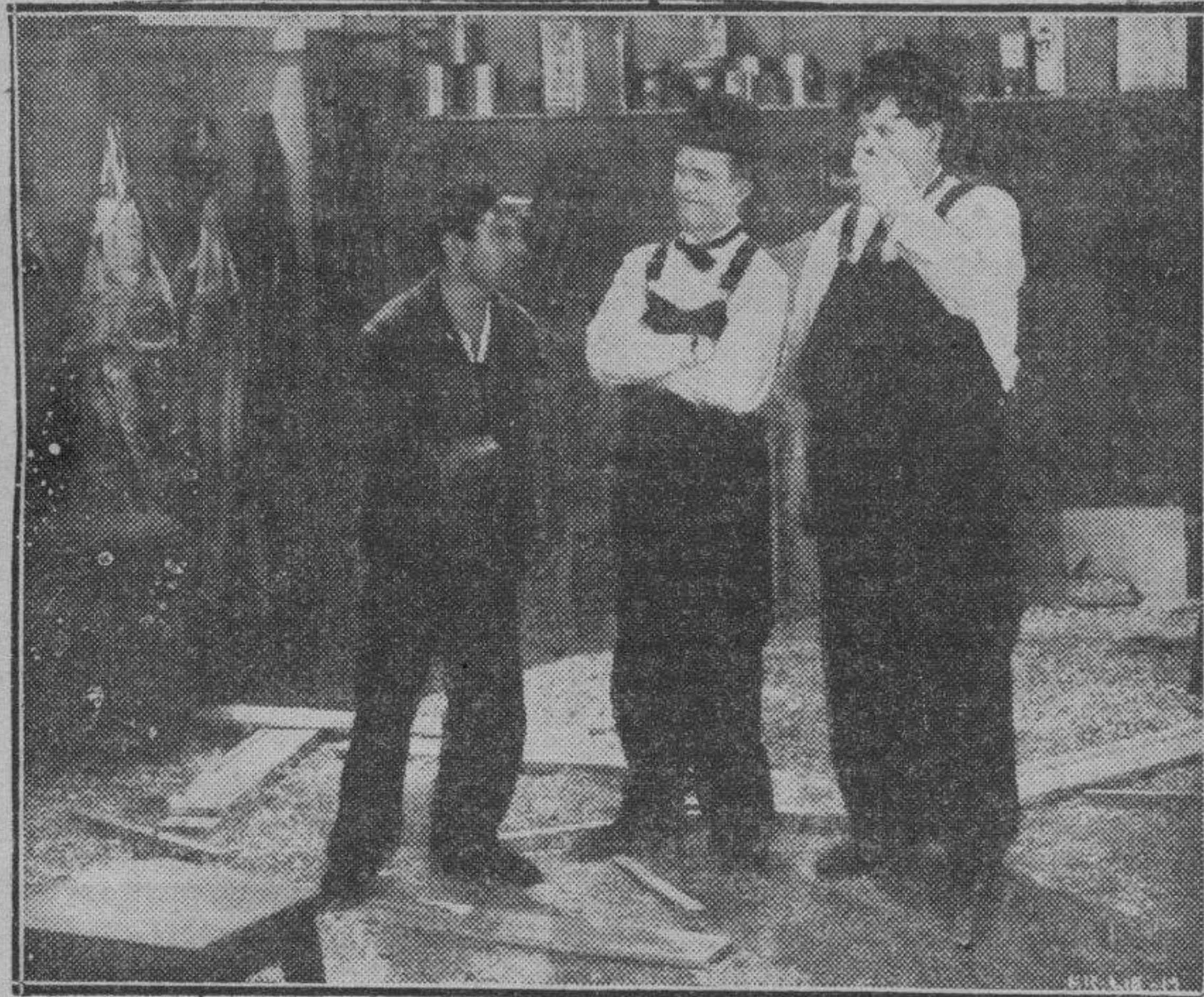
Stan Laurel y Oliver Hardy en una divertida escena de "¿Por qué trabajar?"