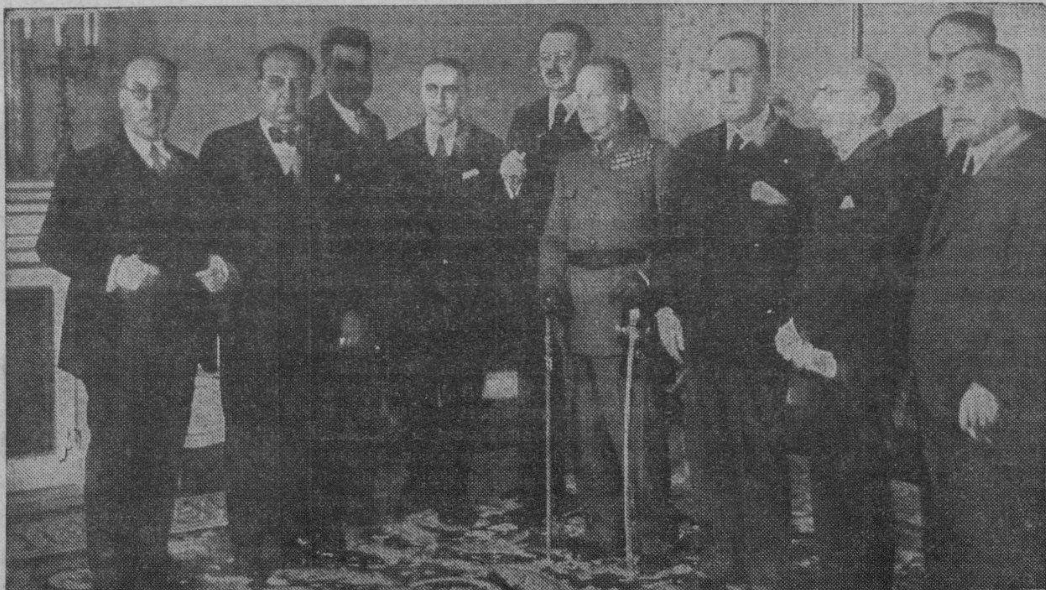
El general López Ochoa en su visita al Gobierno, que estaba reunido en la Presidencia.

parisiense, o de un zaragozano. Creemos posible que el doctor ensaye procedimiento e injerte a un viejo malasio las glándulas de un gigantesco carnero argentino. ¿Resultado?